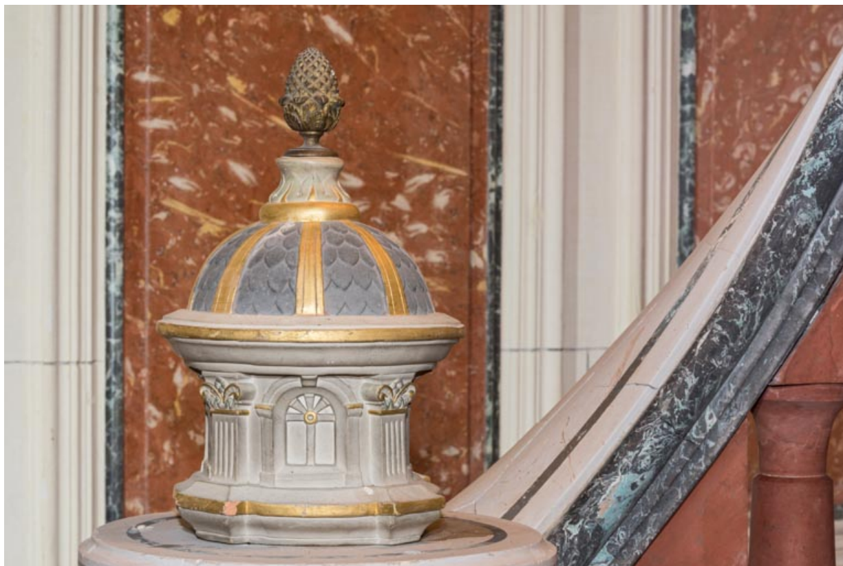
Départ de rampe : motif d'amortissement.