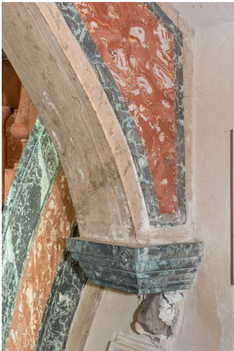
Décor de faux marbre du départ d'arc et de son culot.