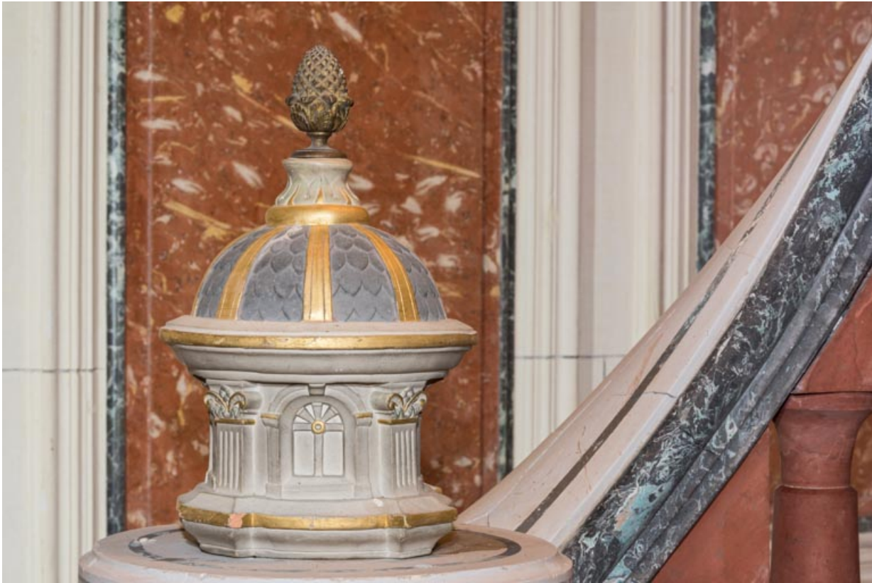
Départ de rampe : motif d'amortissement. 21, Chevigny-en-Vallière, 23 rue Mercey