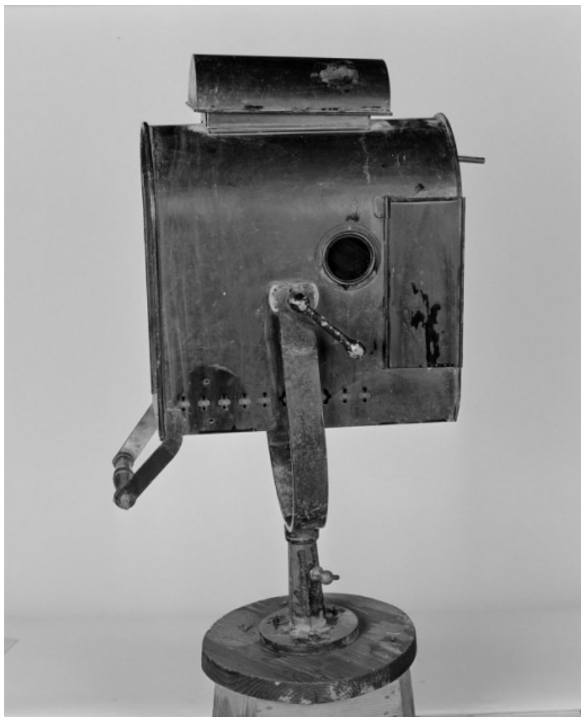
Vue de profil, en 1988.