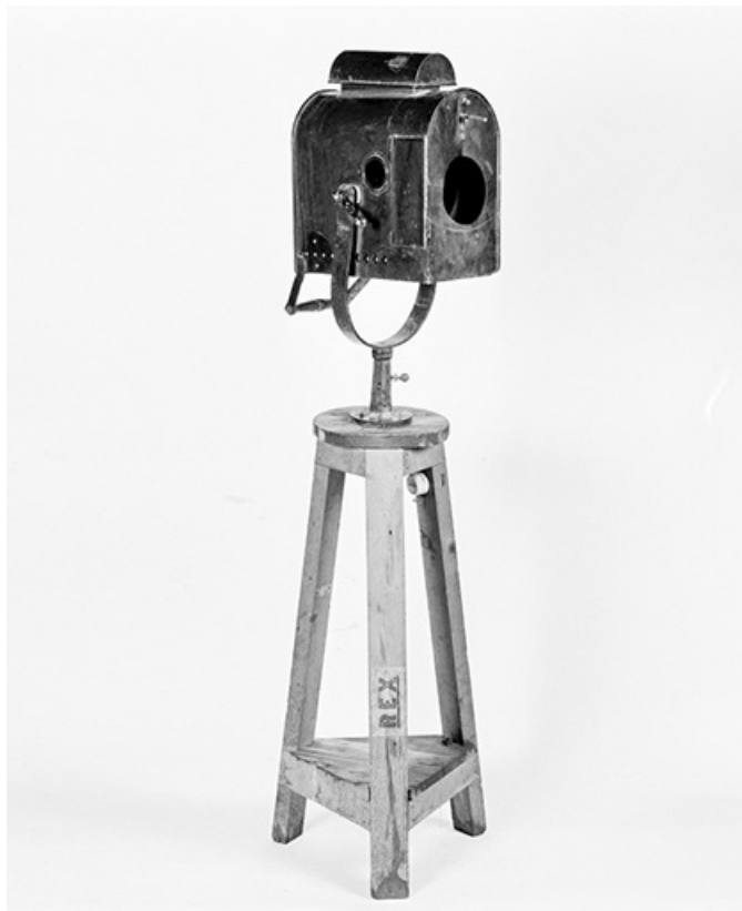
Vue d'ensemble, en 1988.