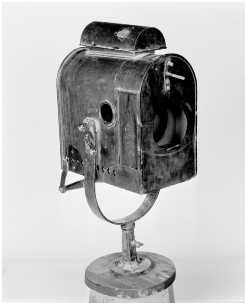
Vue de trois quarts avant, en 1988.