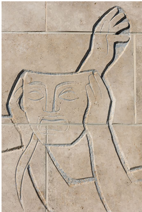
Masque scénique tenu par la comédienne.