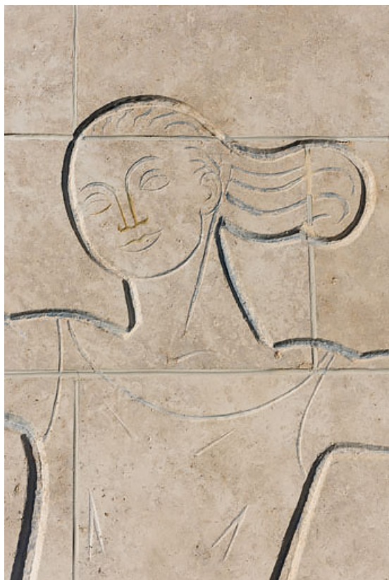
La danseuse (détail).