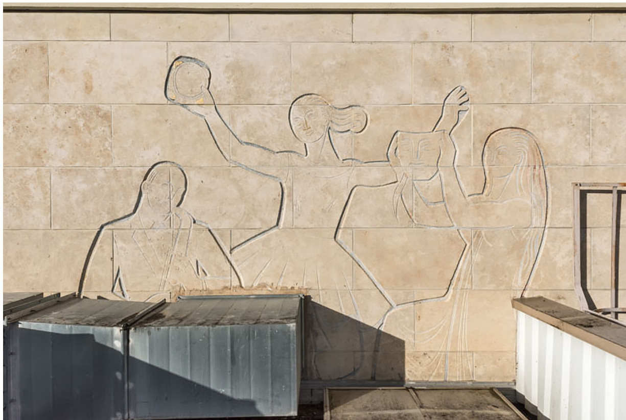
Façade antérieure : relief gravé en partie supérieure.