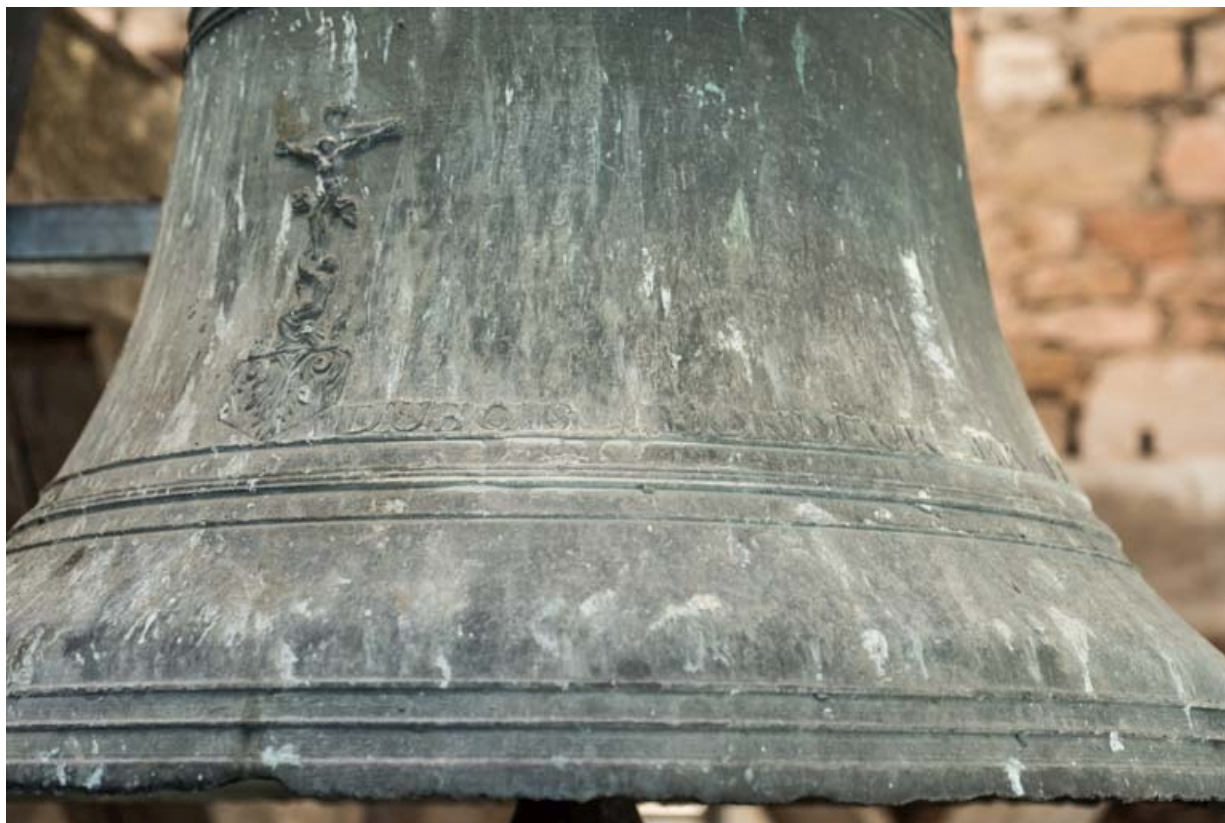
Détail du Christ en croix sur la petite cloche. 21, Auxey-Duresses