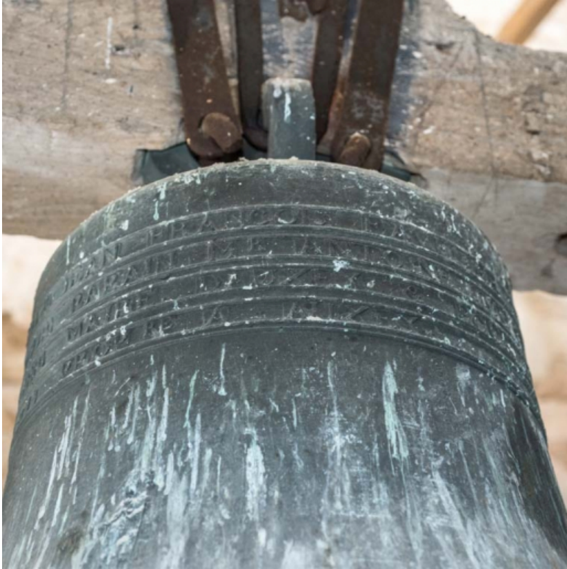
Détail de l'inscription sur la petite cloche.