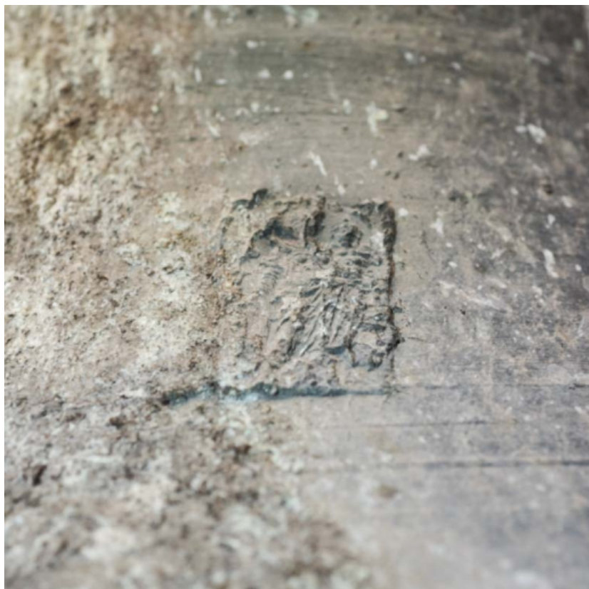
Grosse cloche : détail.