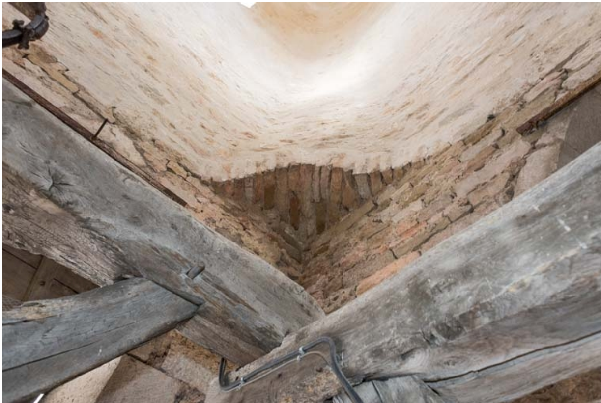
Vue du clocher en tuf depuis le niveau abritant les cloches.