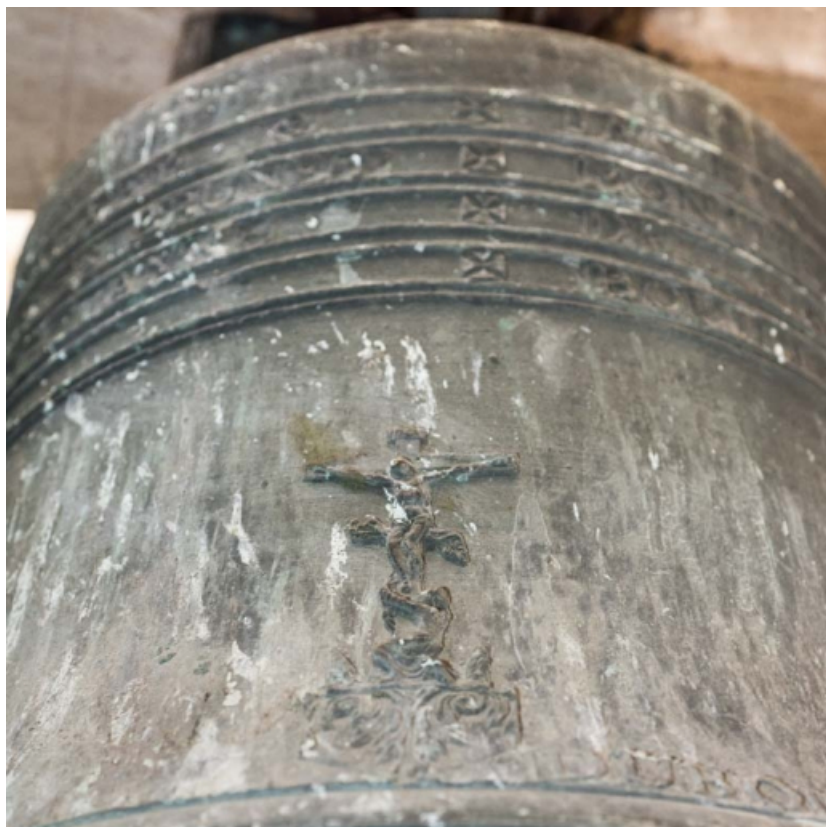
Détail du Christ en croix sur la petite cloche.