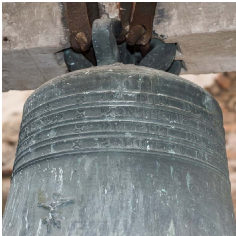
Détail de l'inscription sur la petite cloche.