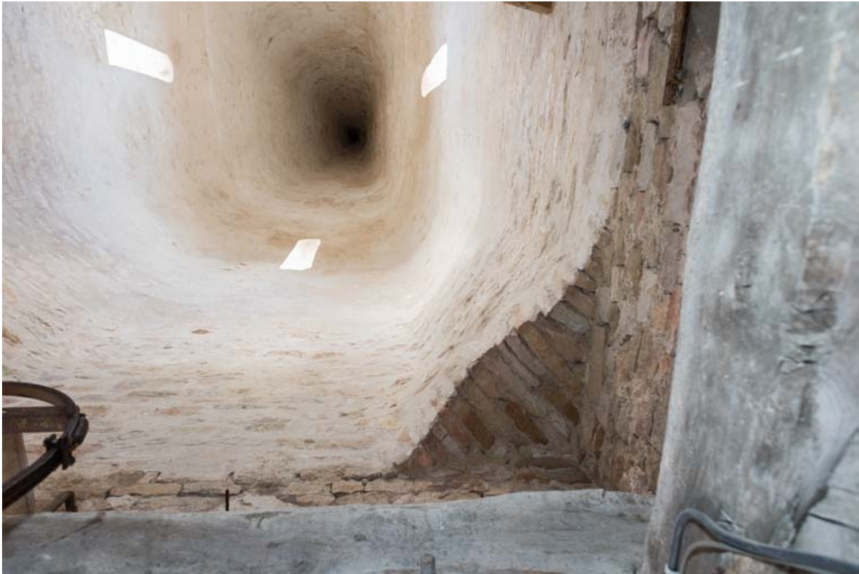
Vue du clocher en tuf depuis le niveau abritant les cloches. 21, Auxey-Duresses