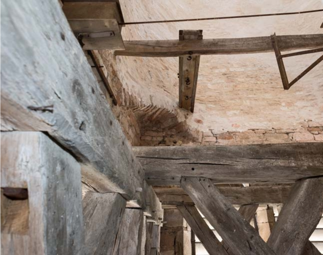
Vue du clocher en tuf et de l'assemblage des poutres.