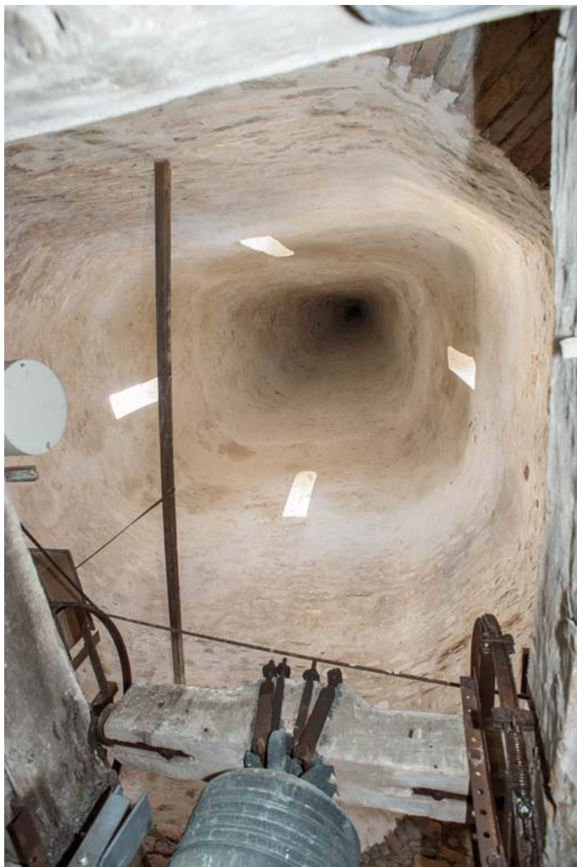
Vue du clocher en tuf depuis le niveau abritant les cloches.