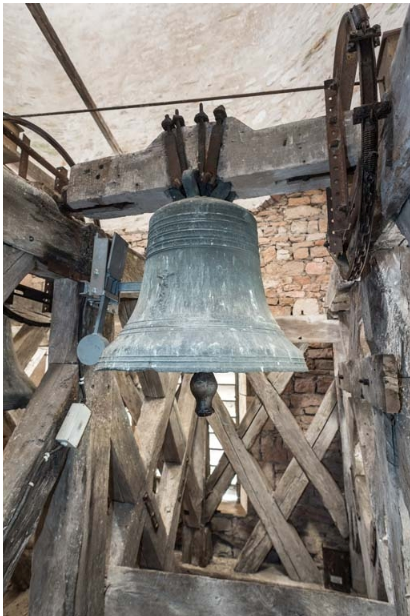
Vue d'ensemble de la petite cloche.