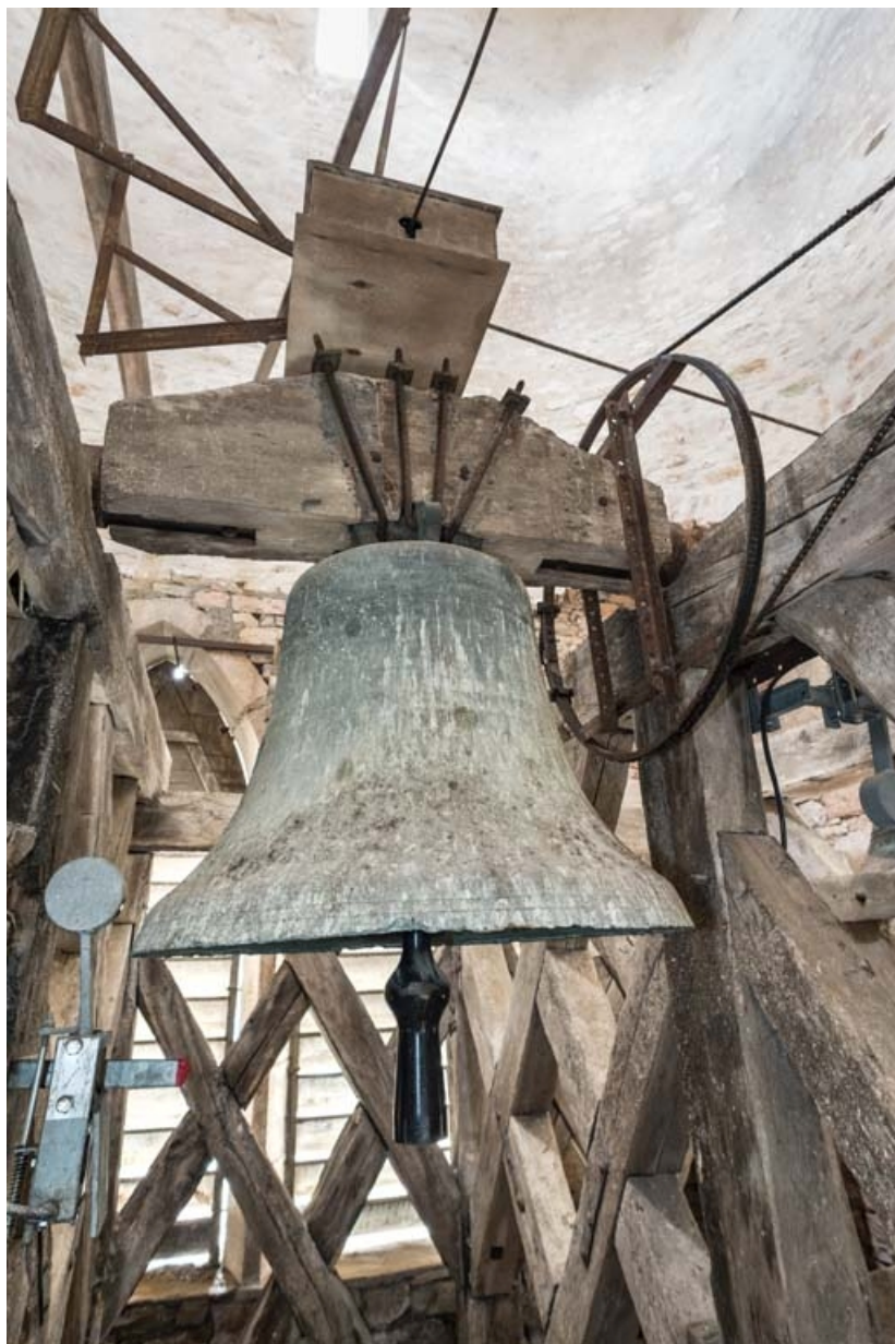
Grosse cloche. 21, Auxey-Duresses