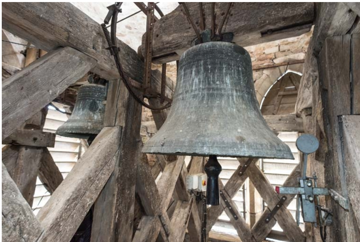
Vue d'ensemble des deux cloches.