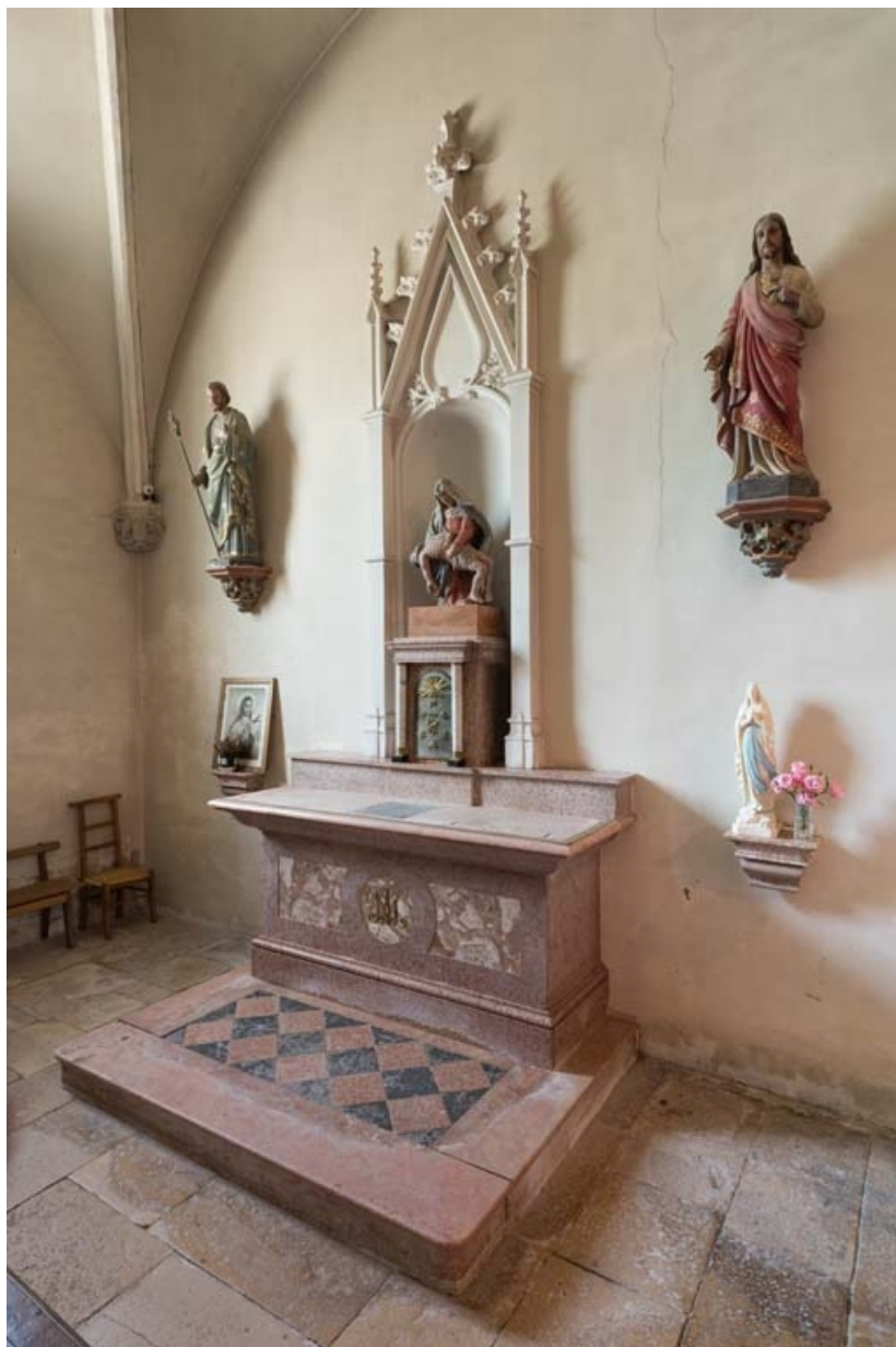
Vue d'ensemble de l'autel de la chapelle nord avec le groupe sculpté. 21, Auxey-Duresses