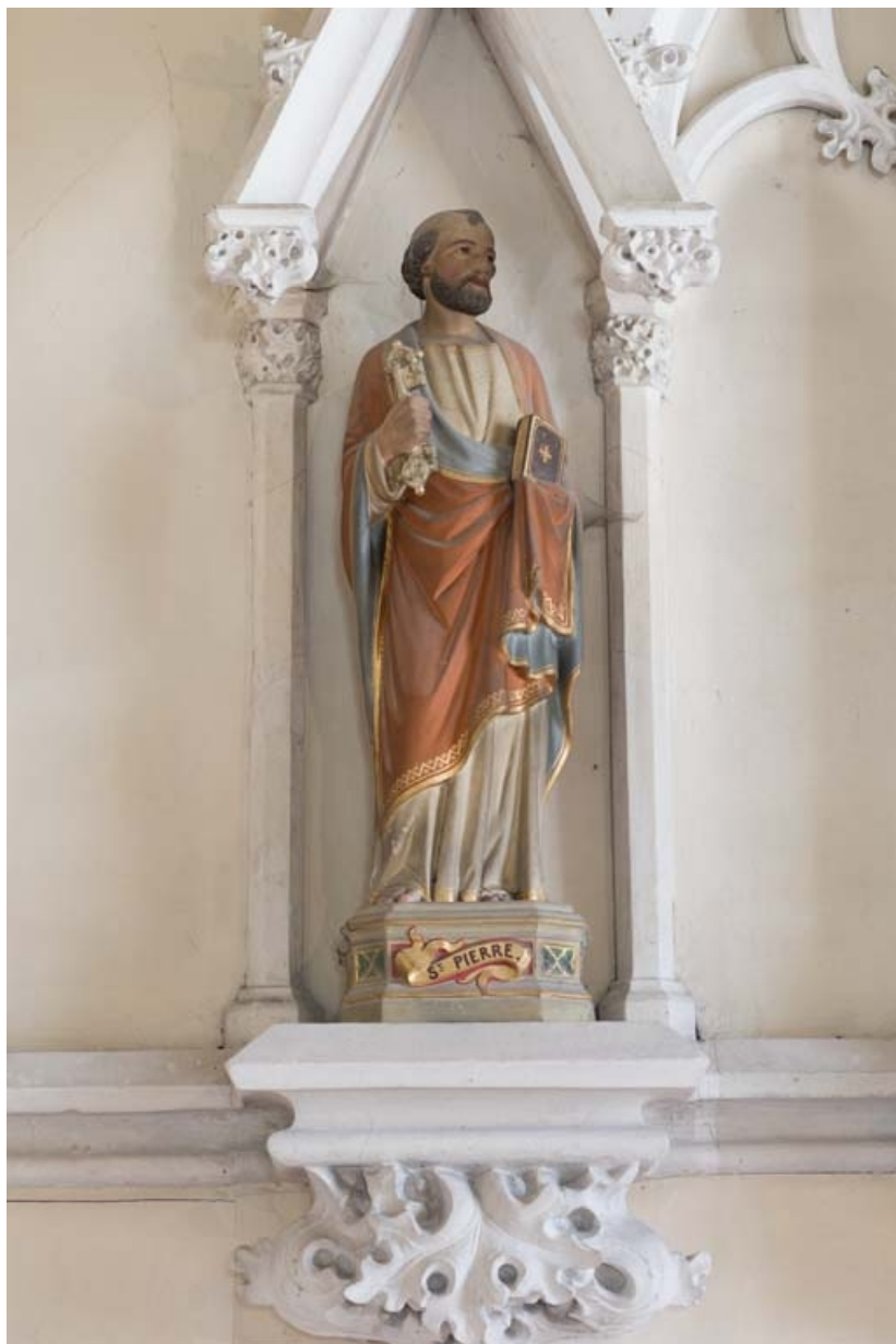
Statue de saint Pierre à gauche du chœur.