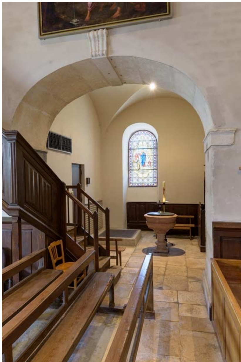
Chapelle des fonts baptismaux.