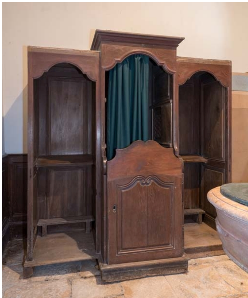
Vue d'ensemble du confessionnal.