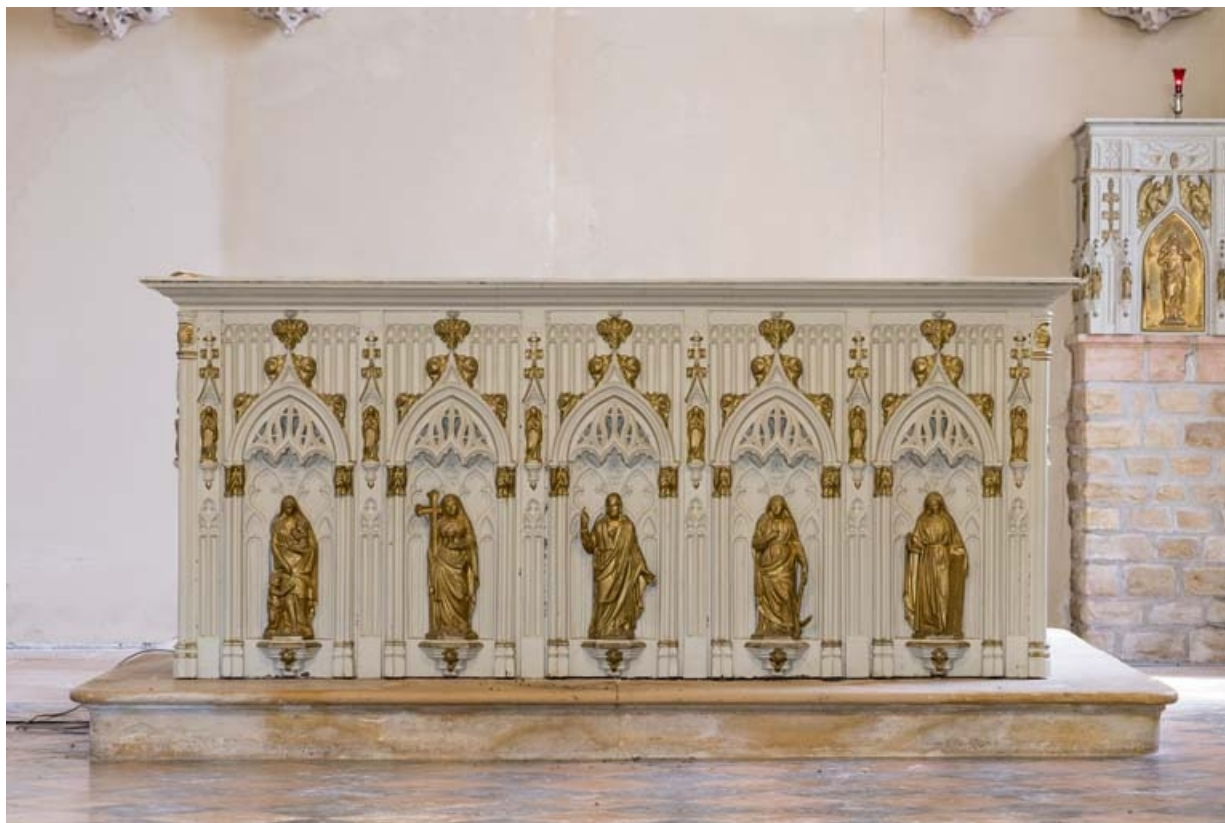
L'autel majeur vu de face.