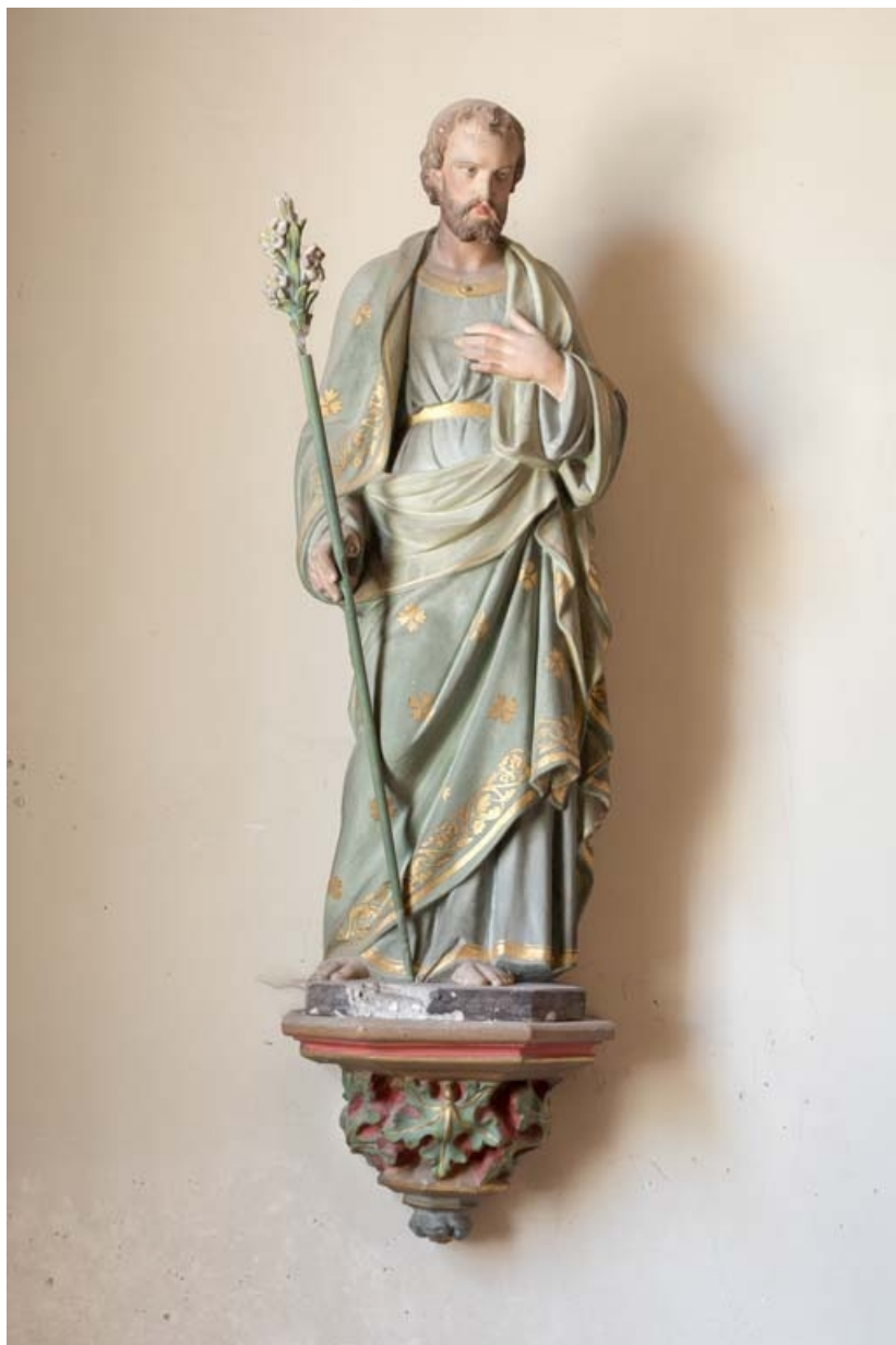
Saint Joseph (?) ; chapelle nord.