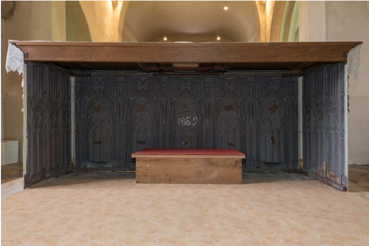
Revers de l'autel.