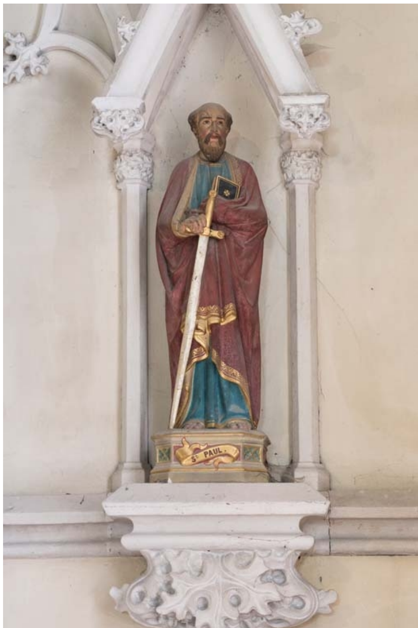
Statue de saint Paul à droite du chœur.