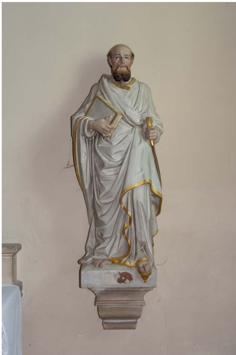
Statue d'un saint à droite de l'autel sud.