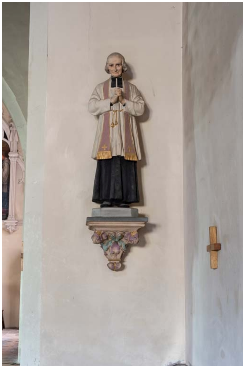
Le curé d'Ars.