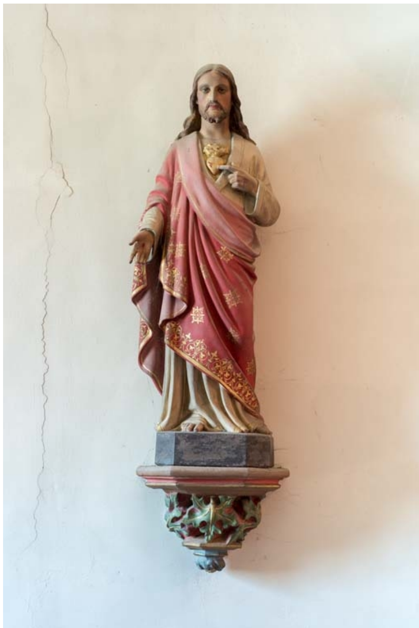
Jésus Christ montrant son cur et ses plaies, chapelle nord.