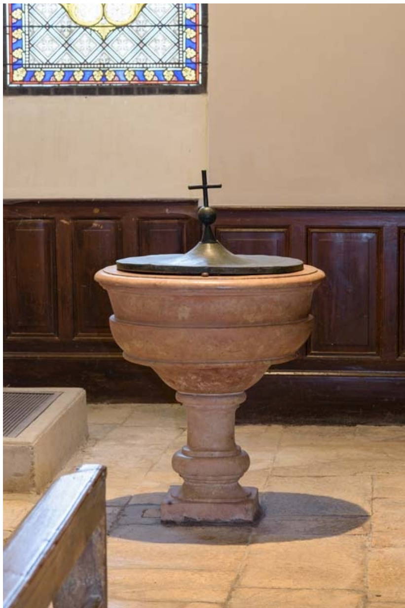
Fonts baptismaux : vue d'ensemble.