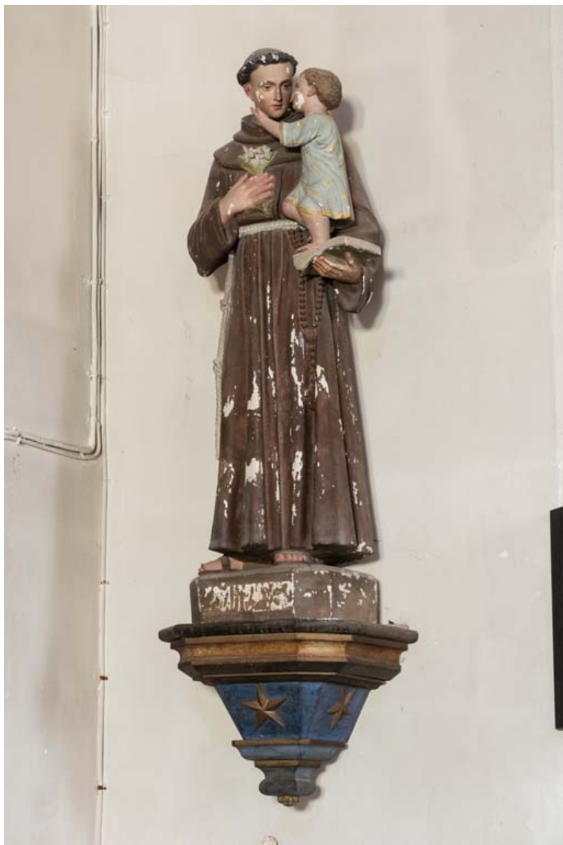
Saint Antoine de Padoue.