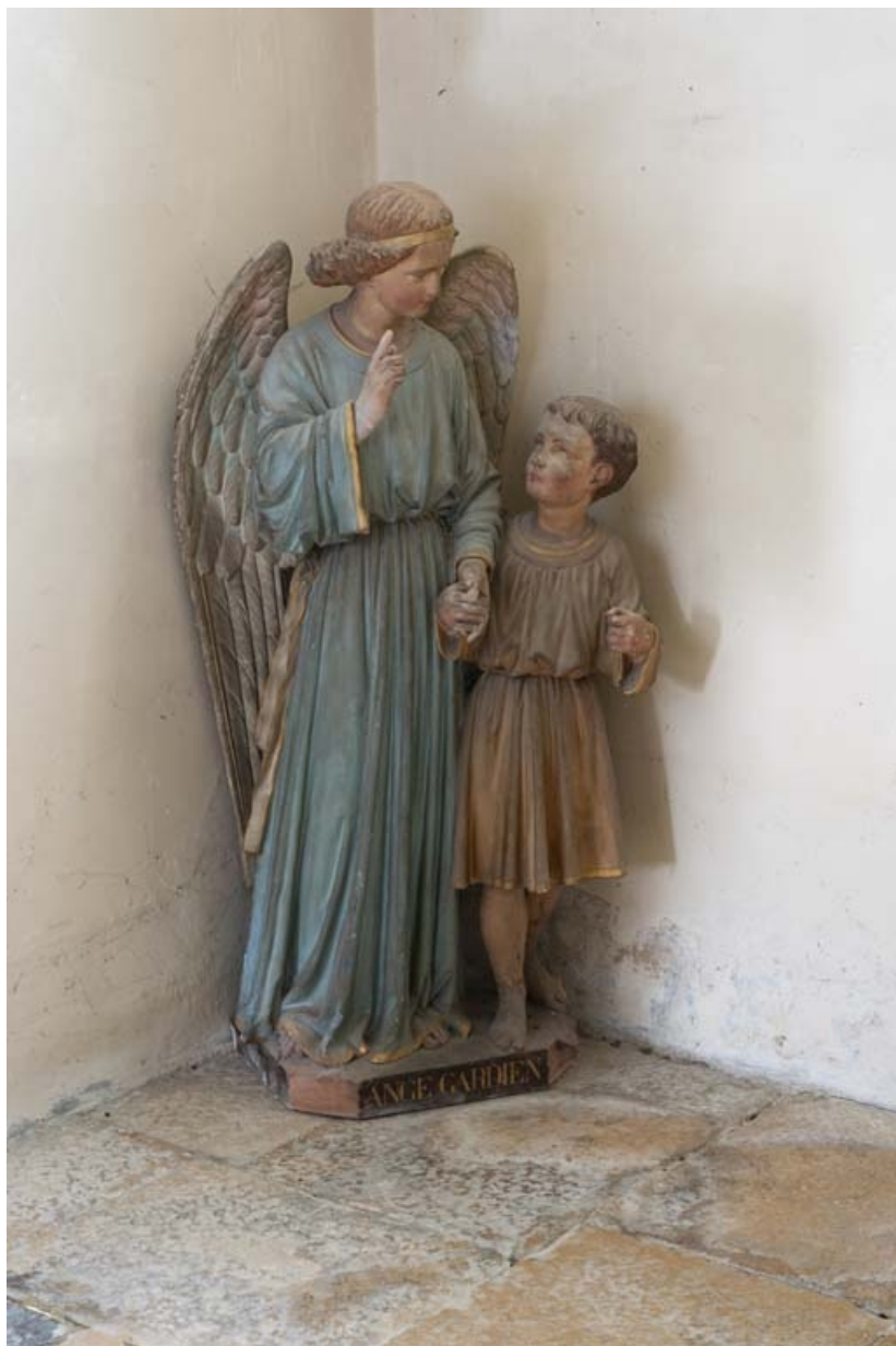
Statue d'un ange gardien, chapelle sud.