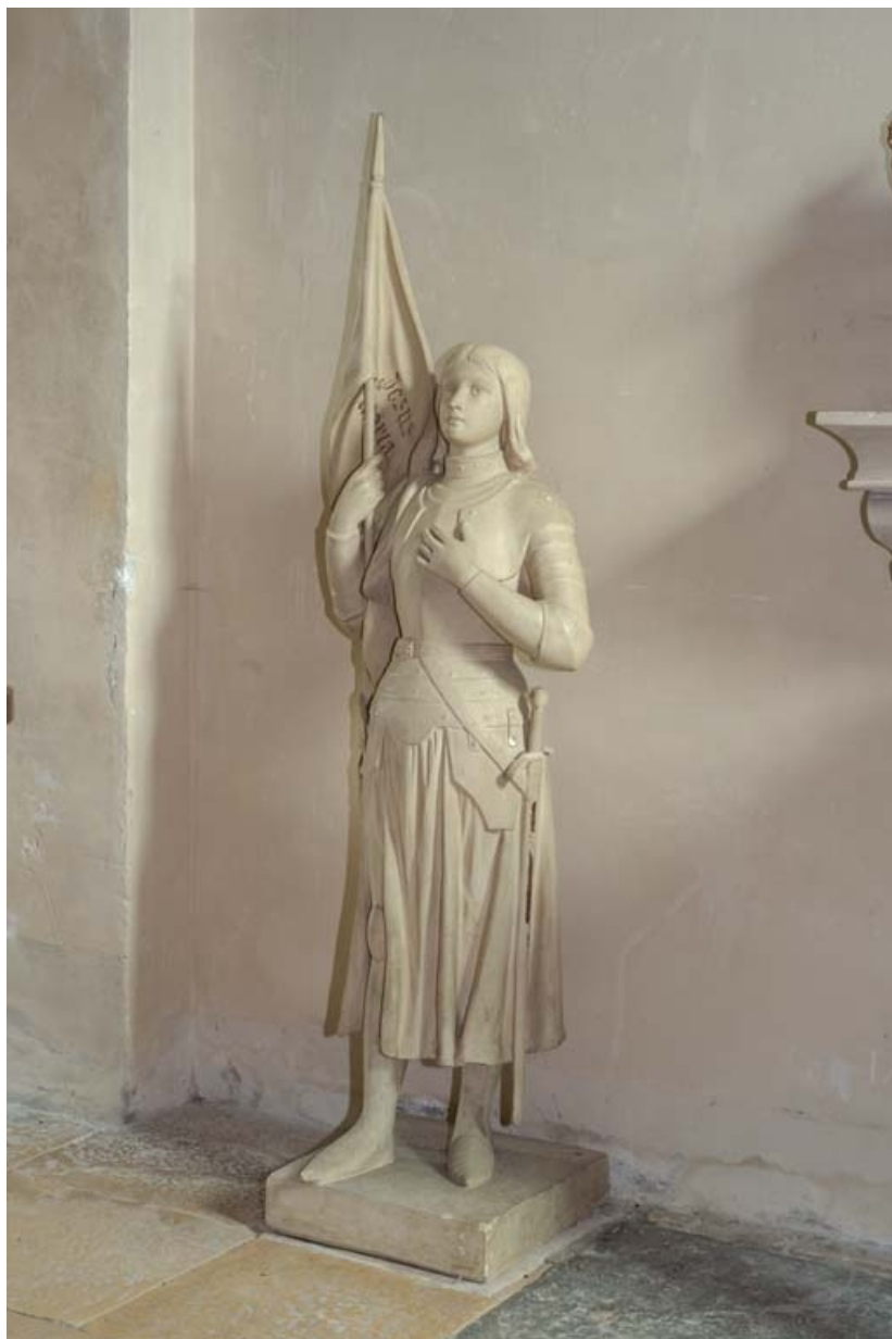
Statue de sainte Jeanne d'Arc, chapelle sud.