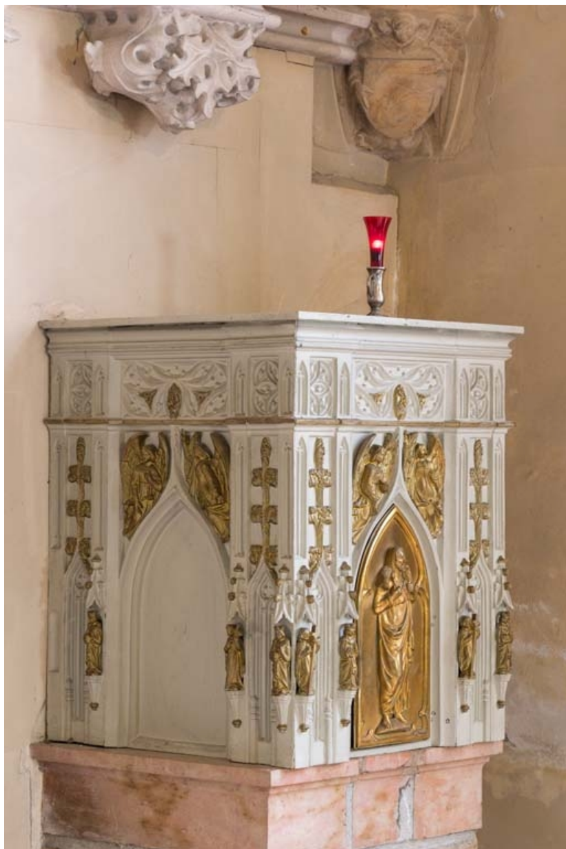
Vue d'ensemble du tabernacle.