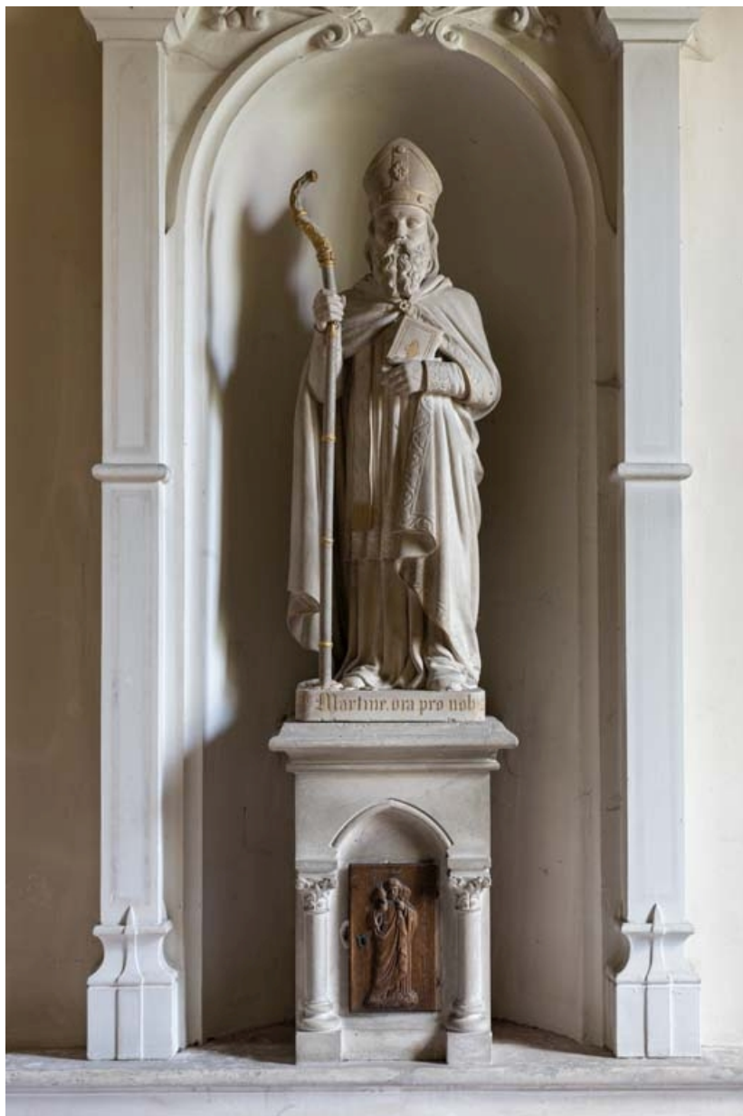
Statue et tabernacle de la chapelle sud : saint Martin.