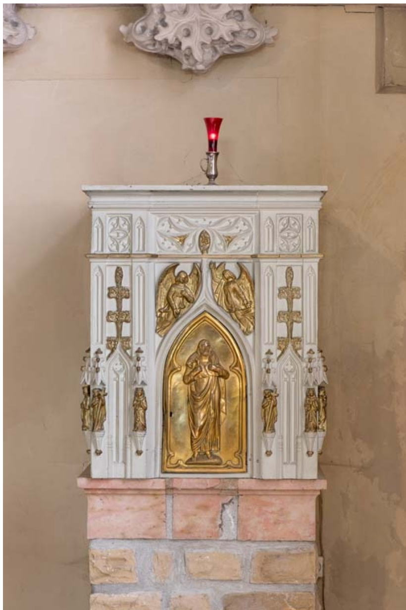
Vue d'ensemble du tabernacle.