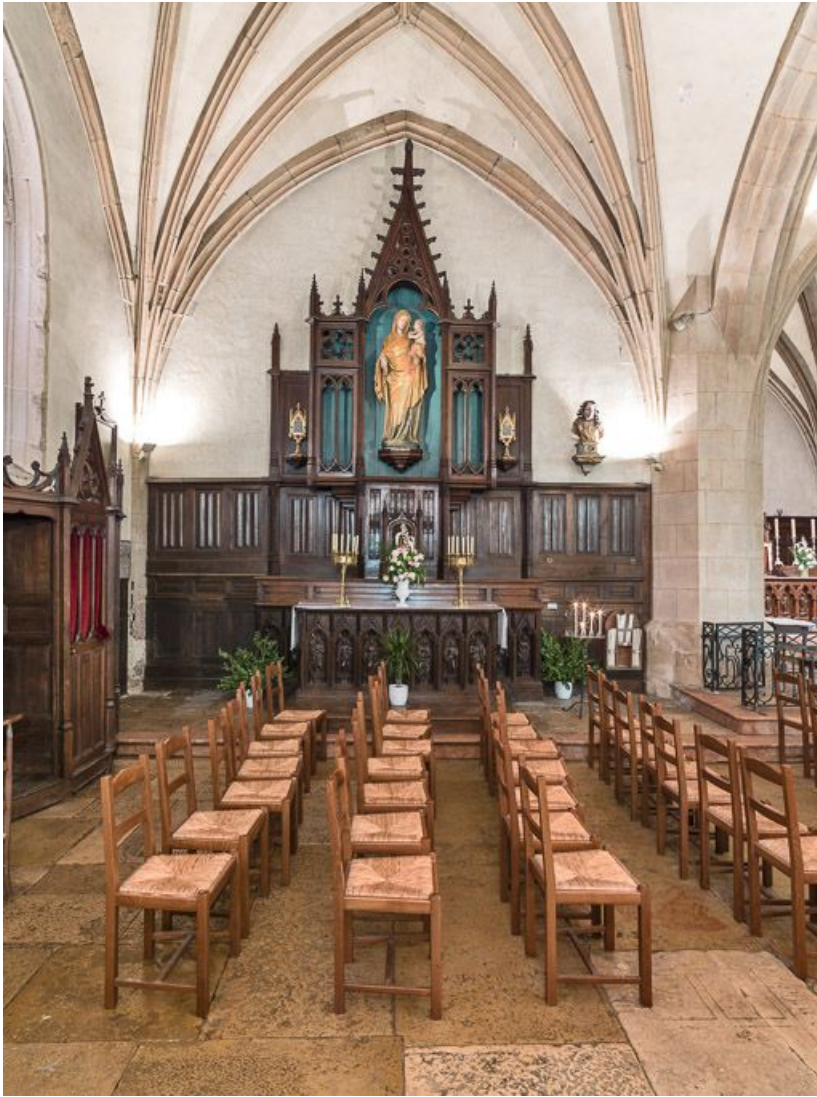
Chapelle du bas côté gauche avec la statue.

21, Meursault place de l' Hôtel-de-Ville