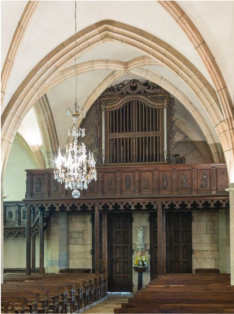
La tribune d'orgue.

21, Meursault place de l' Hôtel-de-Ville