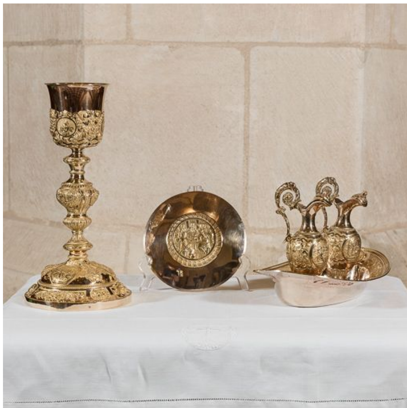
Vue d'ensemble du calice, de la patène et des burettes.

21, Meursault place de l' Hôtel-de-Ville