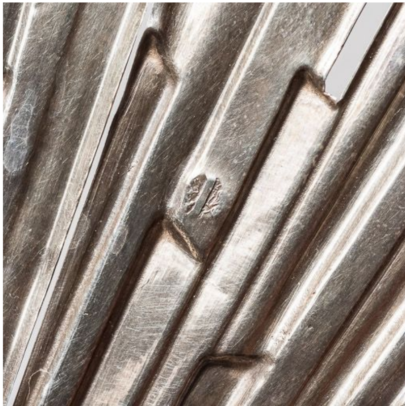
Détail de poinçon dans la gloire.