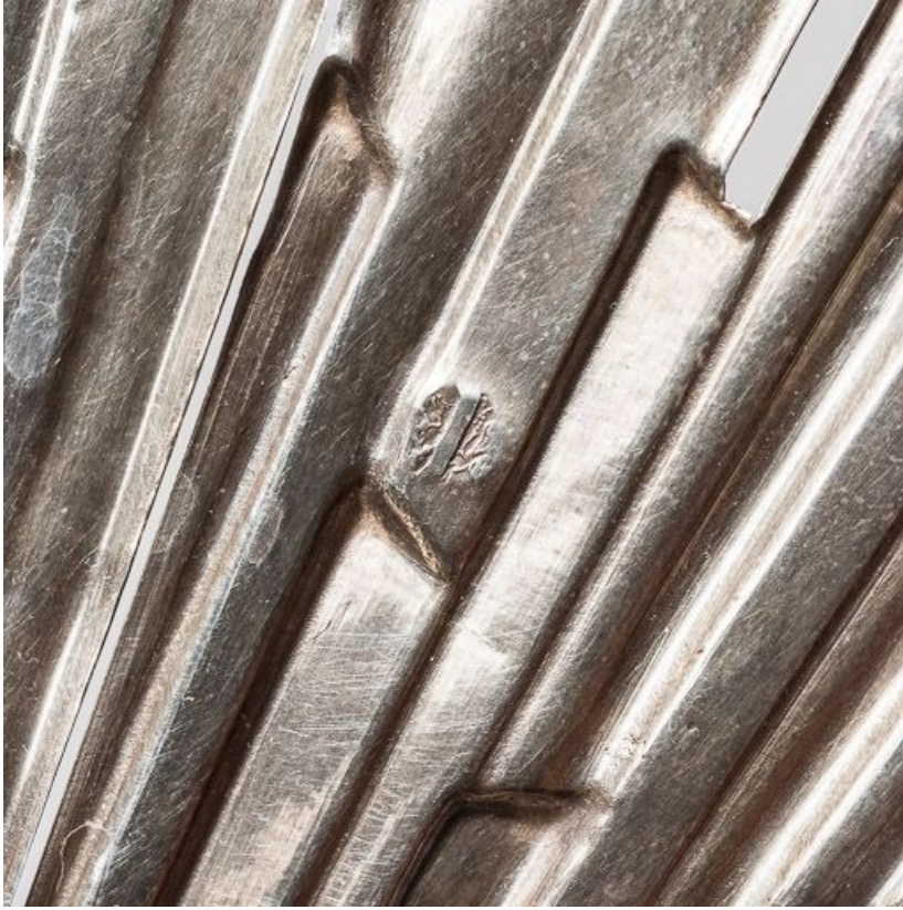
Détail de poinçon dans la gloire.