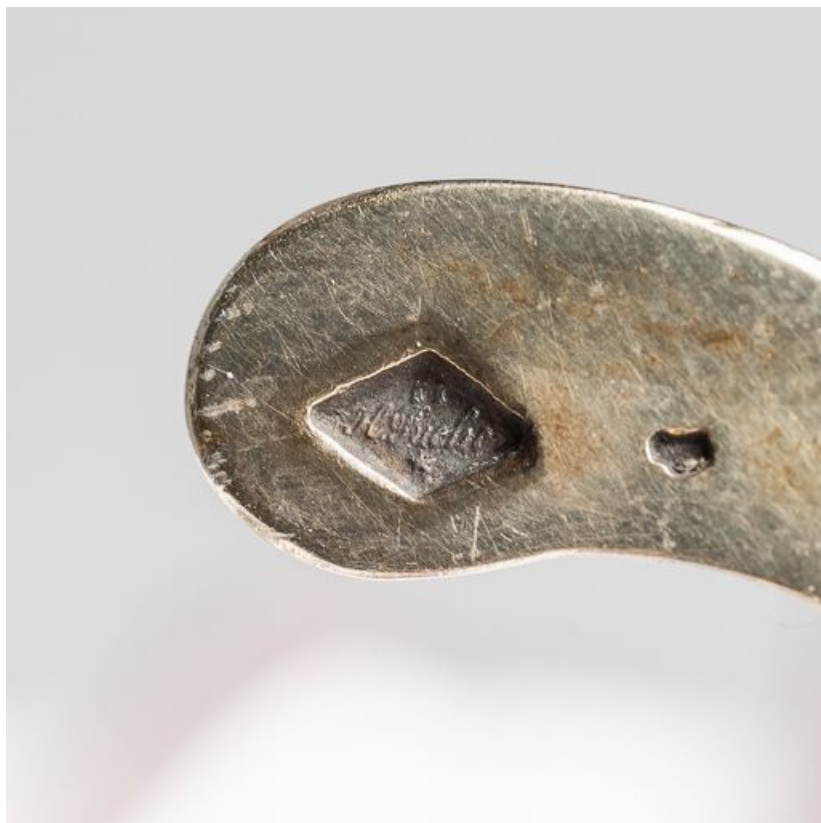
Détail du poinçon de maître.