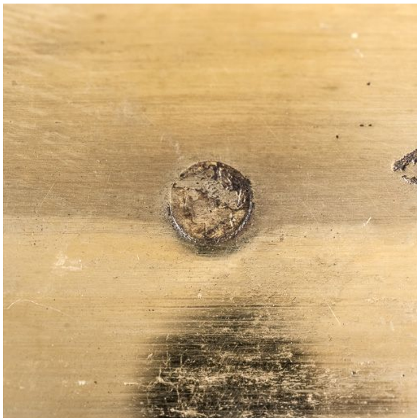
Détail de poinçon sur la lèvre de la coupe.