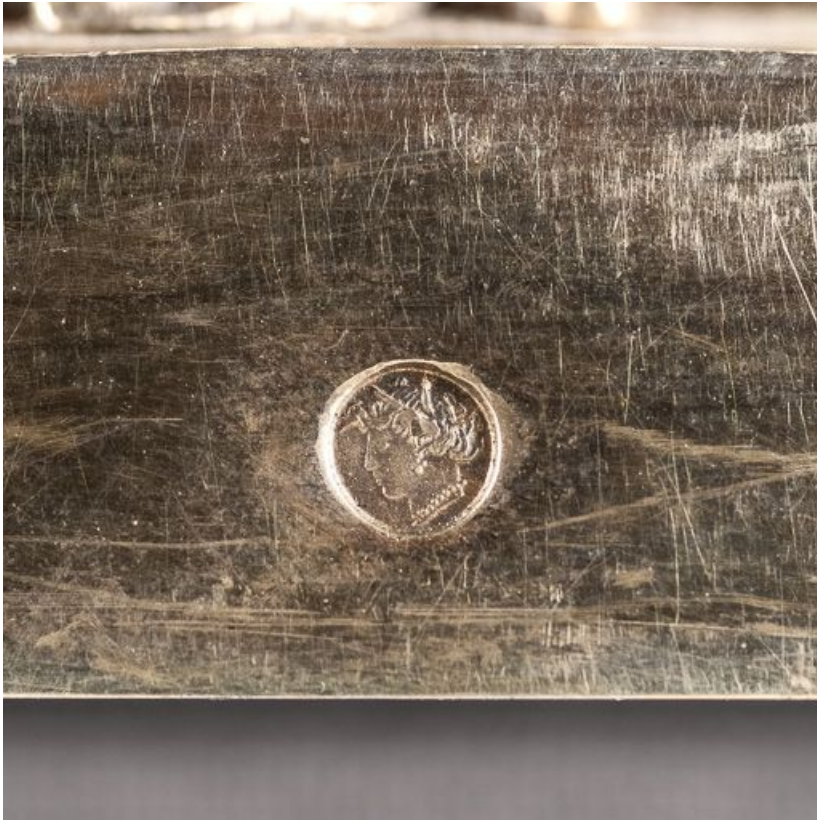
Poinçon sur la base. 21, Savigny-lès-Beaune