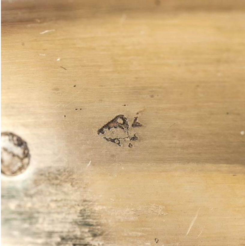
Détail de poinçons sur la lèvre de la coupe.