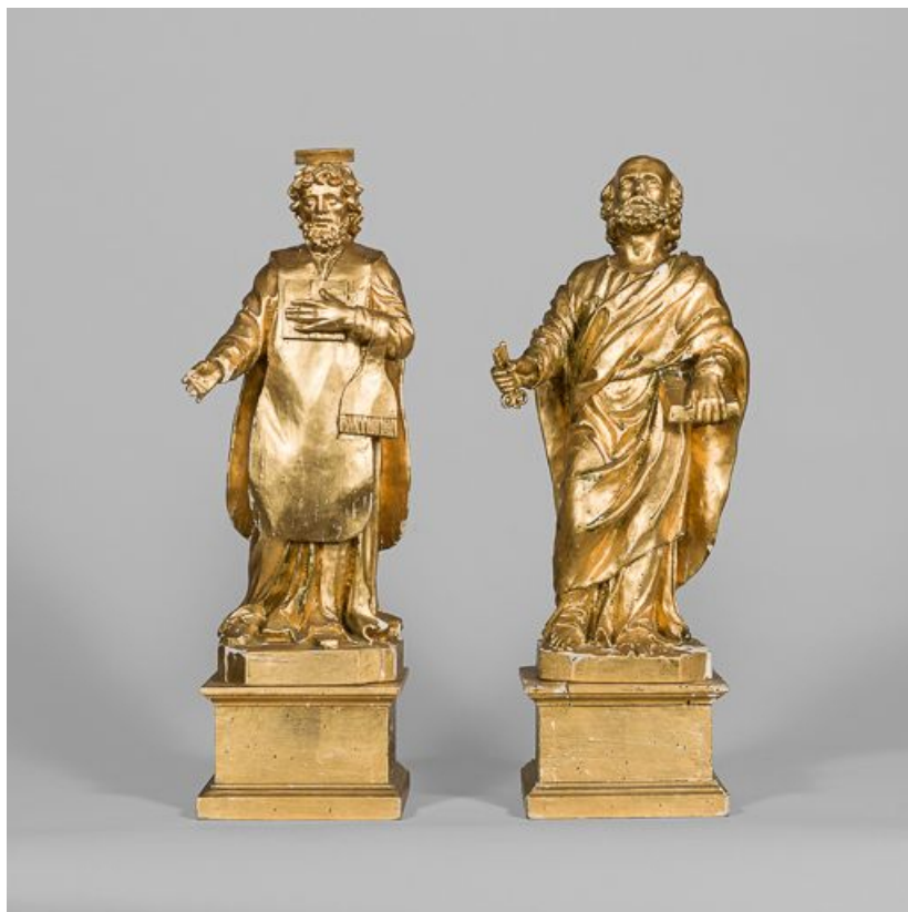
Saint Bénigne et saint Pierre.