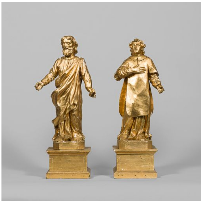
Saint apôtre et saint diacre.