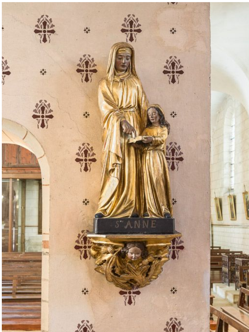
Sainte Anne et la Vierge.