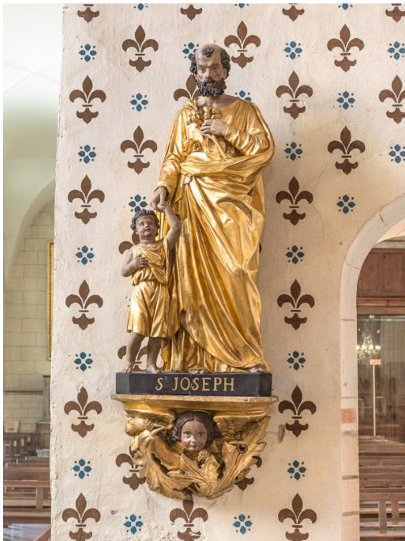
Saint Joseph et l'Enfant Jésus, vue générale. 21, Savigny-lès-Beaune