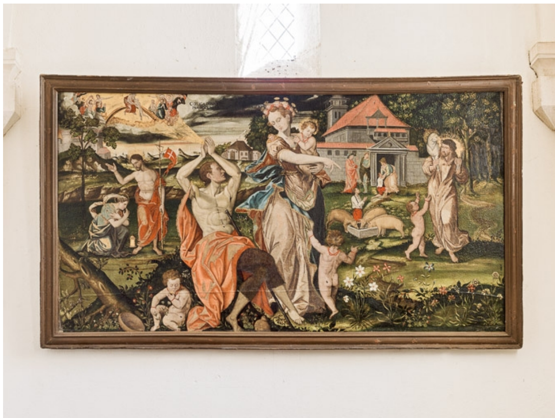
Vue d'ensemble. 21, Aloxe-Corton