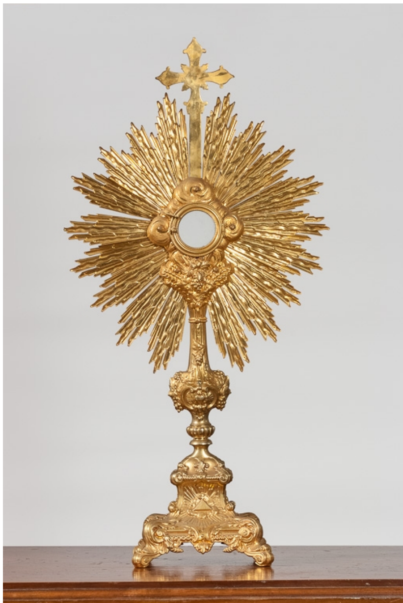
Vue d'ensemble, revers.