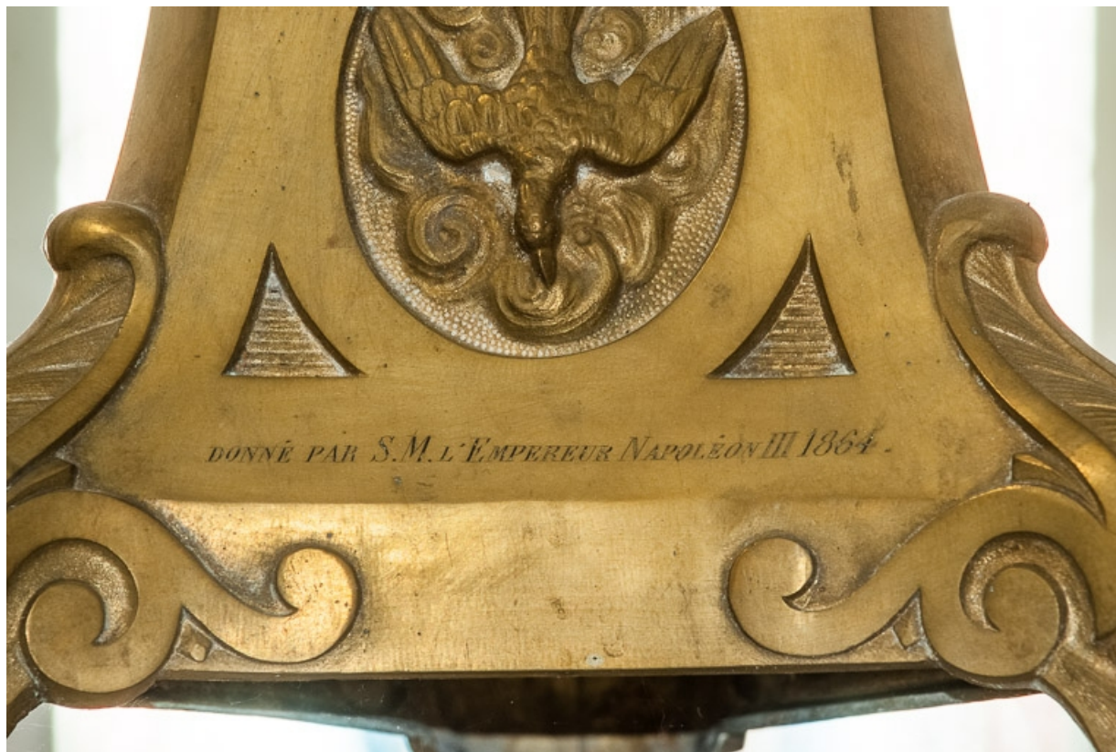
Détail de l'inscription du don de Naopléon III sur la croix d'autel.

21, Aloxe-Corton, Allée Jules-Senard-Louis-Latour