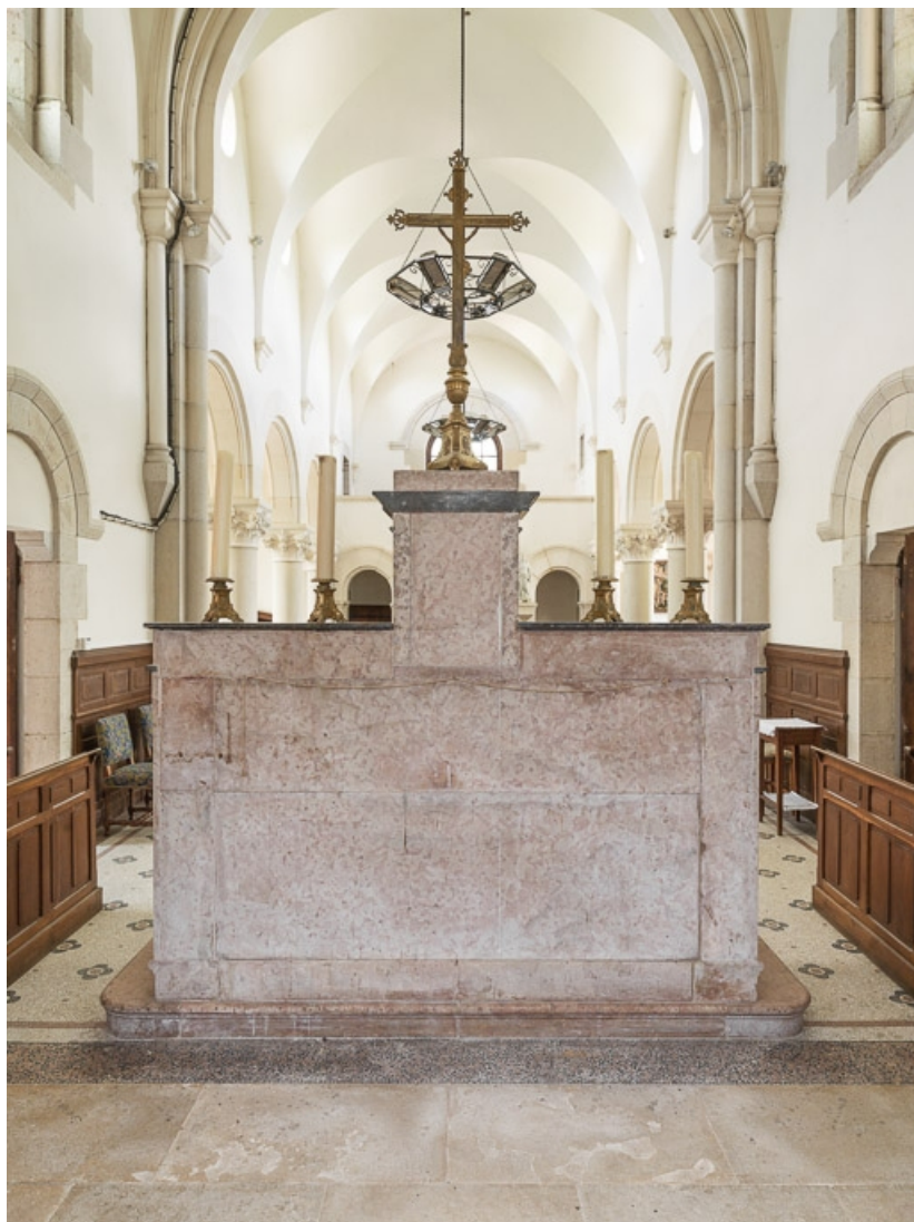
Autel, vue depuis le chœur.

21, Aloxe-Corton, Allée Jules-Senard-Louis-Latour