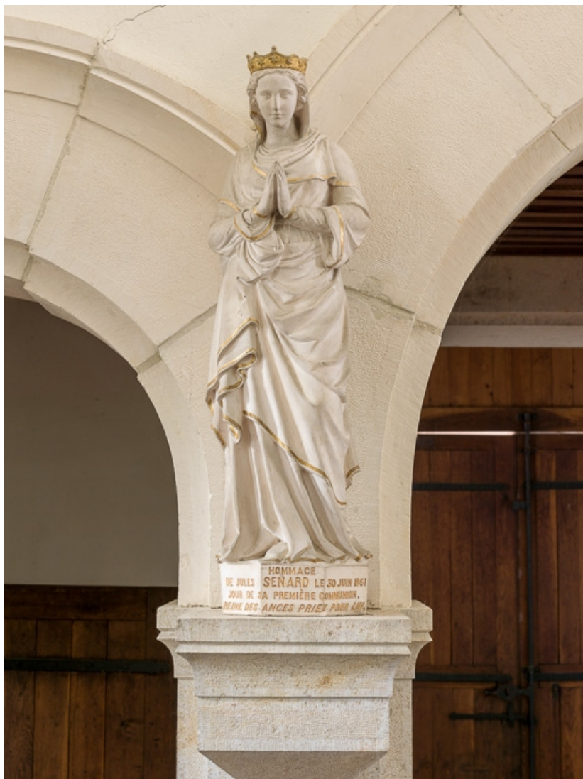
Statue portant l'inscription "REINE DES ANGES PRIEZ POUR LUI".

21, Aloxe-Corton, Allée Jules-Senard-Louis-Latour