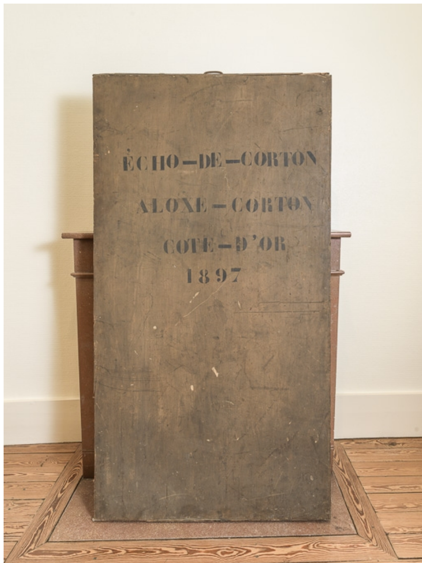
Bannière de la chorale d'Aloxe-Corton, conservée à la mairie.

21, Aloxe-Corton, Allée Jules-Senard-Louis-Latour