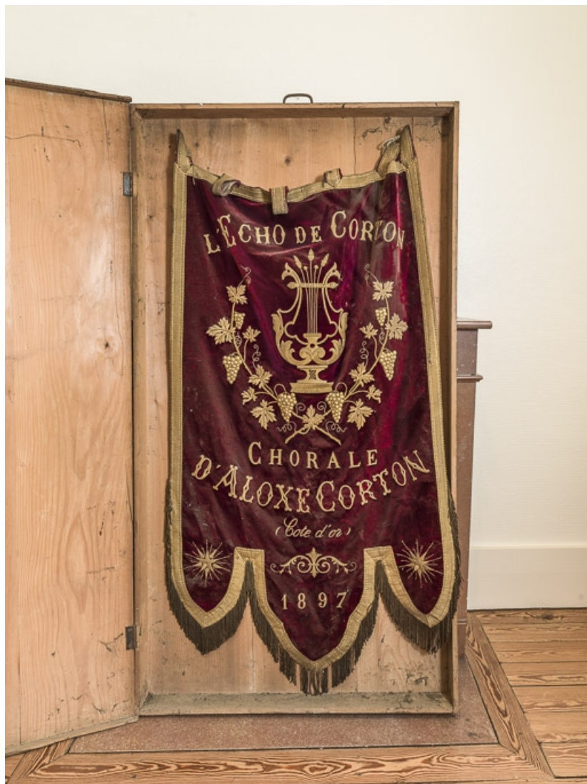
Bannière de la chorale d'Aloxe-Corton, conservée à la mairie.

21, Aloxe-Corton, Allée Jules-Senard-Louis-Latour