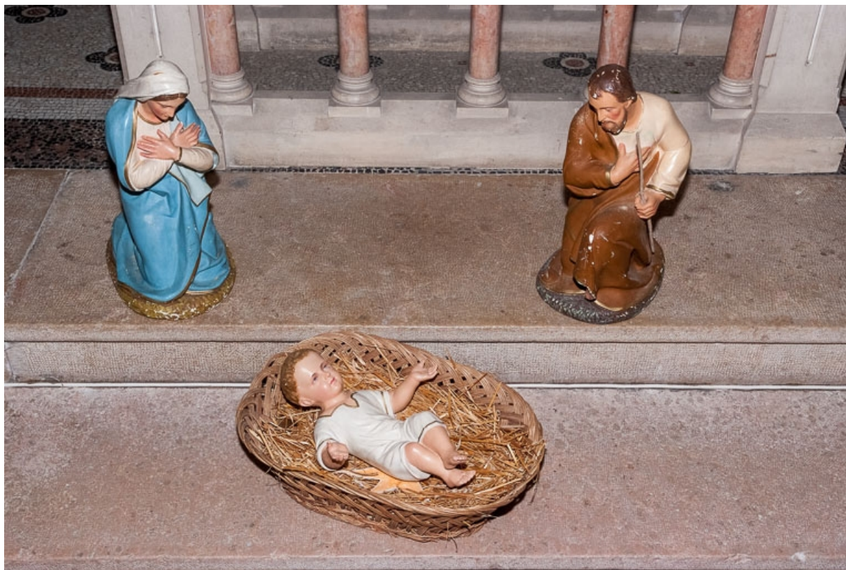
Personnages de crèche : Jésus, Marie et Joseph.

21, Aloxe-Corton, Allée Jules-Senard-Louis-Latour