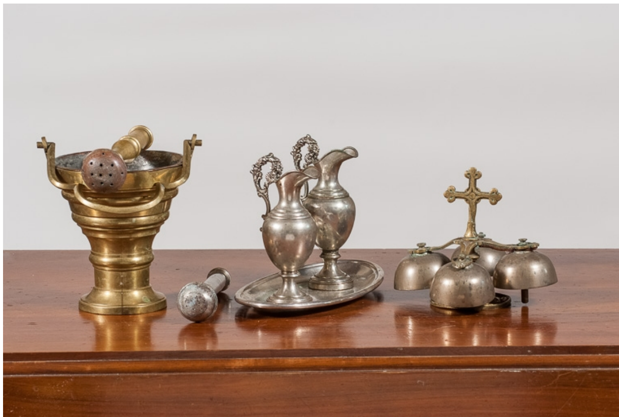
Seau à eau bénite, plateau et burettes et sonnette d'autel.

21, Aloxe-Corton, Allée Jules-Senard-Louis-Latour