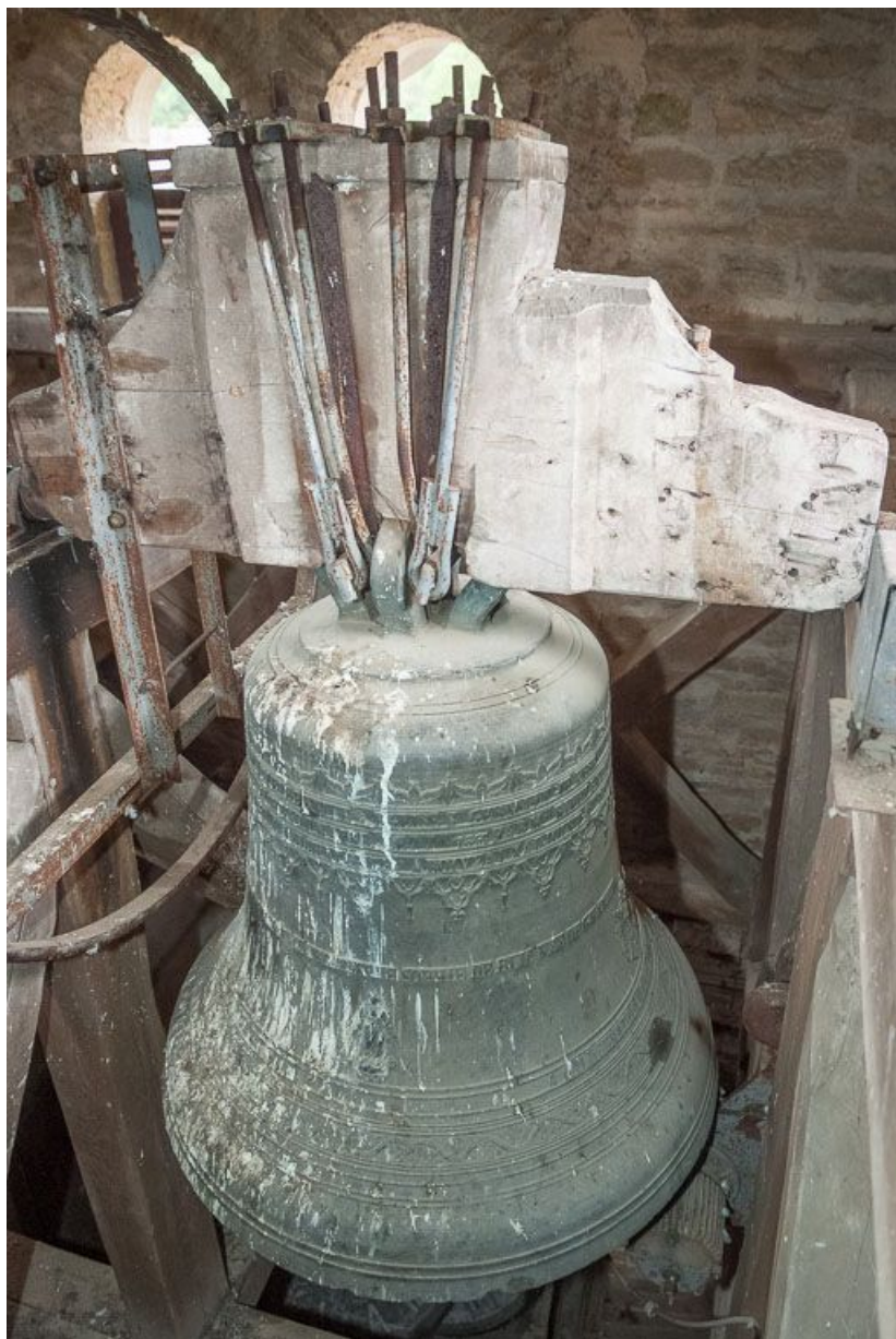
Vue d'ensemble de la deuxième cloche. 21, Pernand-Vergelesses