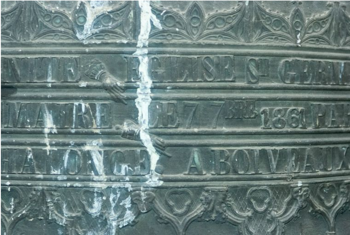
Détail de l'inscription sur la deuxième cloche.