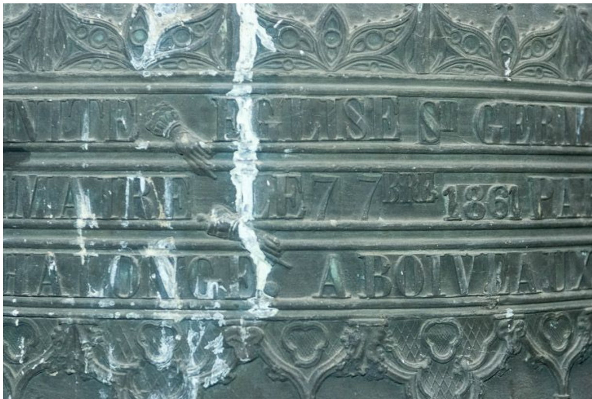
Détail de l'inscription sur la deuxième cloche. 21, Pernand-Vergelesses