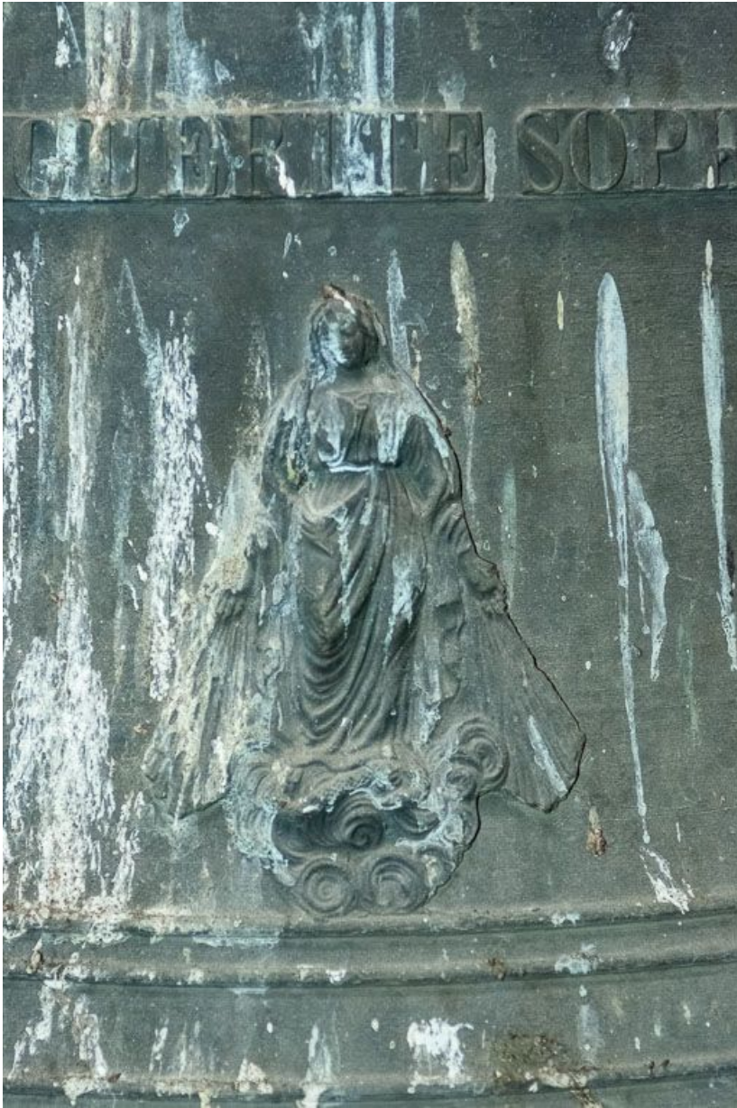
Détail sur la deuxième cloche.