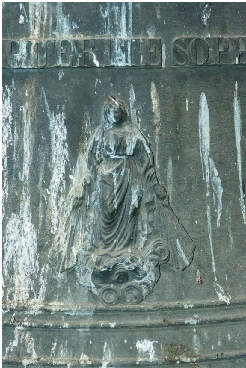
Détail sur la deuxième cloche.