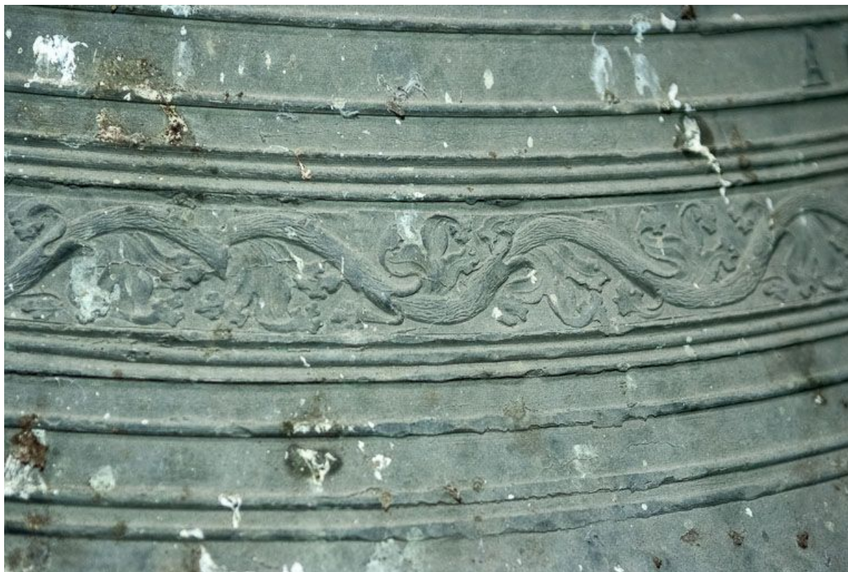
Détail de la frise.