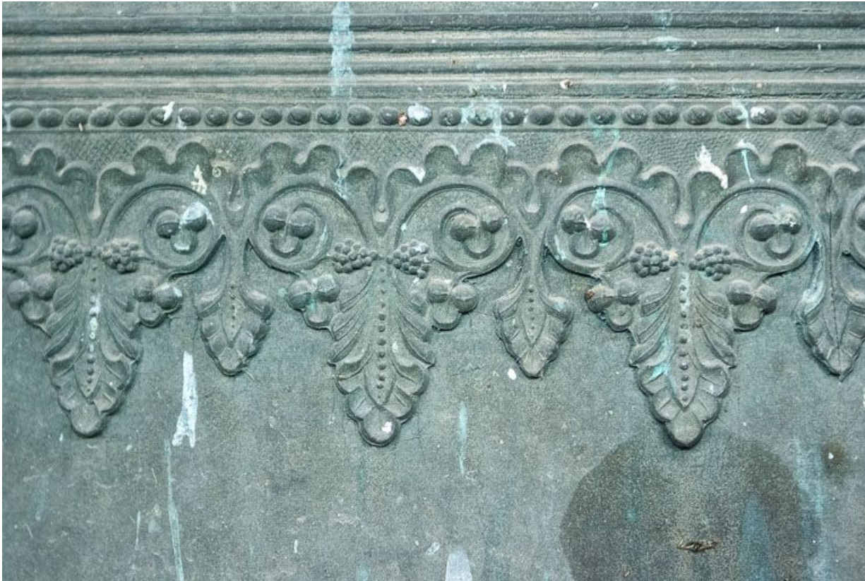
Détail de la frise.