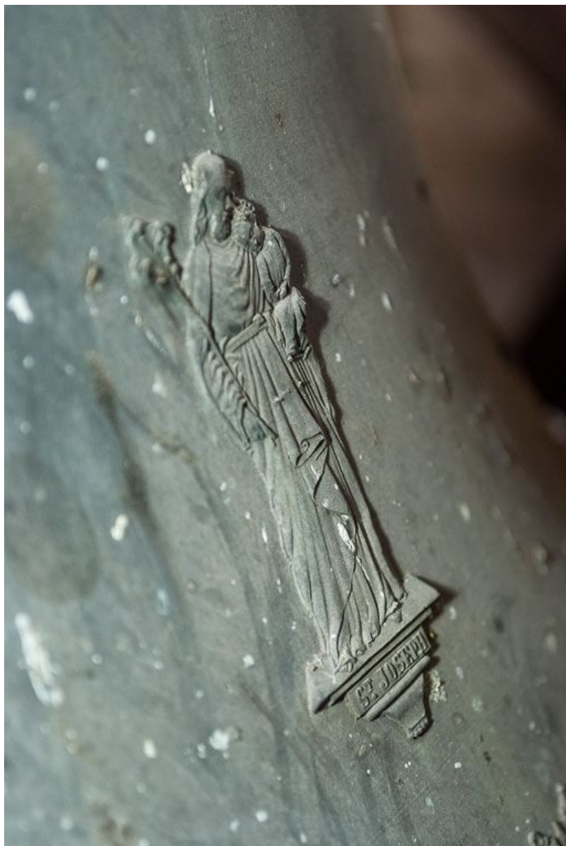
Détail du saint Joseph. 21, Pernand-Vergelesses