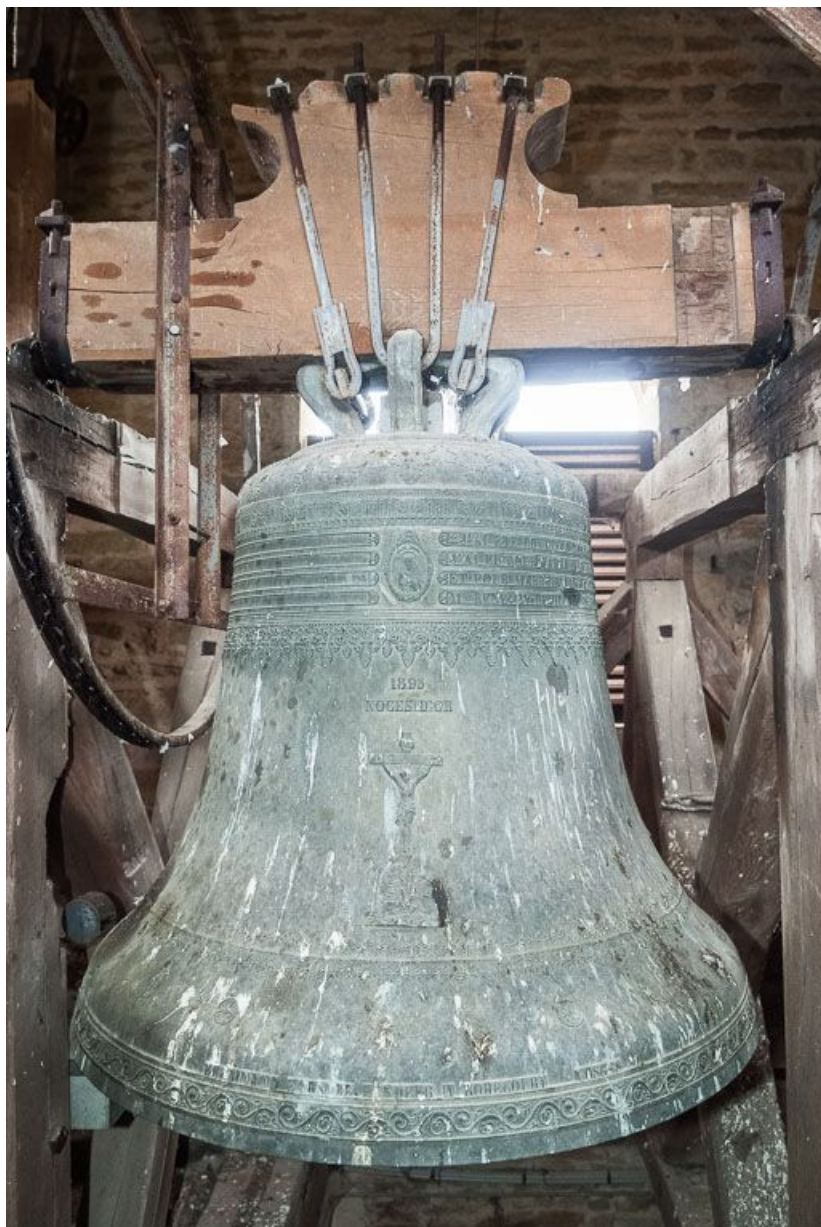
Vue d'ensemble de la 1ère cloche. 21, Pernand-Vergelesses