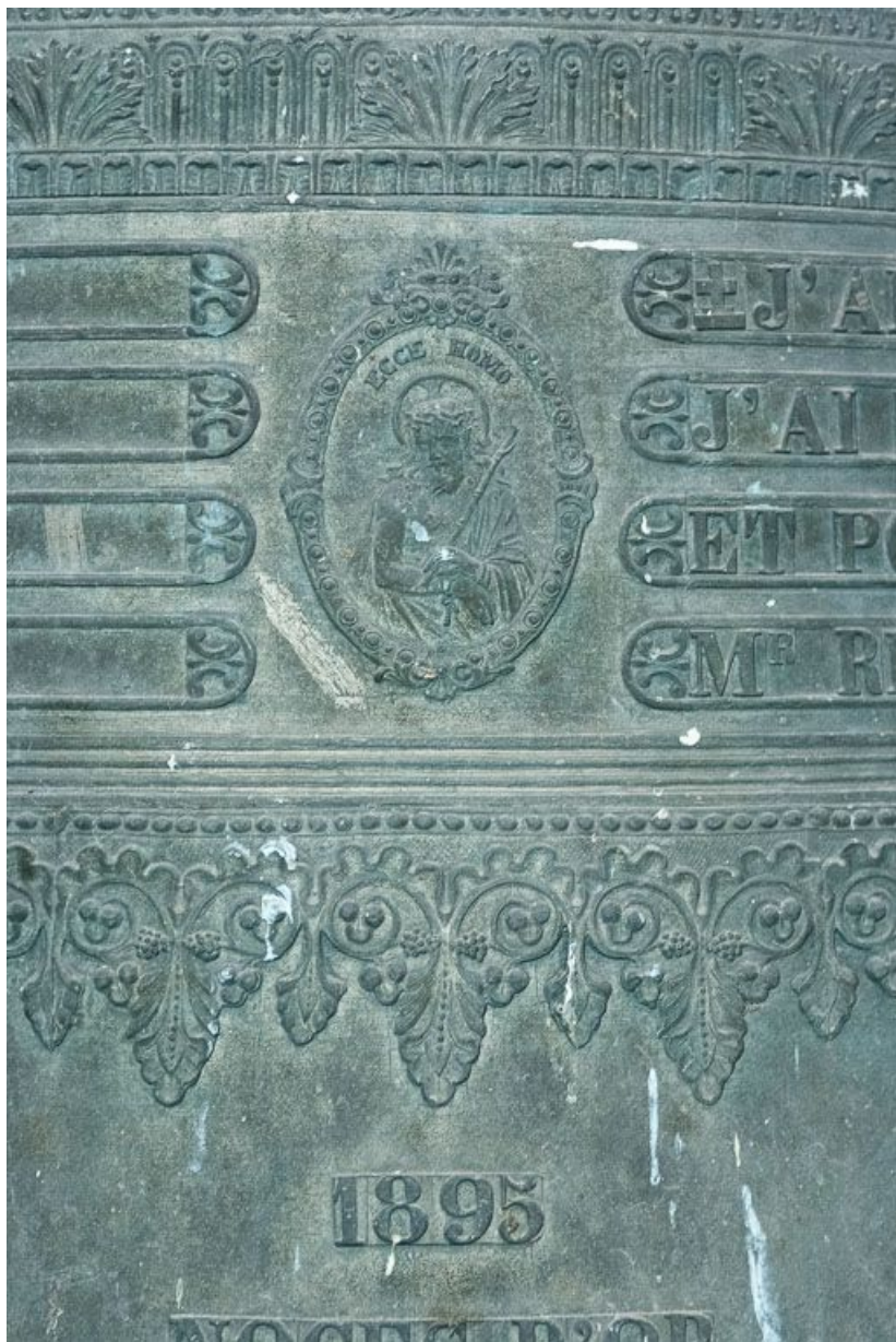
Détail de la date et de l'Ecce Homo.