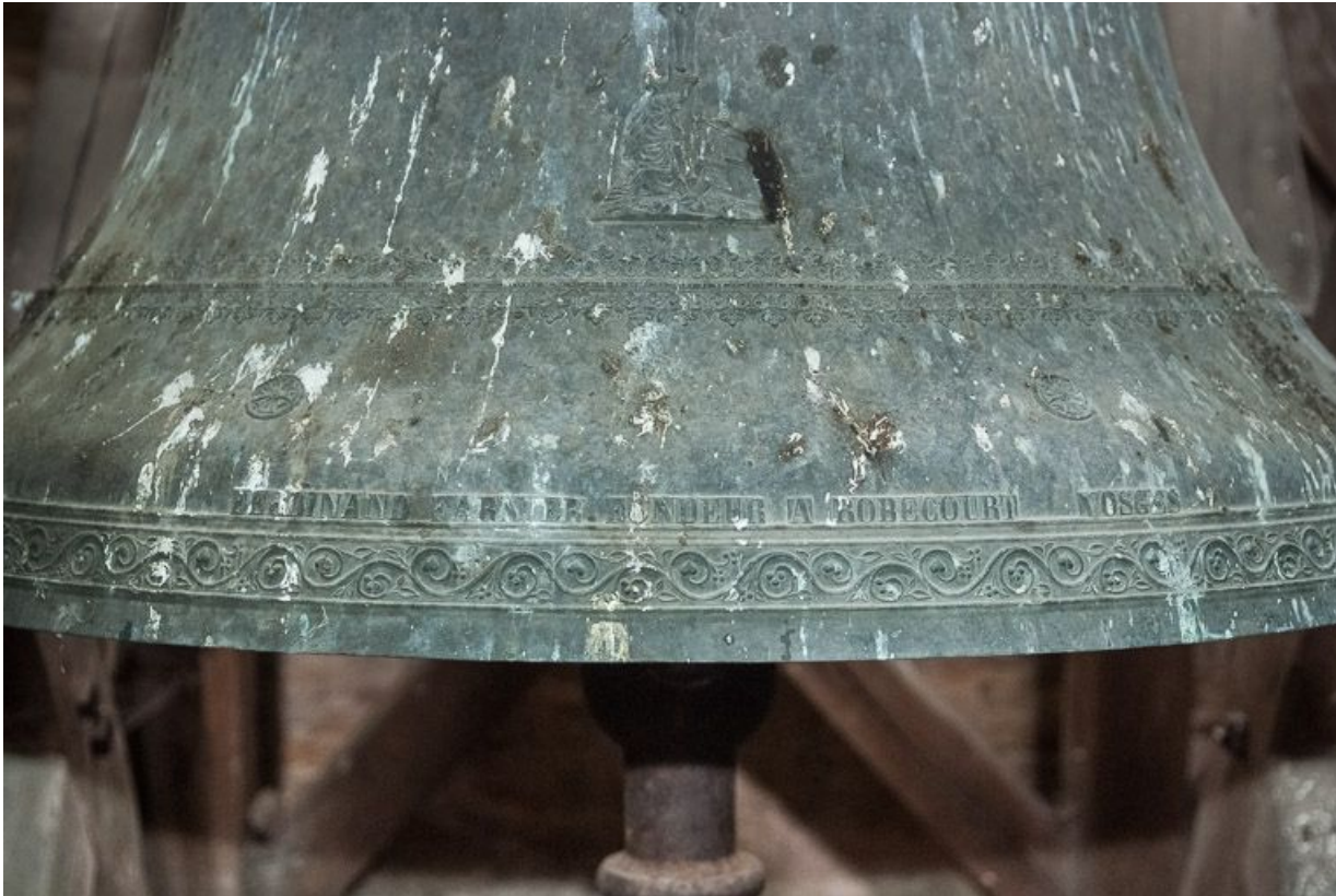
Détail de l'inscription du fondeur.