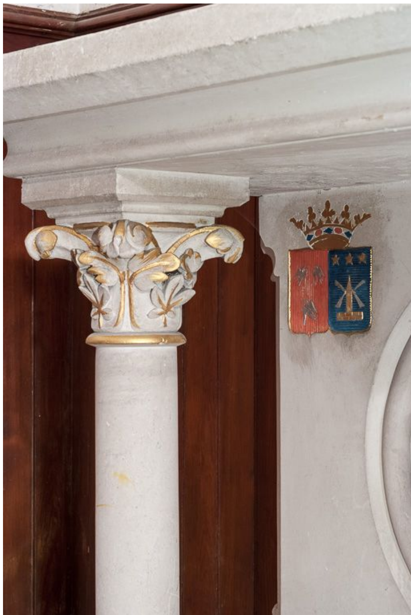
Détail des armoiries. 21, Pernand-Vergelesses