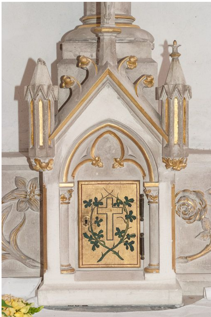
Tabernacle. 21, Pernand-Vergelesses