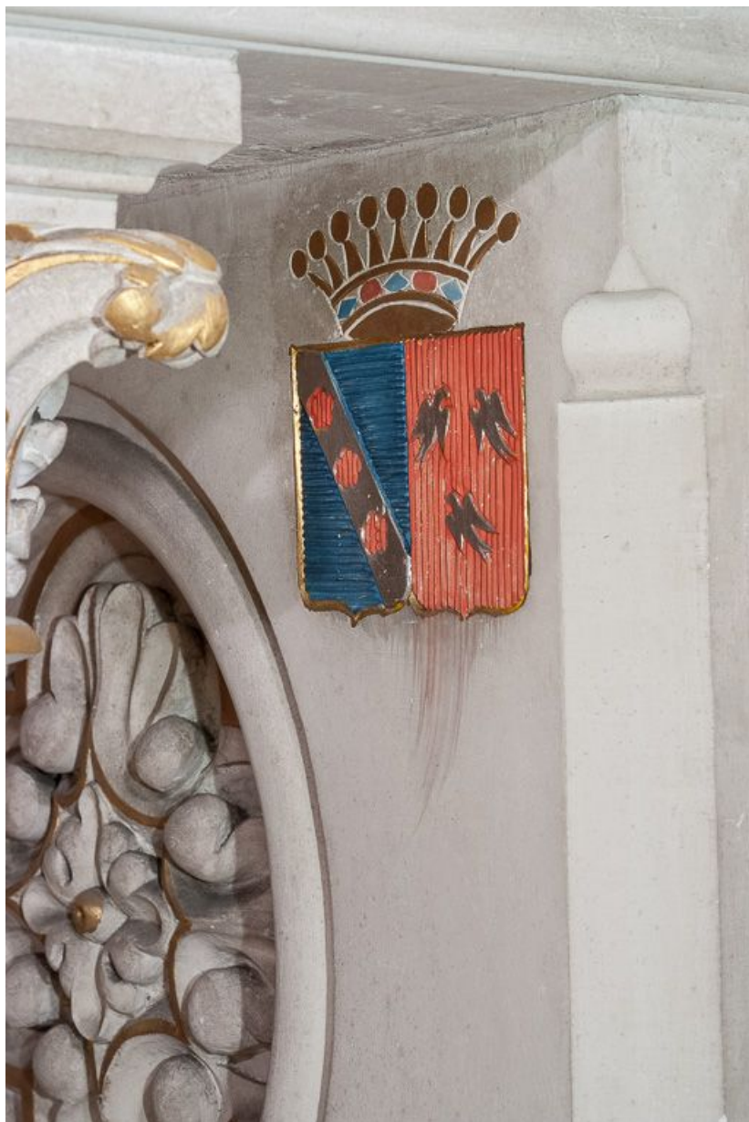
Détail des armoiries. 21, Pernand-Vergelesses