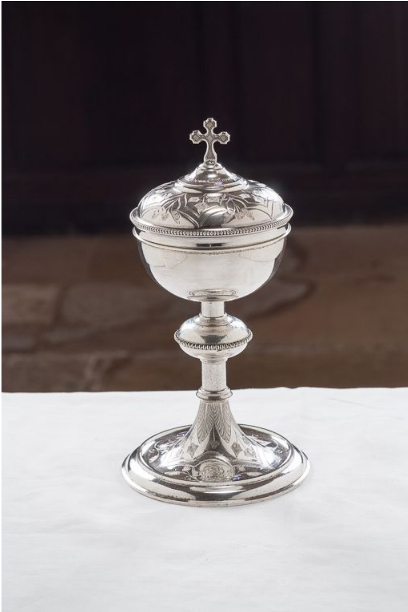
Vue d'ensemble du ciboire.