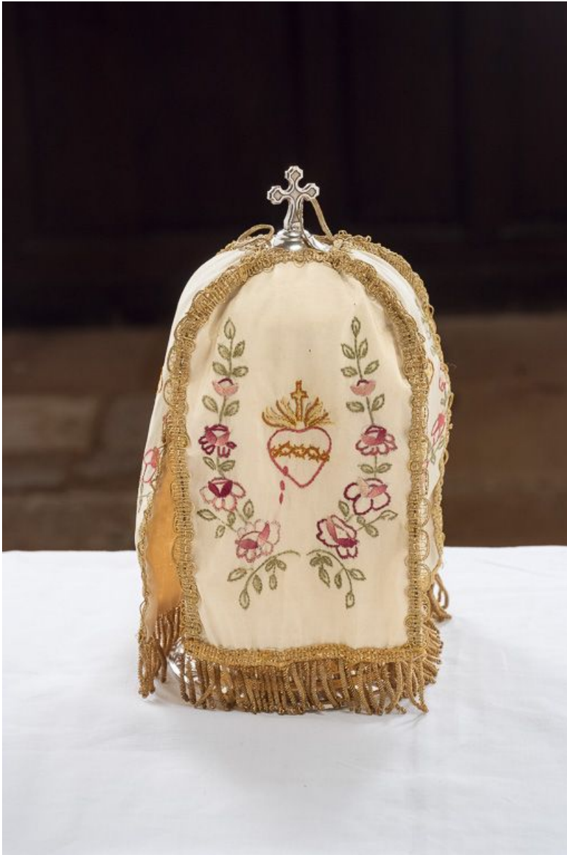
Le pavillon de ciboire. 21, Pernand-Vergelesses