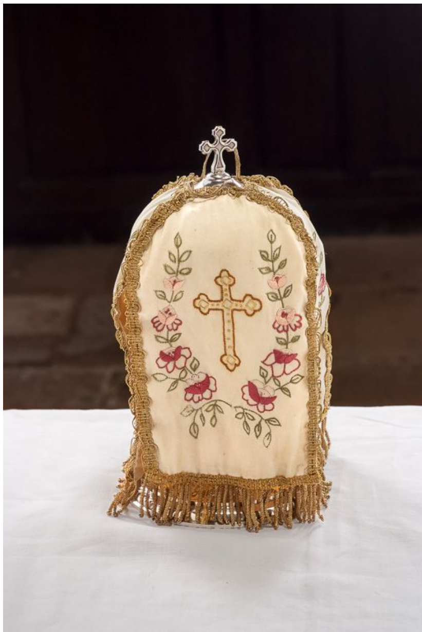
Vue d'ensemble du pavillon.