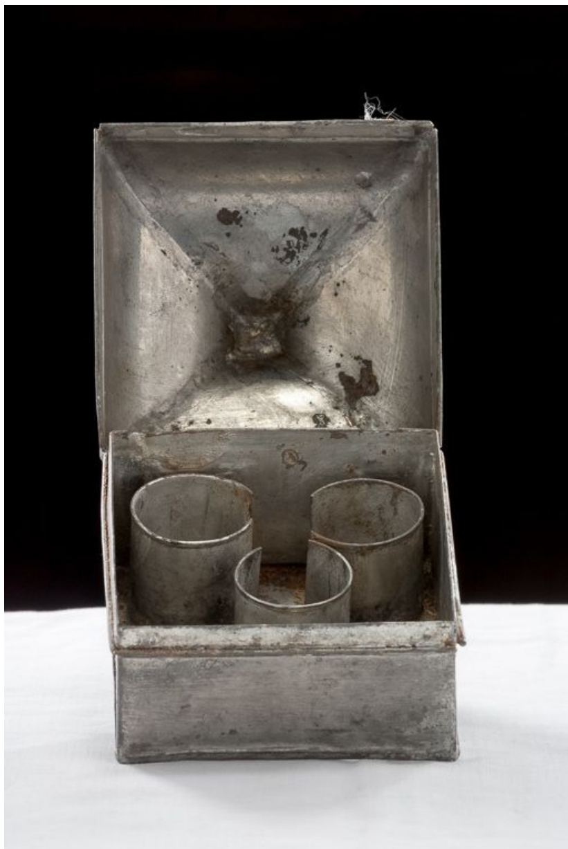
Vue d'ensemble du coffret ouvert.