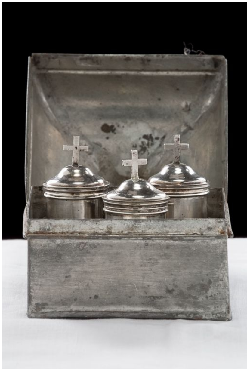
Vue d'ensemble : ouvert. 21, Pernand-Vergelesses