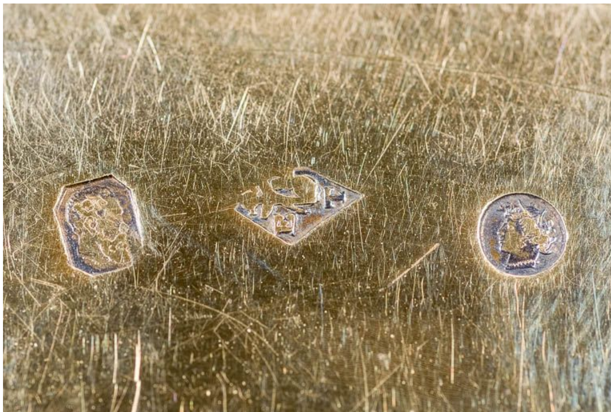
Détail des poinçons de la patène.