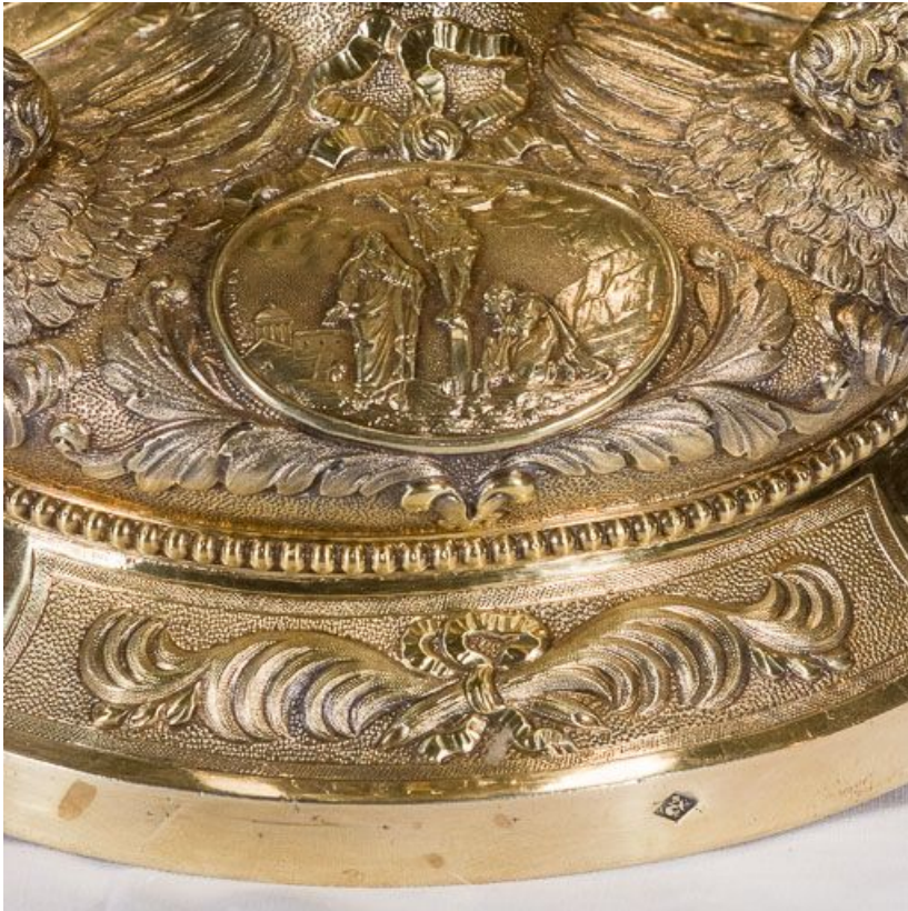
Détail du décor du pied du calice.