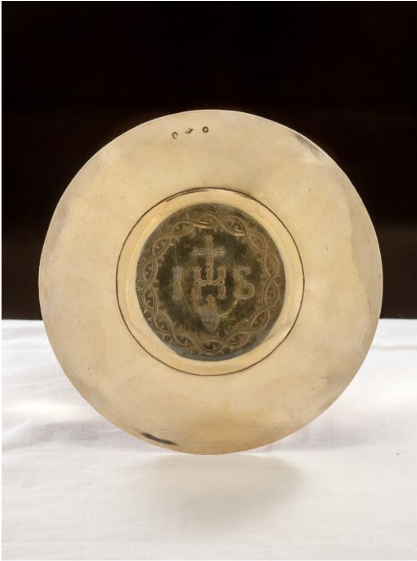
Patène: vue d'ensemble.