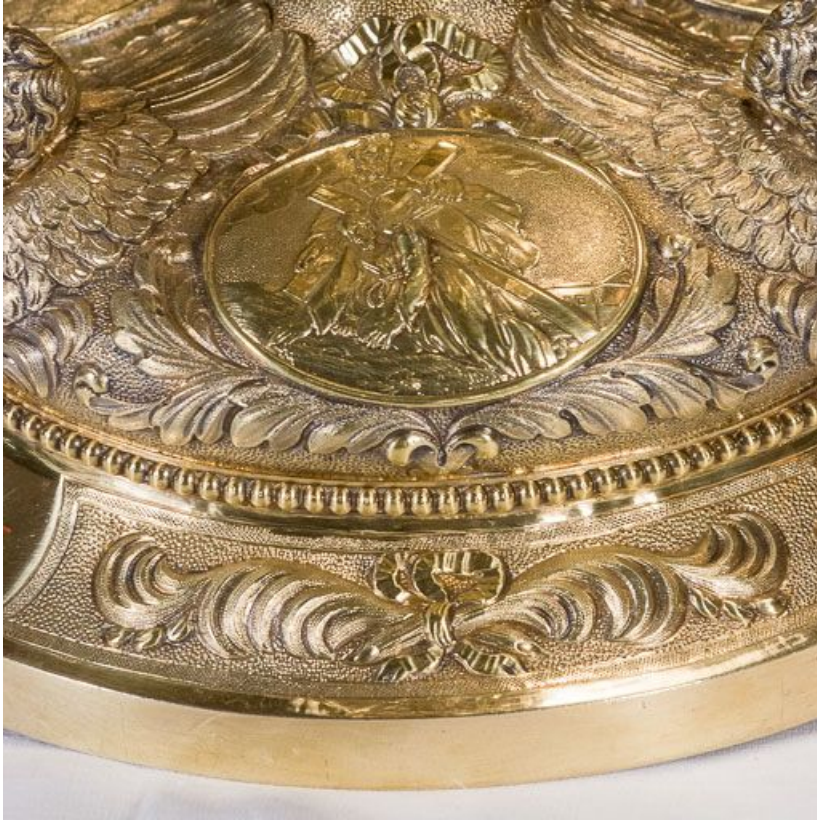
Détail du décor du pied du calice.