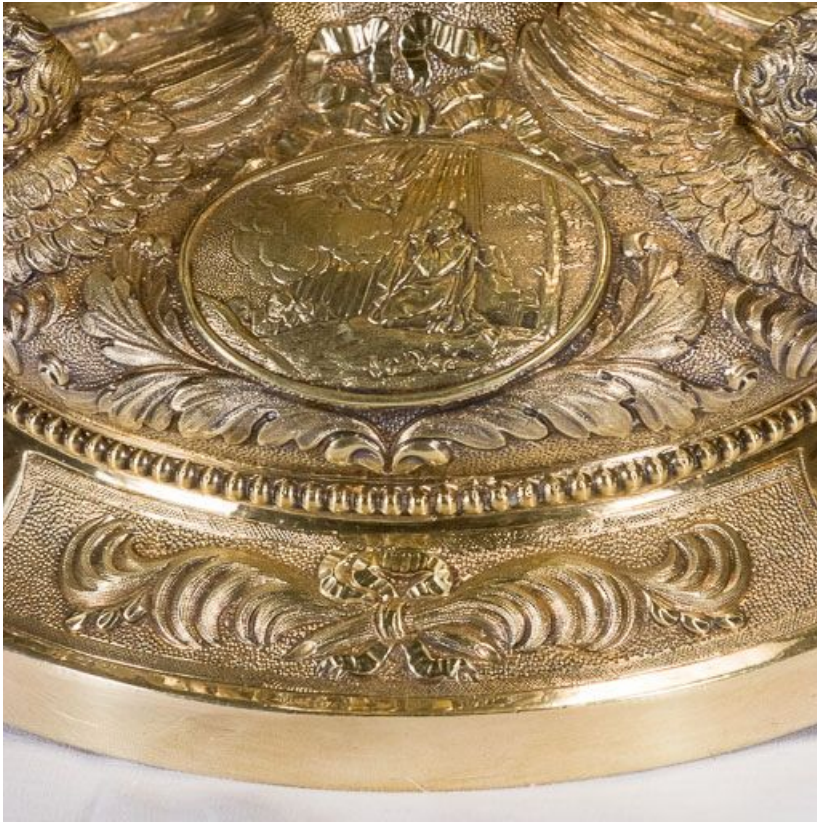
Détail du décor du pied du calice.