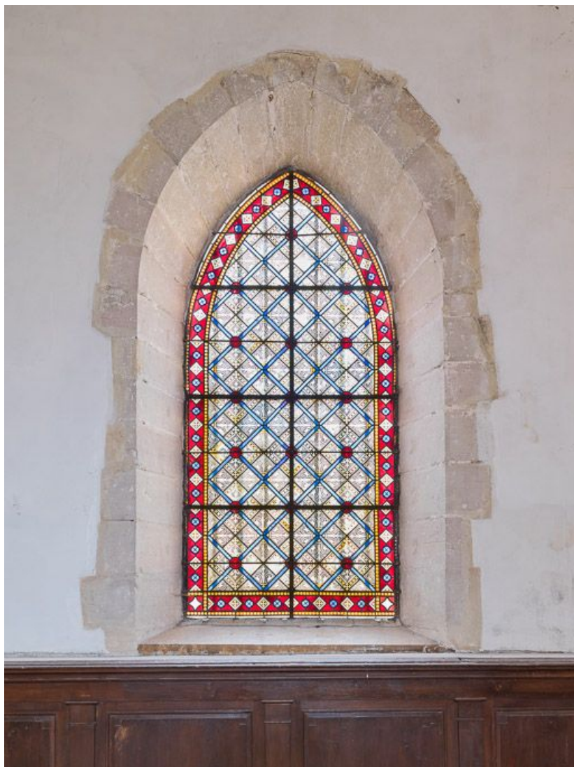
Vue d'ensemble, verrière du chœur.