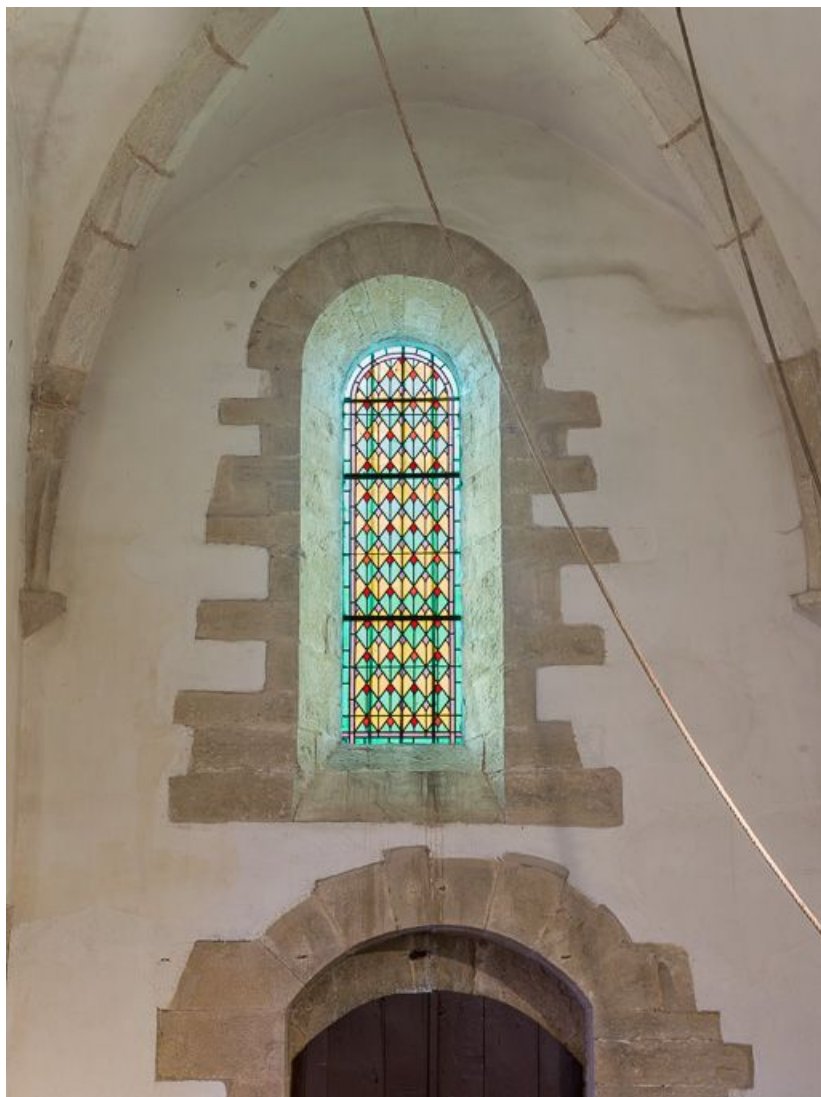
Vue d'ensemble, verrière de la nef. 21, Pernand-Vergelesses