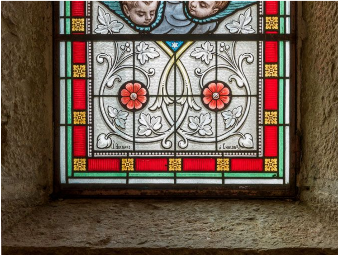
Vitrail, détail : signature.