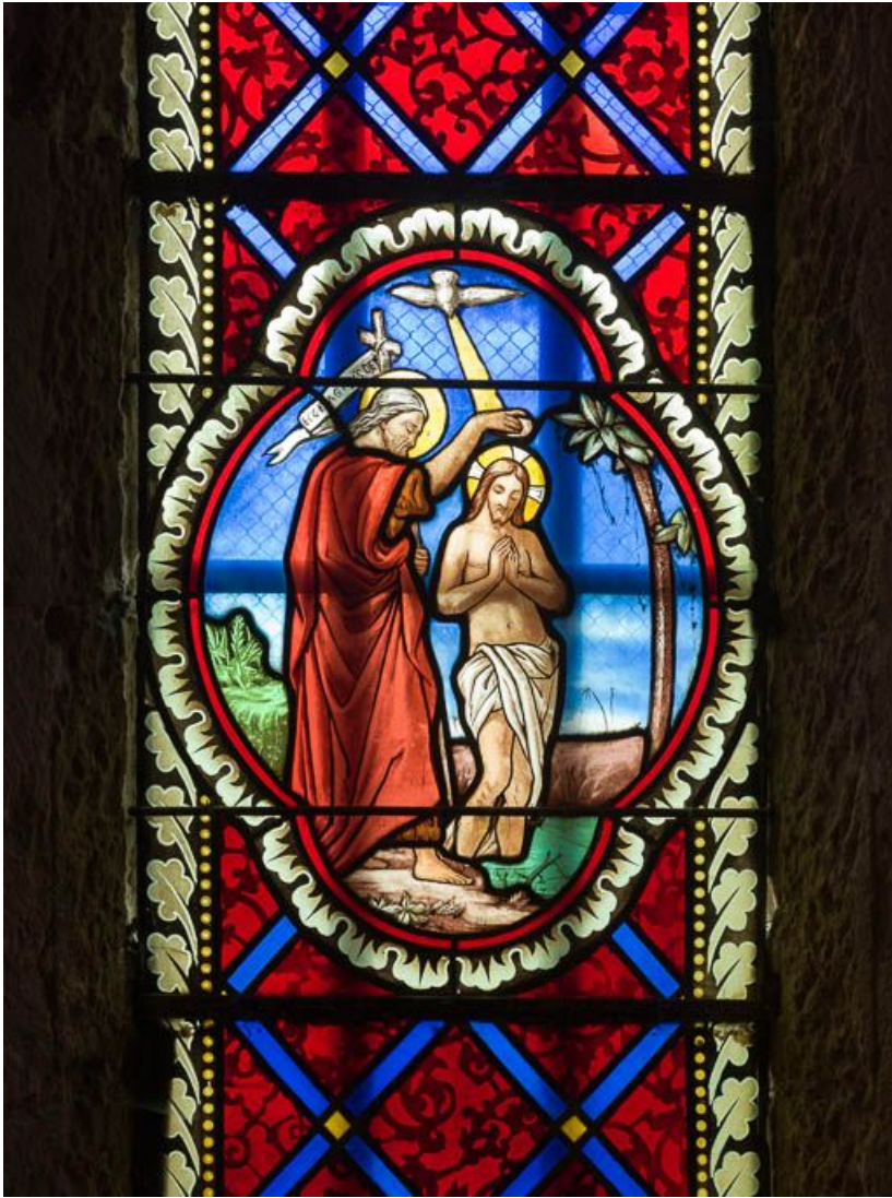
Détail de la scène principale.