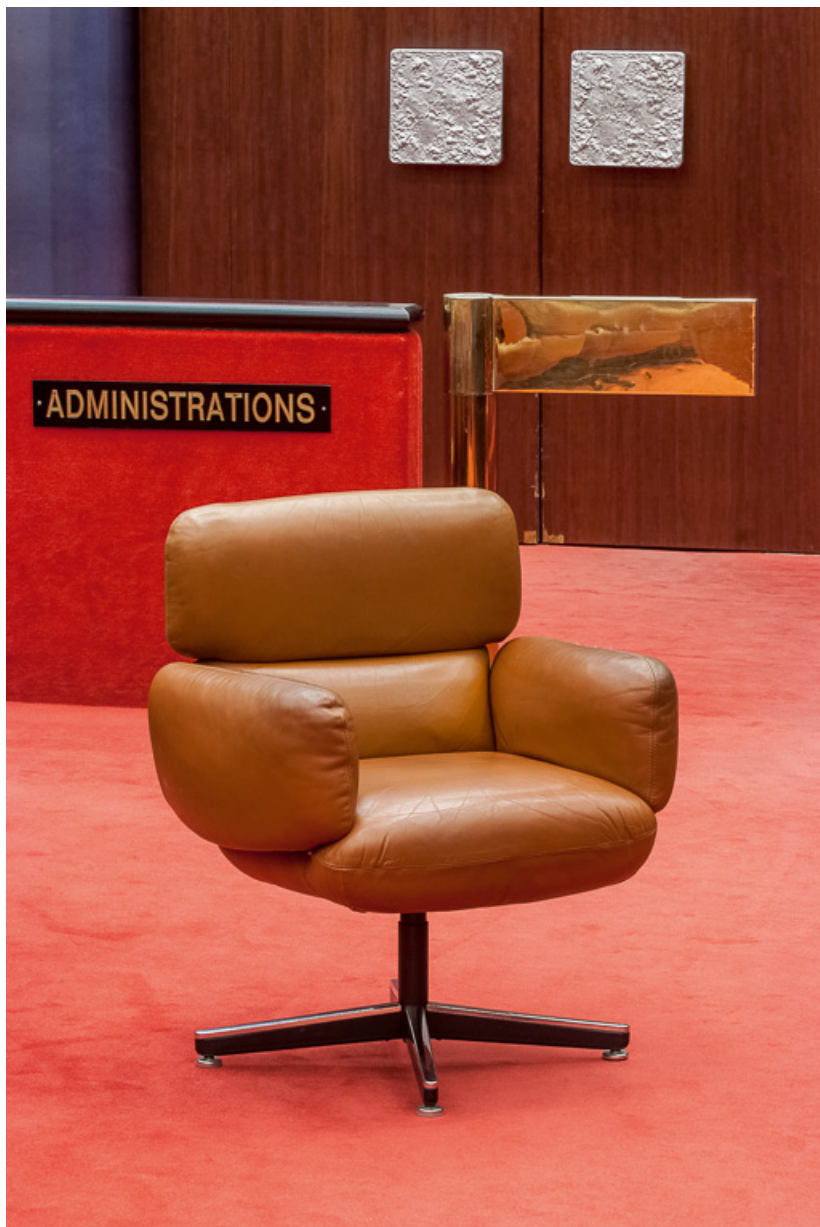
Fauteuil de la salle des Assemblées.