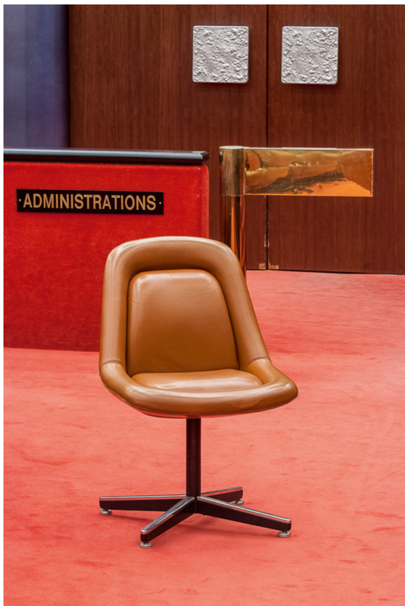
Chaise de la salle des Assemblées.