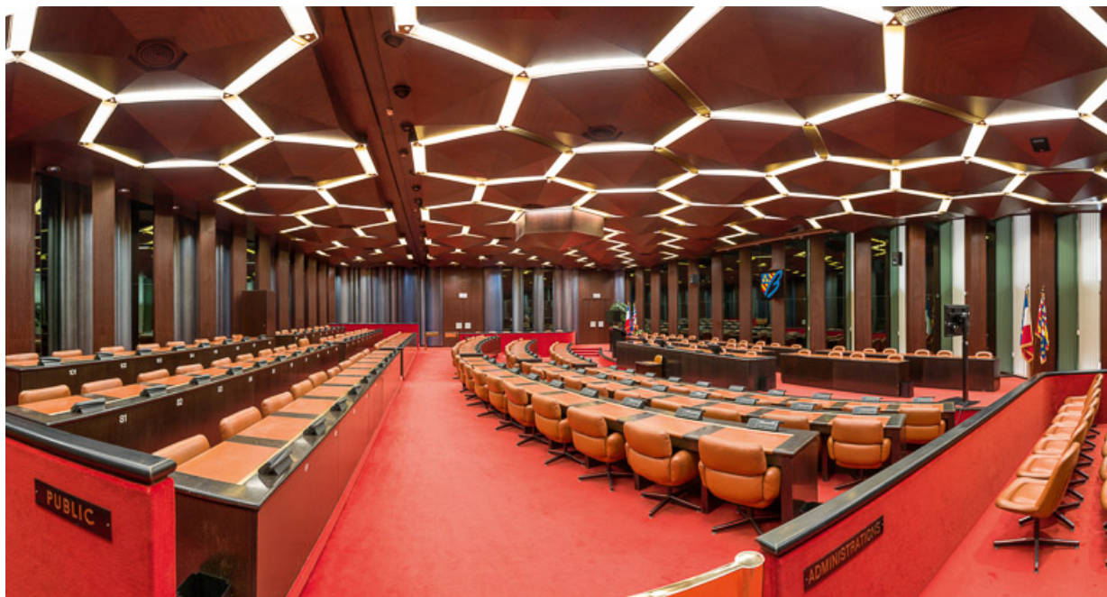
Vue panoramique de la salle des Assemblées. 21, Dijon

N° de l'illustration : 20142102159NUC4AQ