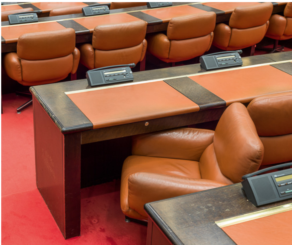
Fauteuils et bureaux des élus de la salle des Assemblées. 21, Dijon