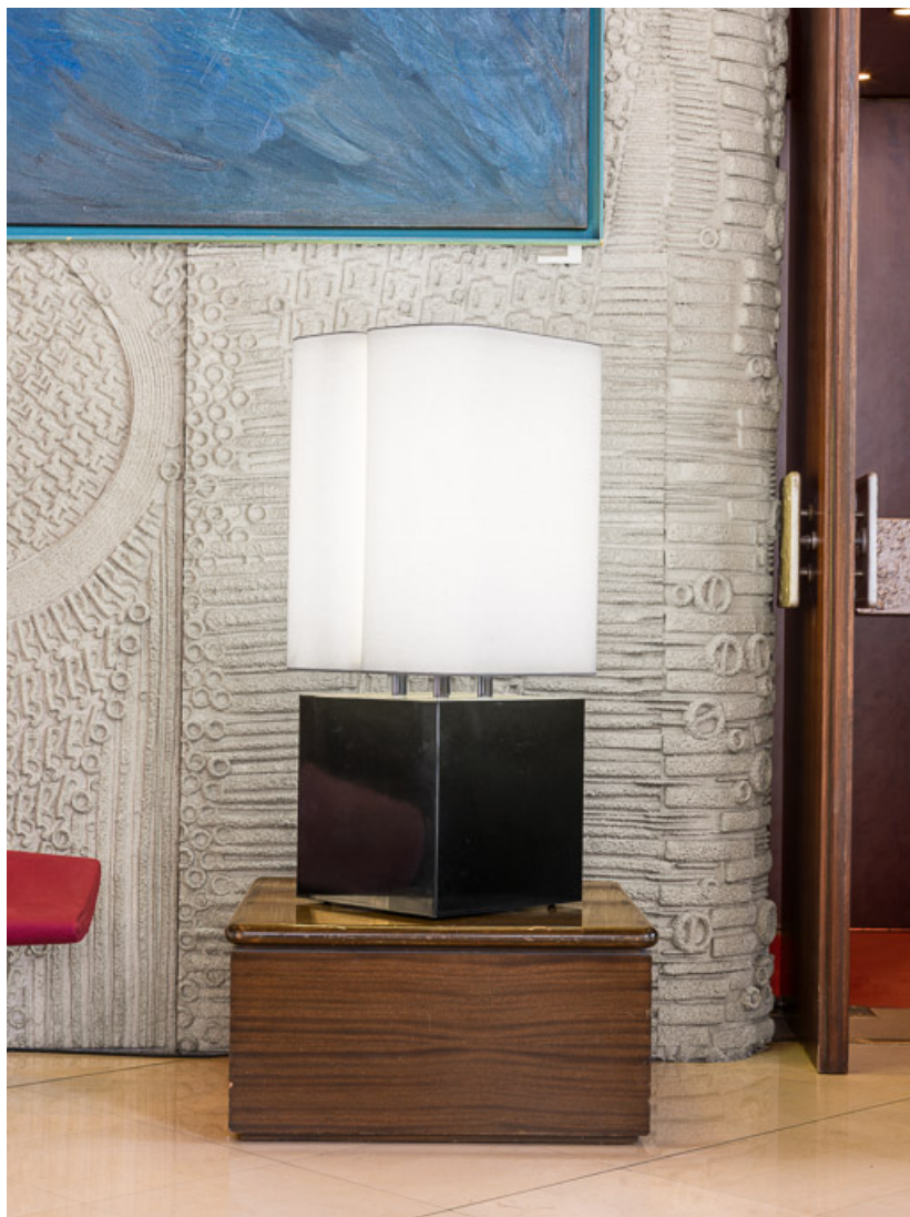
Lampe Brasília : modèle situé dans le hall. 21, Dijon