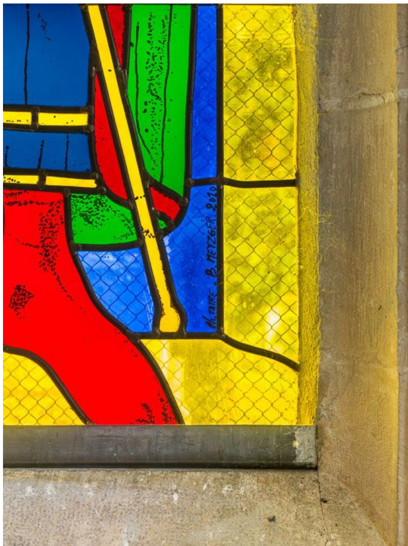
Verrière représentant saint Jacques : détail de la signature et de la date.