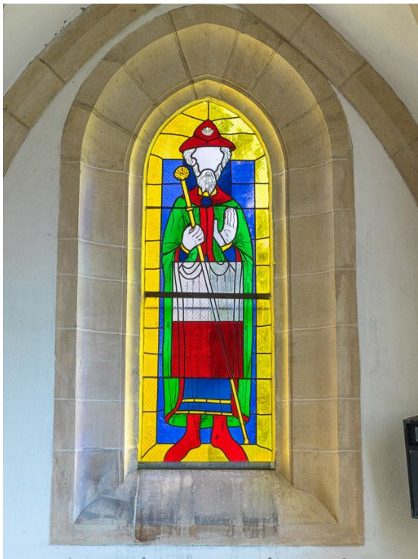
Vue d'ensemble de la verrière représentant saint Jacques.