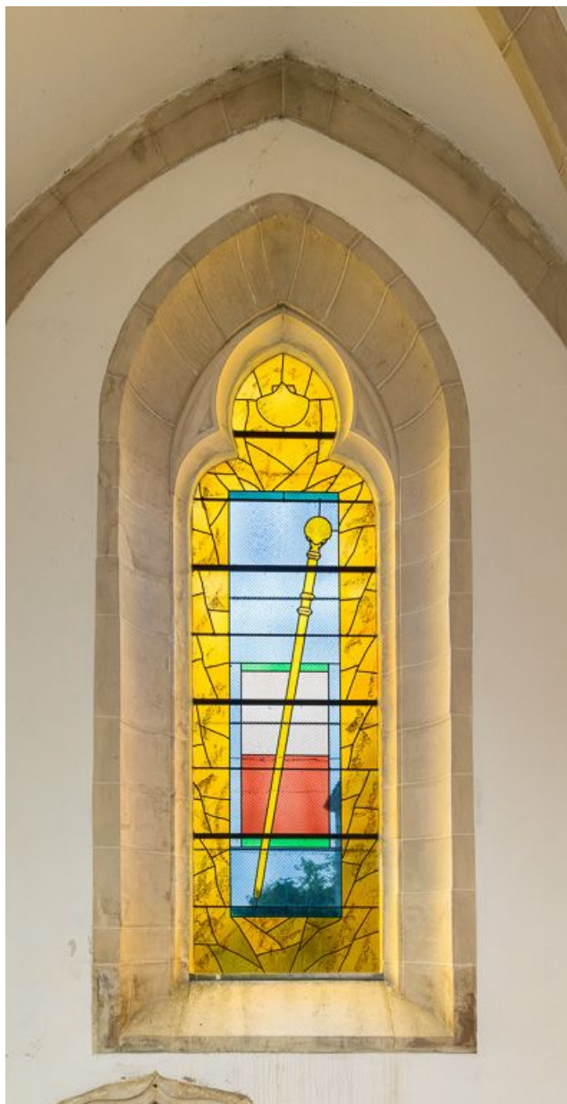
Vue d'ensemble de la verrière représentant un bâton de pèlerin.