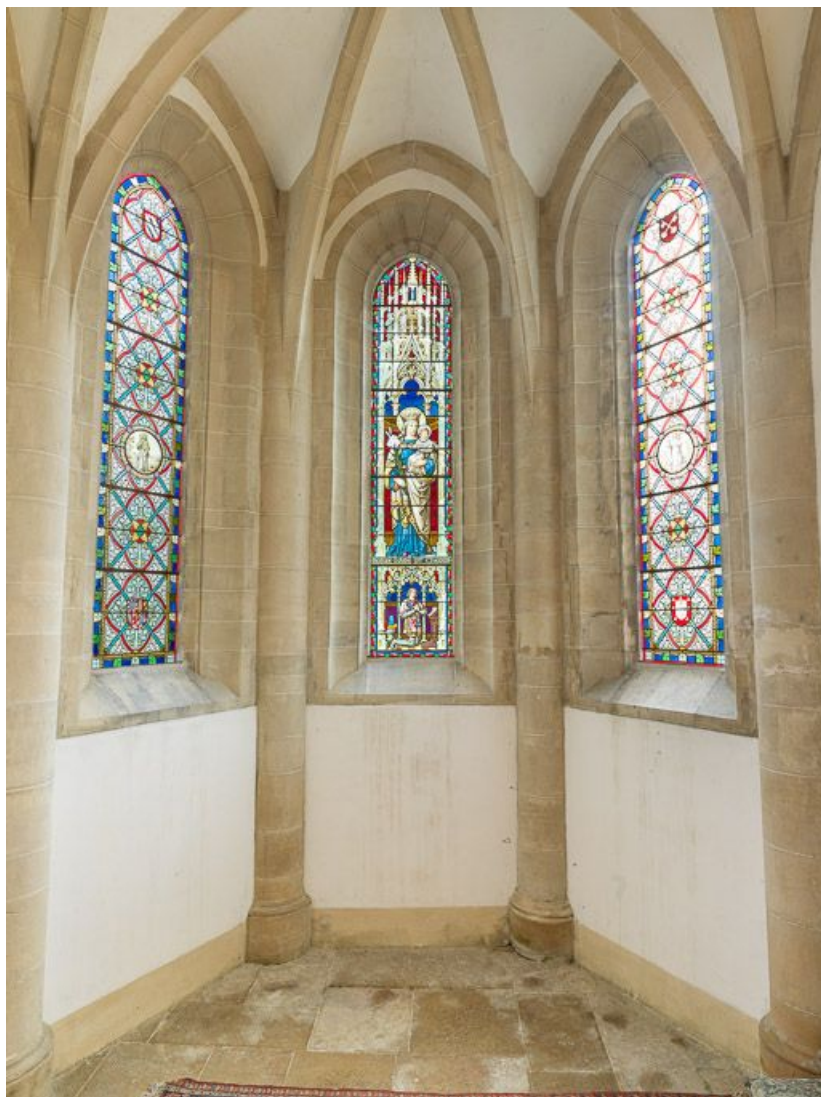
Vue d'ensemble des trois verrières du choeur.