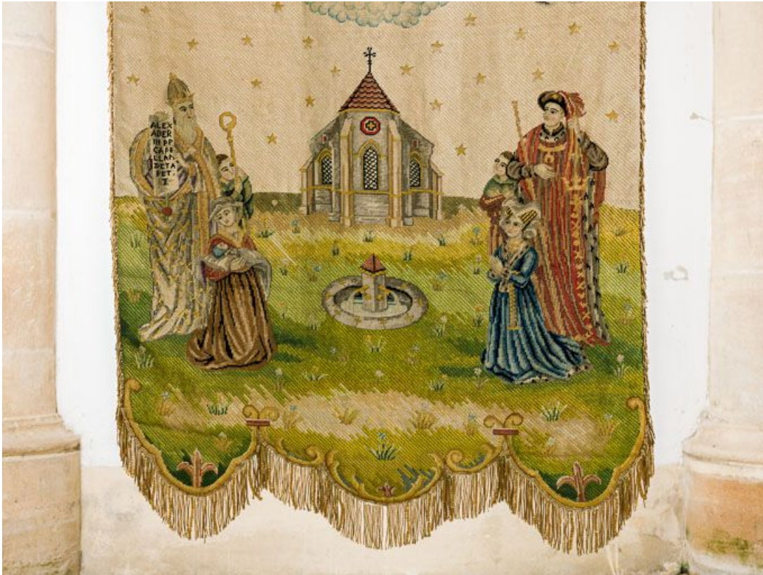
Détail : partie inférieure.