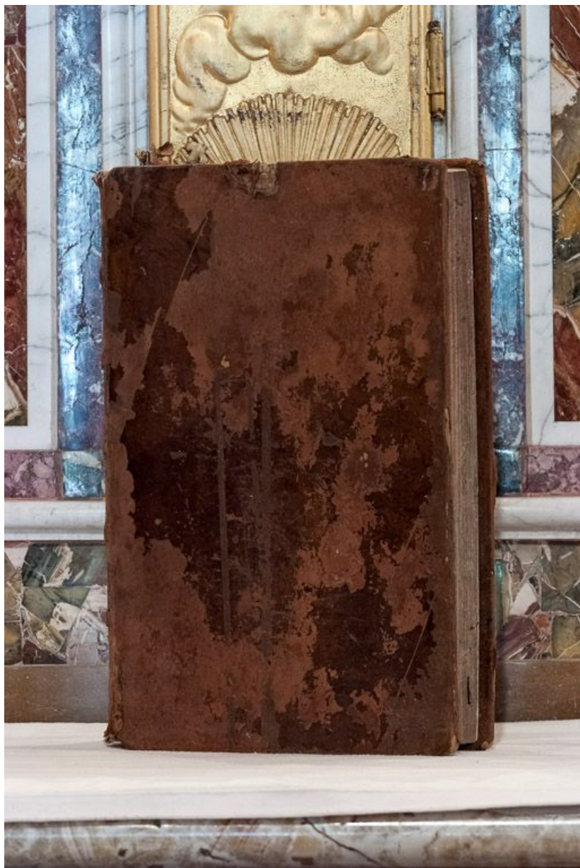
Missel : reliure