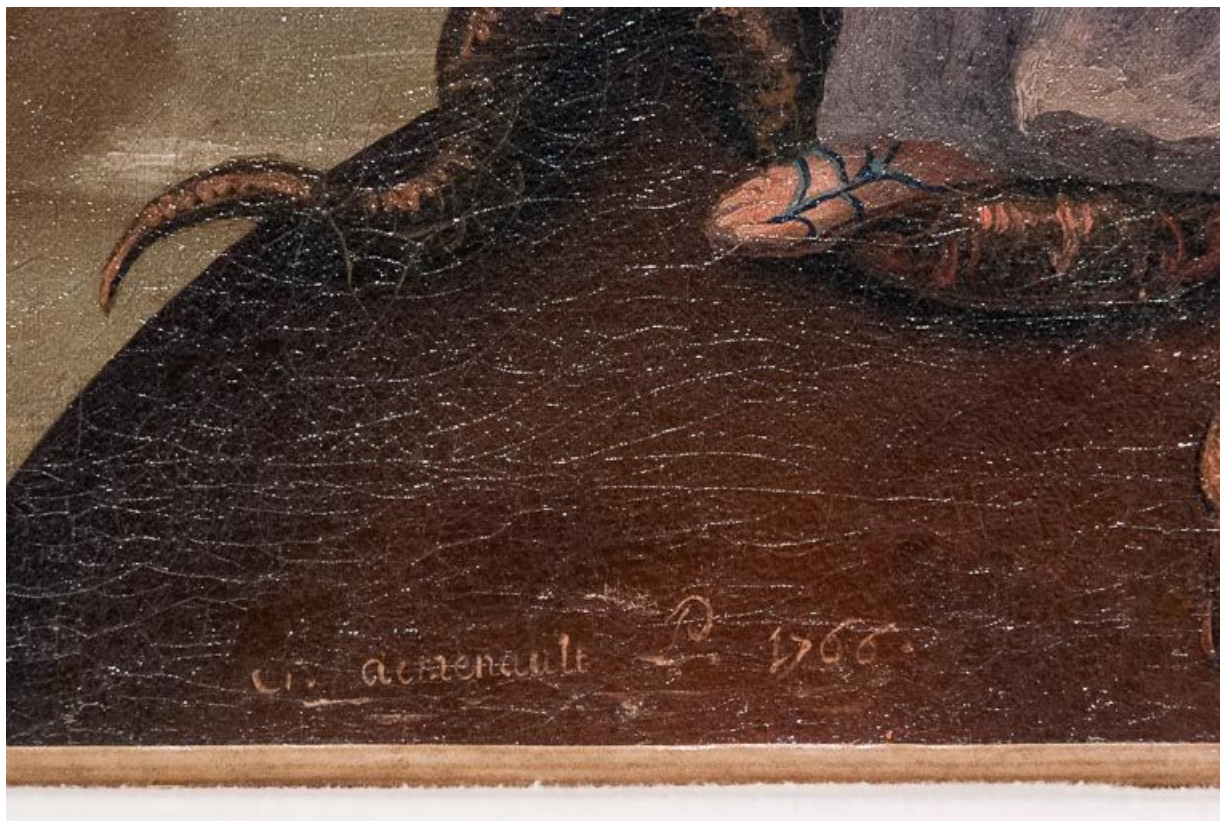
Détail du tableau de la Vierge de l'Apocalypse : signature et date.