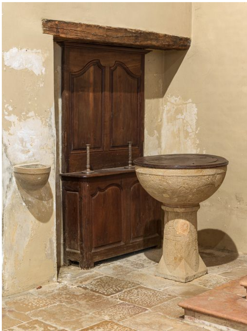
Vue d'ensemble des fonts baptismaux, avec couvercle.