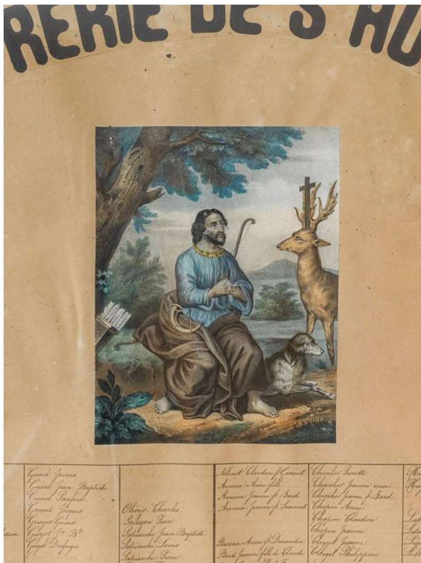
Cadre de la confrérie de saint Hubert : détail de la gravure.