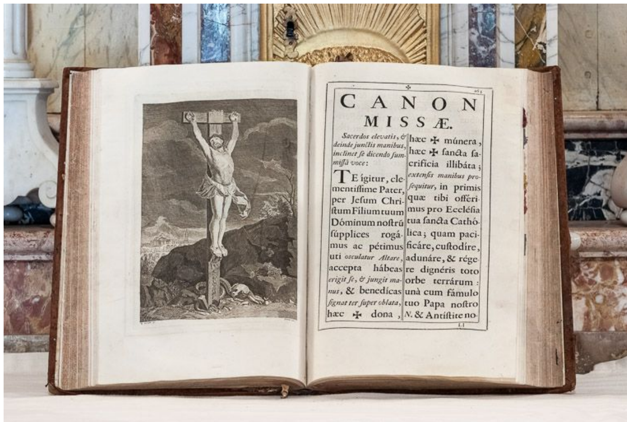
Missel : gravure du Christ en croix.