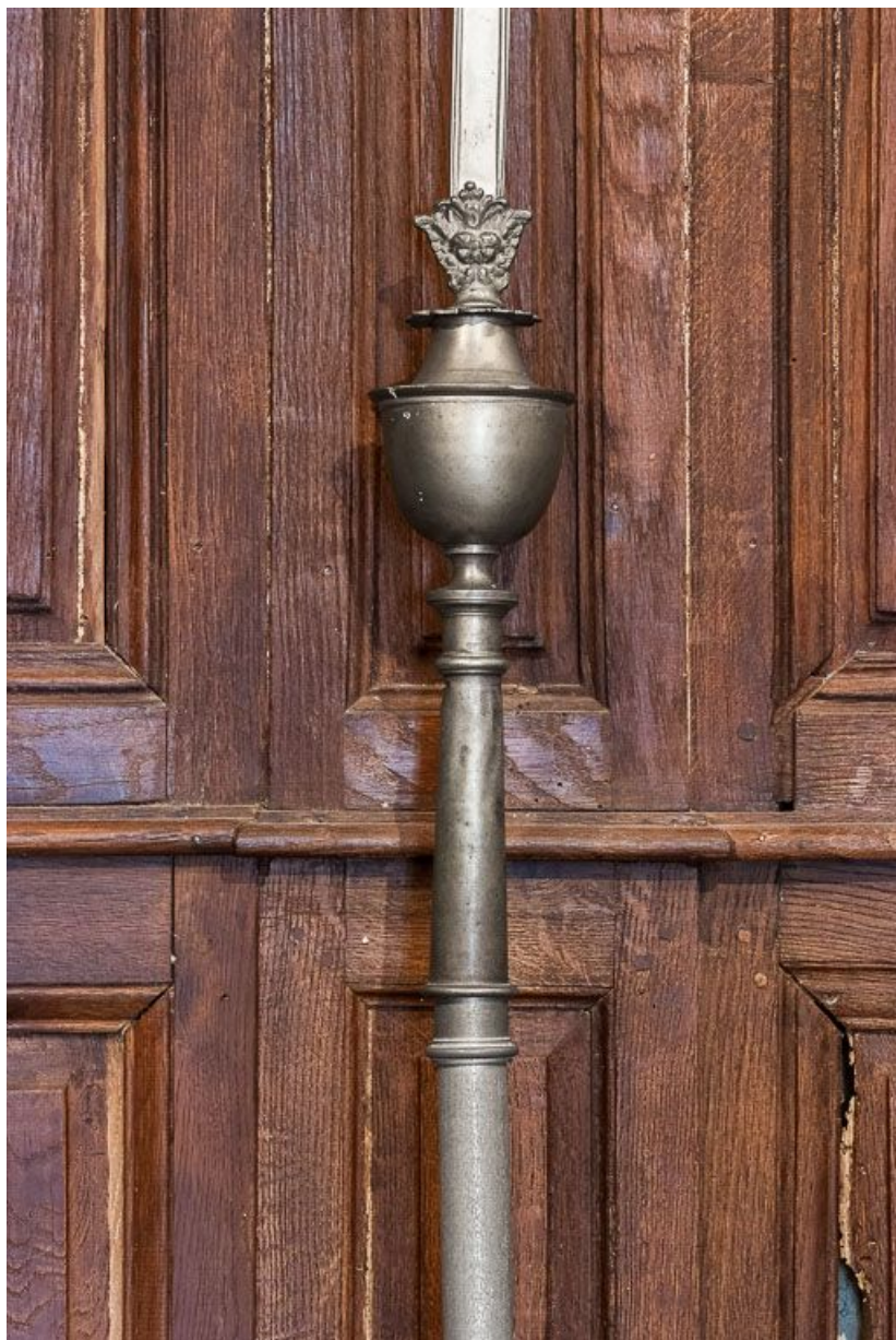
Croix de procession : détail.