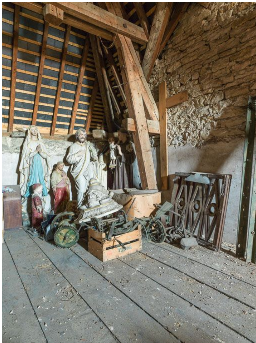
Dépôt d'objets dans les combles de la mairie.