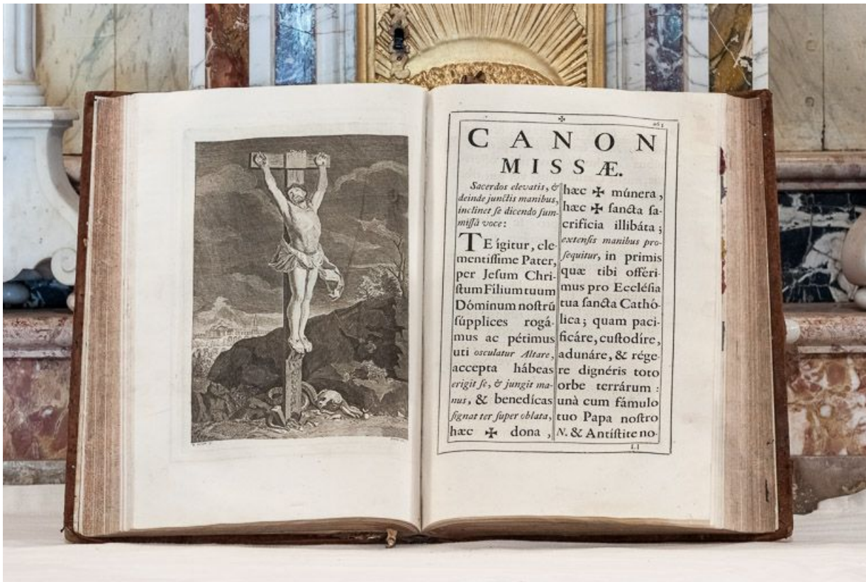
Missel : gravure du Christ en croix.