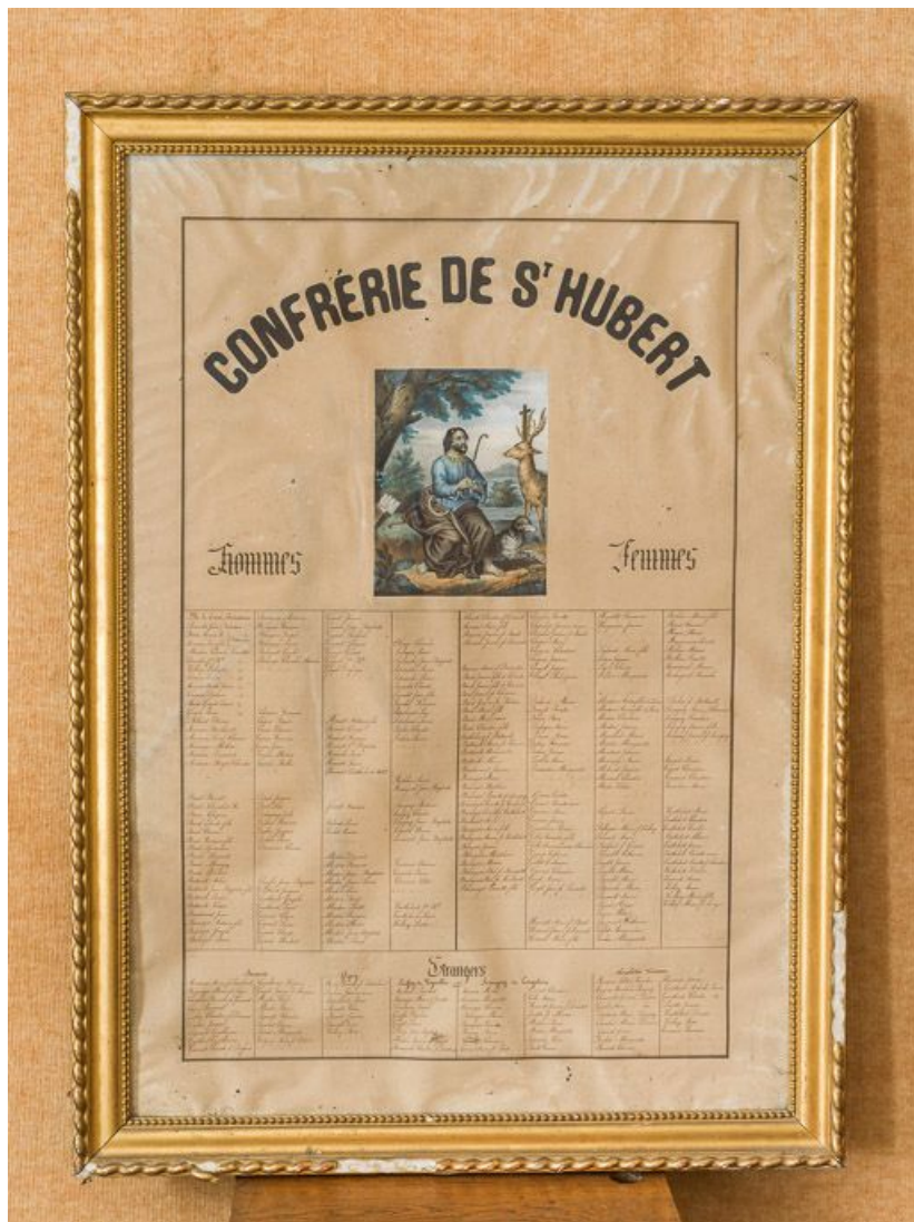
Vue d'ensemble du cadre de la confrérie de saint Hubert. 21, Chores-les-Beaune