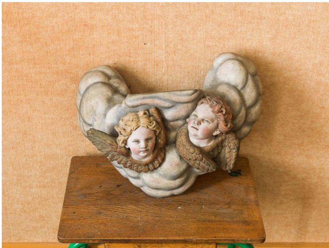
Vue d'ensemble d'un culot.