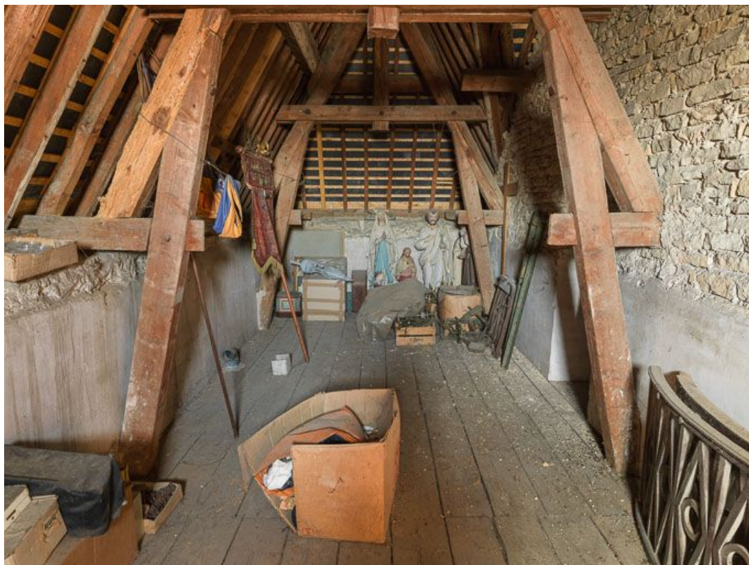
Dépôt d'objets dans les combles de la mairie. 21, Chorey-les-Beaune