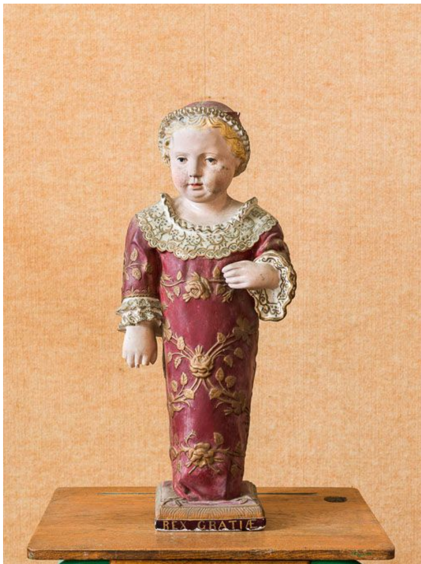
Vue d'ensemble de la statue du Petit Roi de Grâce. 21, Chorey-les-Beaune