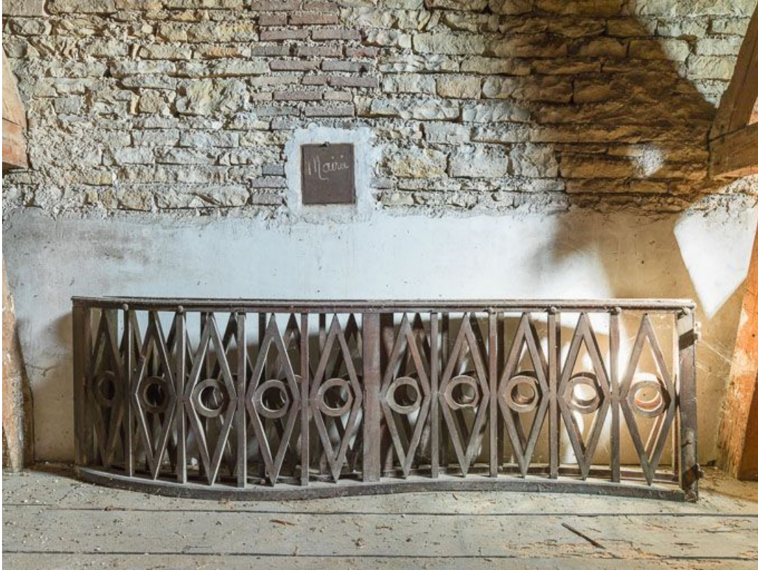
Clôture de chœur déposée : vue d'ensemble. 21, Chorey-les-Beaune