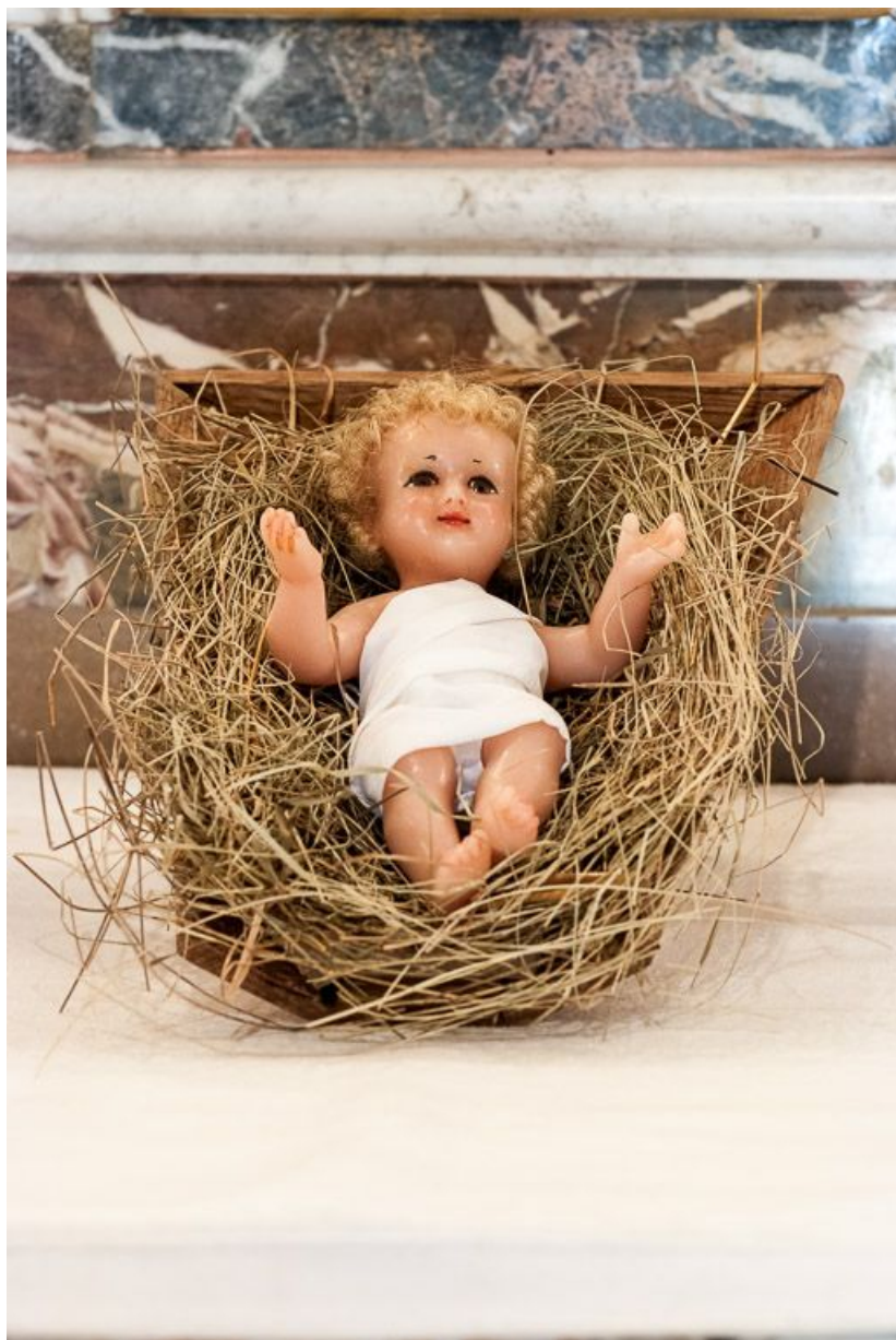
Vue d'ensemble du santon enfant Jésus.