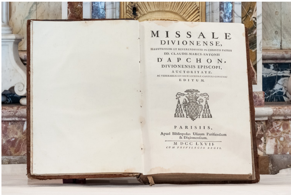
Missel : page de garde. 21, Chorey-les-Beaune