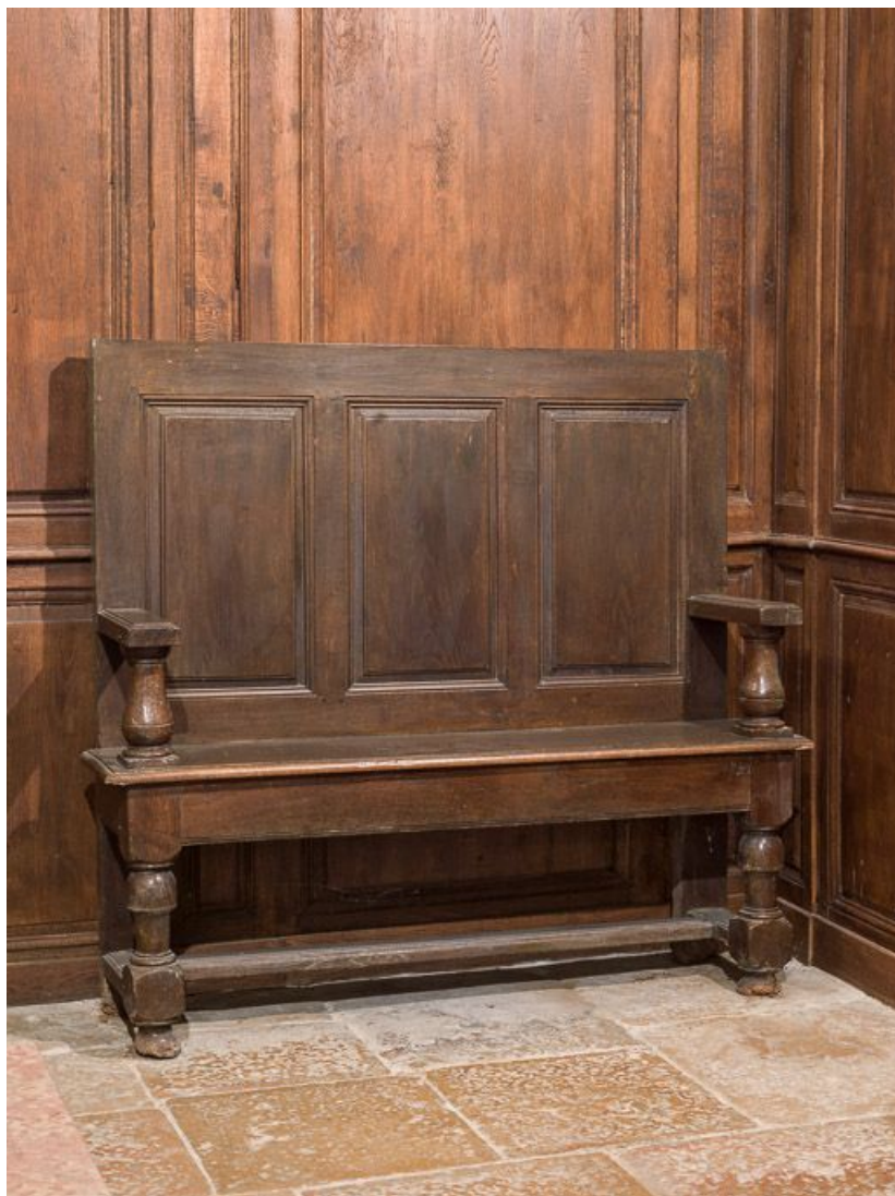
Vue d'ensemble du banc.