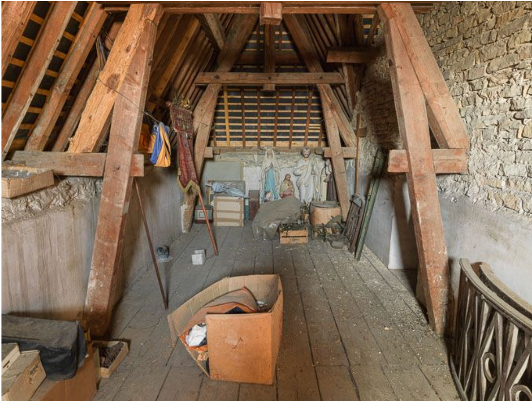
Dépôt d'objets dans les combles de la mairie.