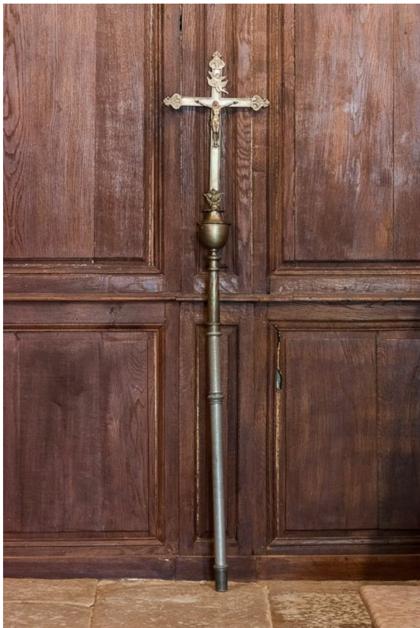
Croix de procession : vue d'ensemble.