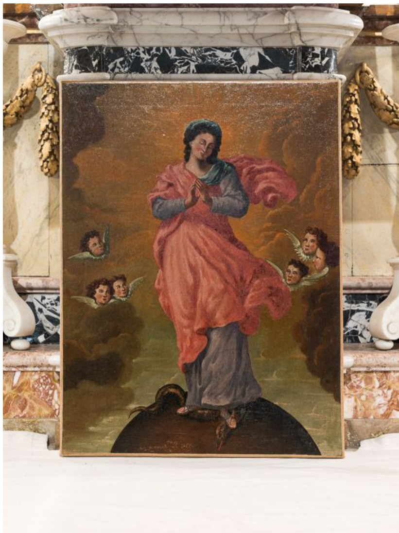
Tableau de la Vierge de l'Apocalypse : vue d'ensemble. 21, Chorey-les-Beaune