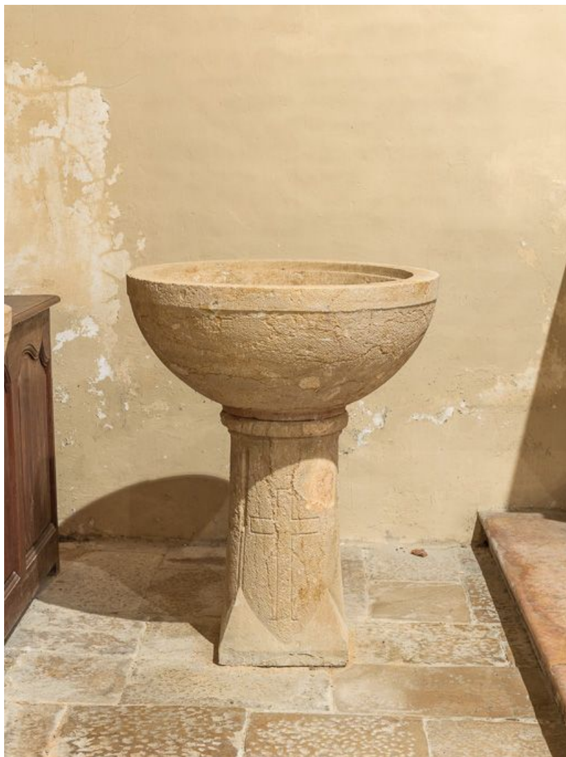
Vue rapprochée des fonts baptismaux, sans couvercle.