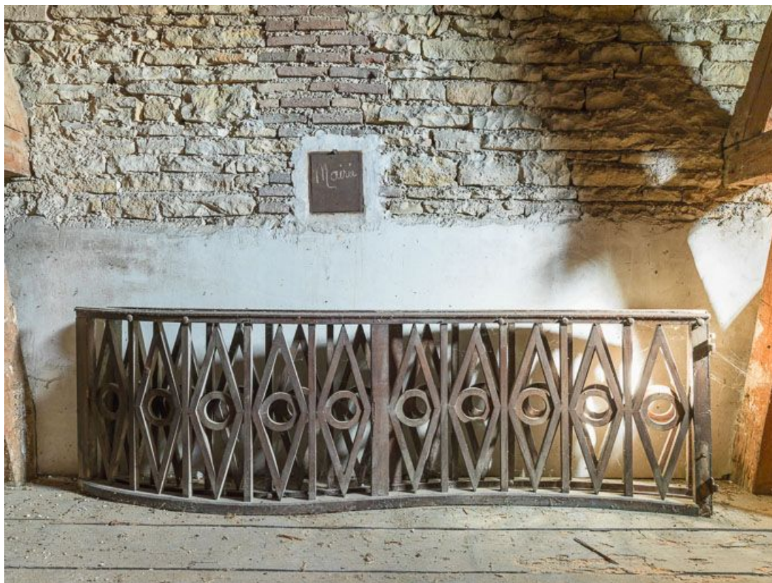
Clôture de chœur déposée : vue d'ensemble.