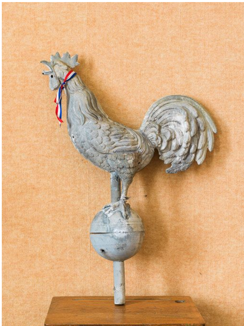
Vue d'ensemble de la girouette.