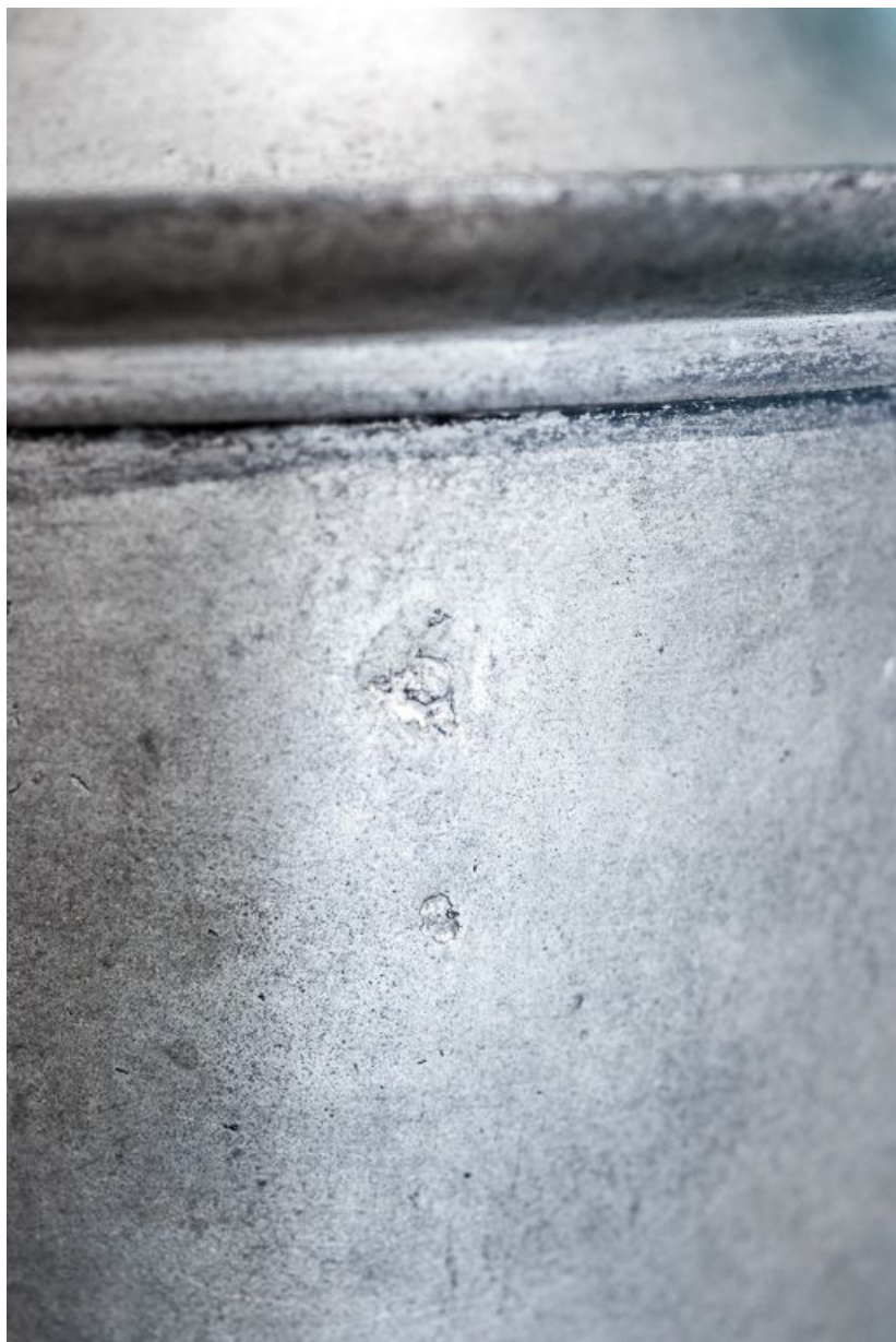
Croix de procession : détail (poinçon effacé ?).