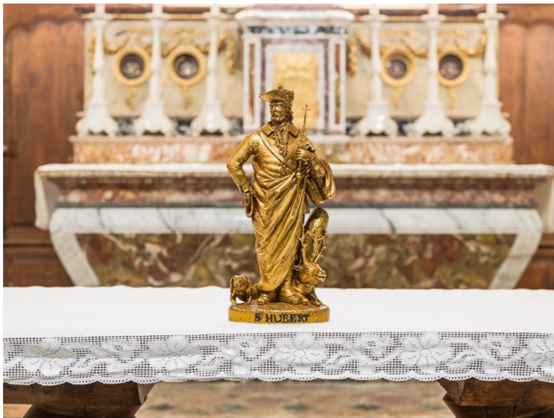
Statue de saint Hubert : vue d'ensemble.