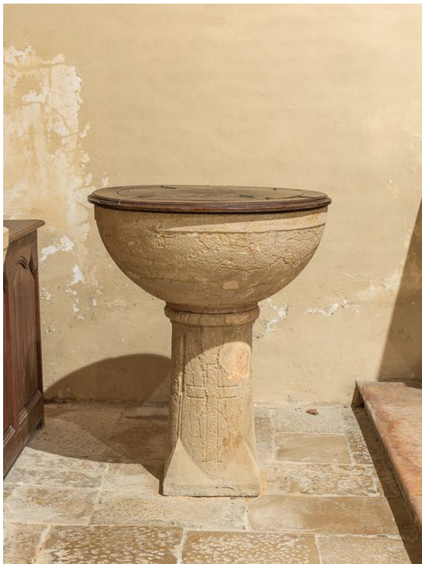
Vue rapprochée des fonts baptismaux, avec couvercle.