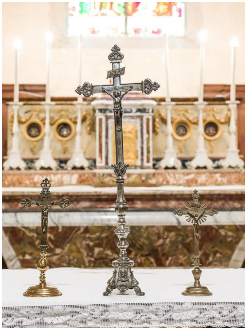
Trois croix d'autel.