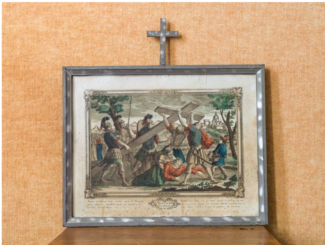
Neuvième station : Jésus tombe pour la 3e fois.