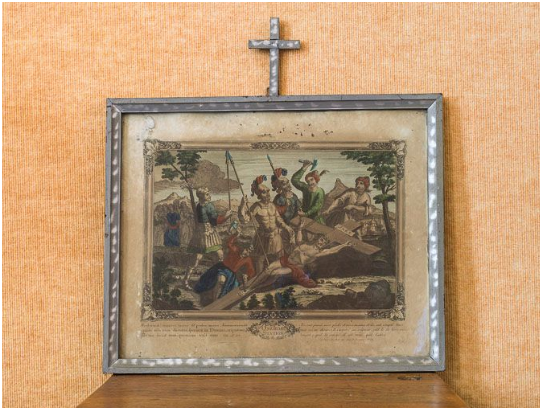
Onzième station : Jésus est attaché à la croix.