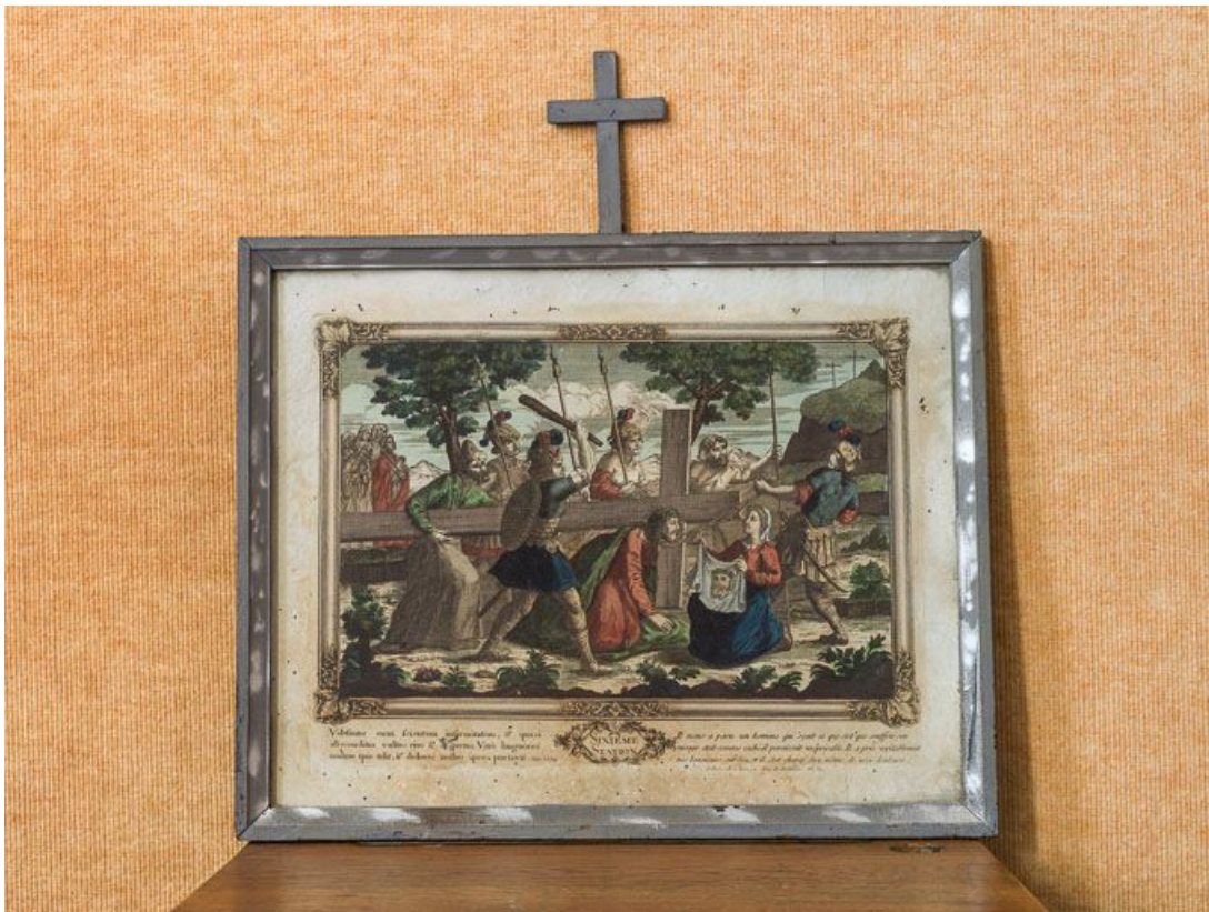
Sixième station : Véronique essuie la face de Jésus.