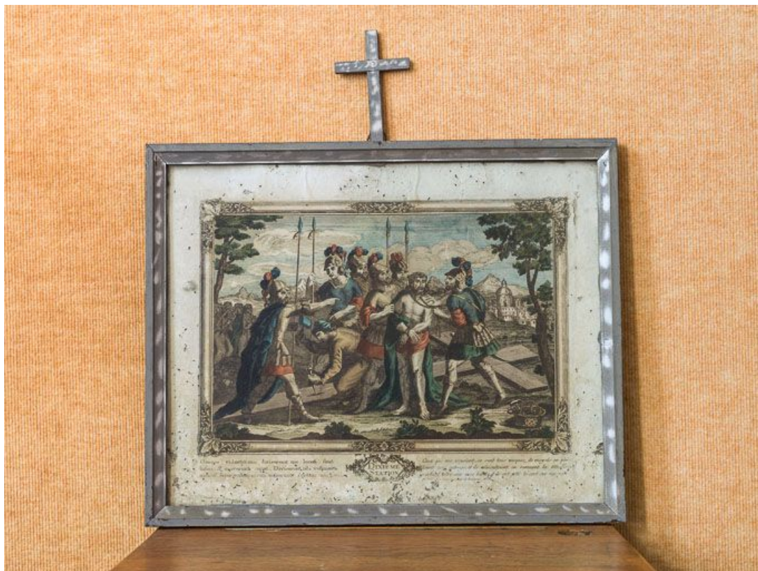
Dixième station : Jésus est dépouillé de ses vêtements.