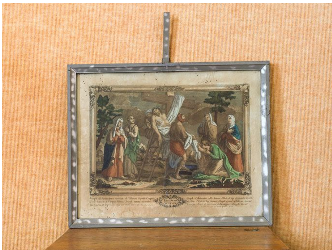
Treizième station : Jésus est descendu de la croix et remis à sa mère.