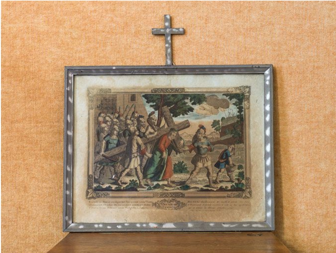
Deuxième station : Jésus est chargé de sa croix.