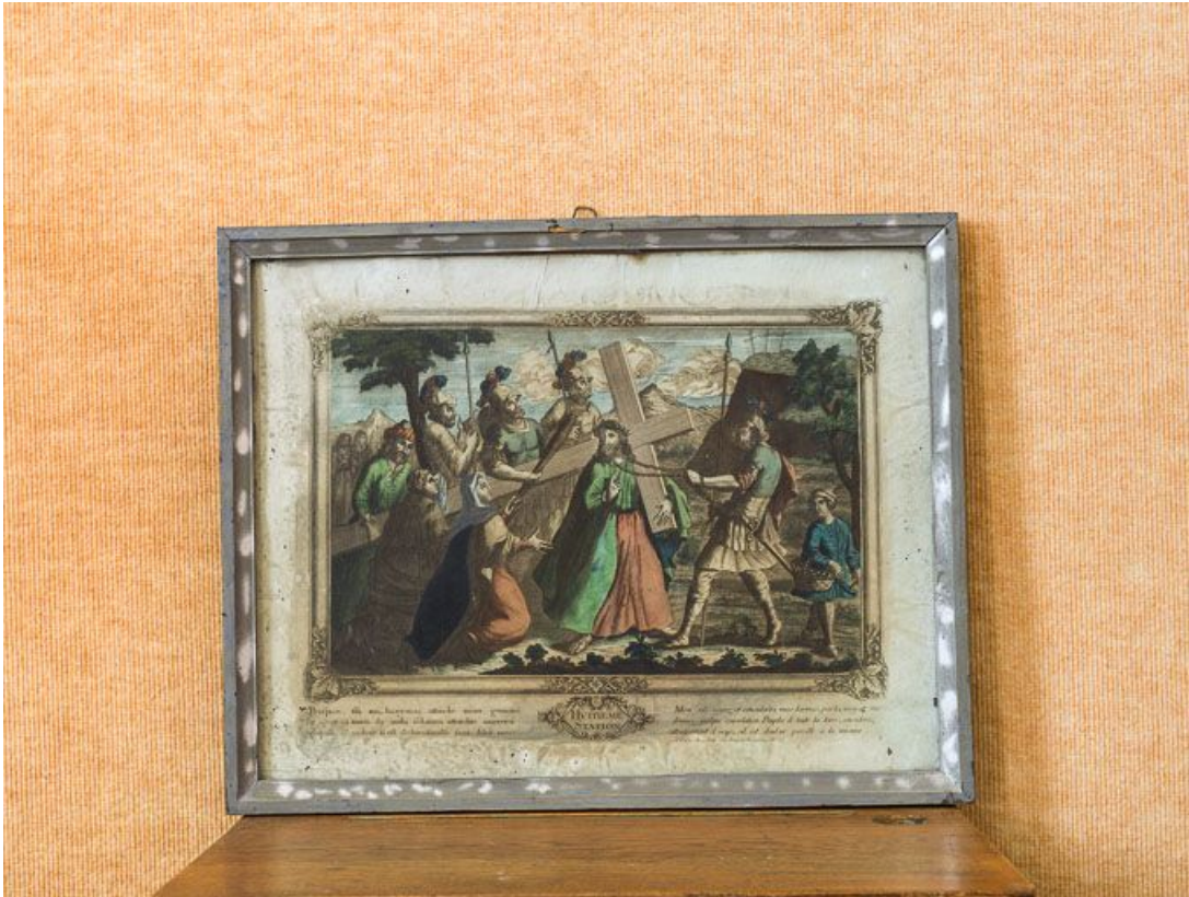
Huitième station : Jésus console les filles de Jérusalem.