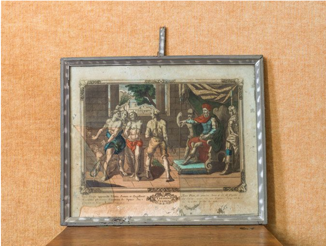
Première station : Jésus est condamné à mort.