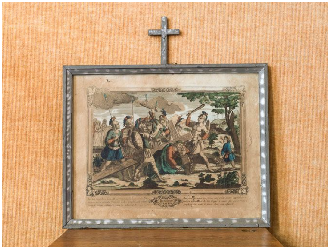
Troisième station : Jésus tombe sous le bois de la croix.