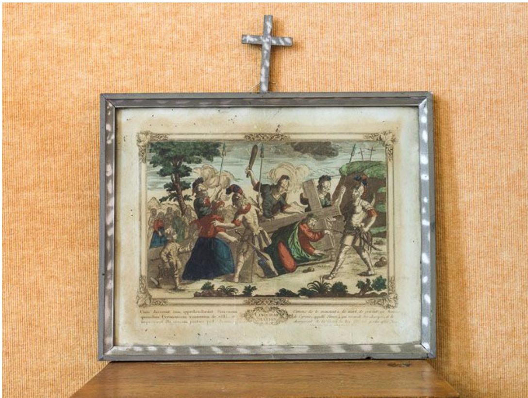
Cinquième station : Simon le Cyrénéen aide Jésus à porter sa croix.