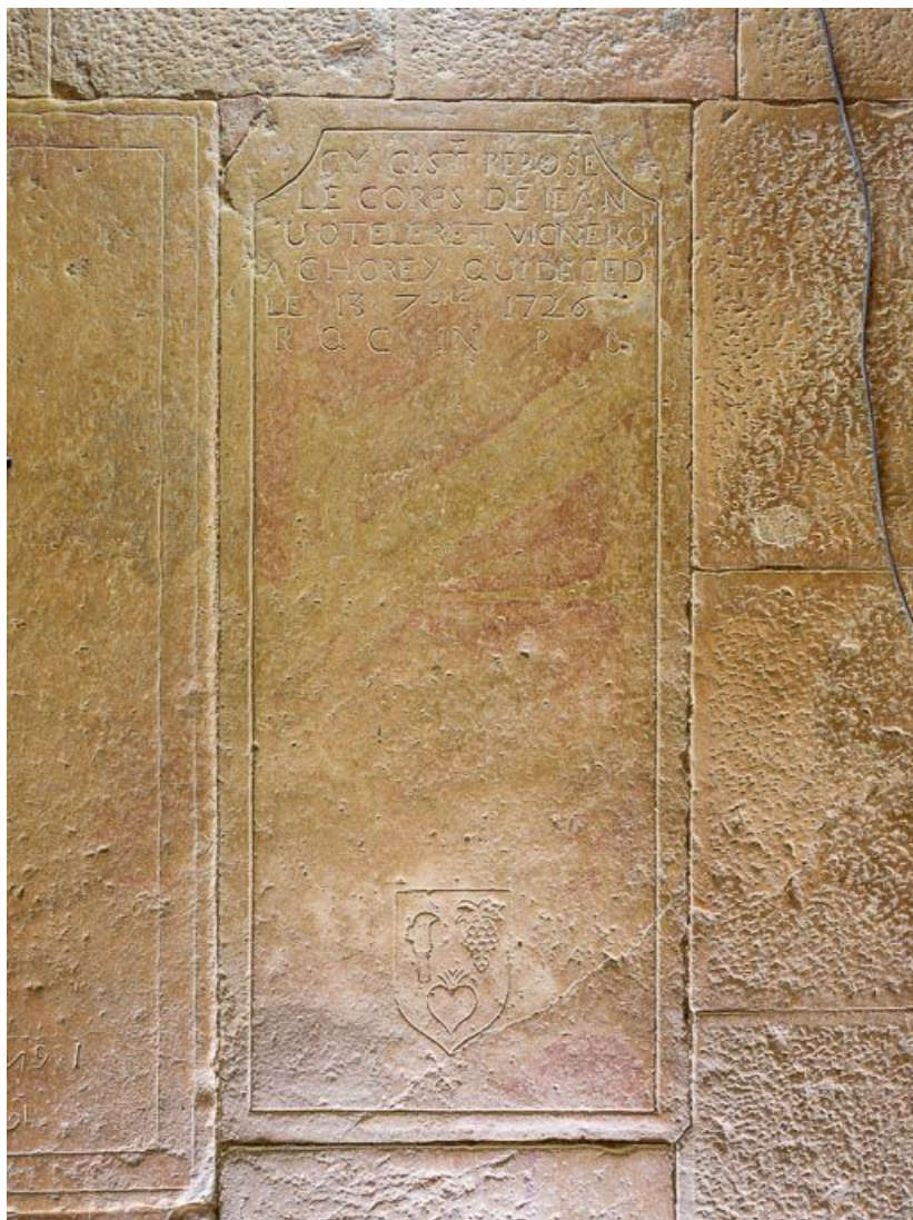
Dalle funéraire de Jean Voterret, 1726 : vue d'ensemble.