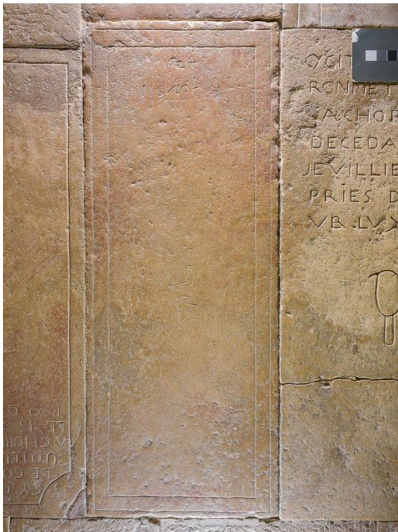
Dalle funéraire, 1624 : vue d'ensemble.