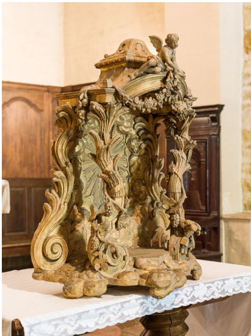
Vue de trois-quarts droite.