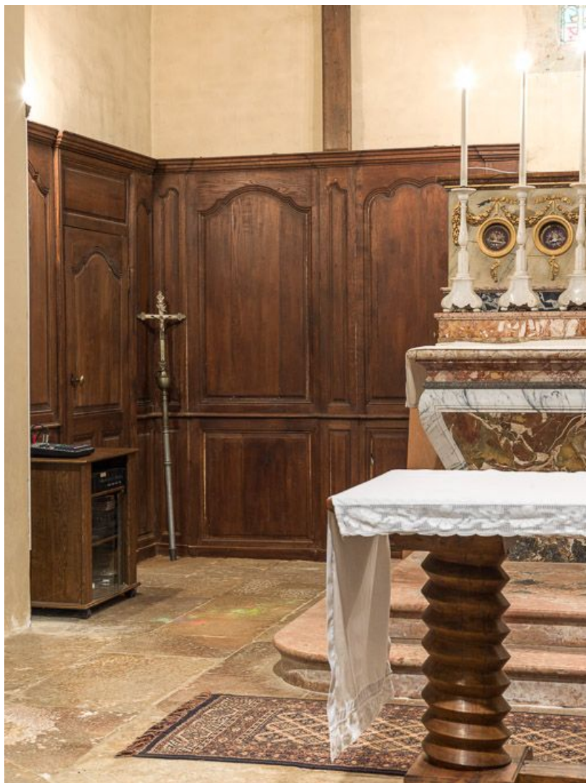
Vue des boiseries du chœur côté sacristie.