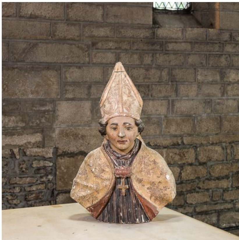
Buste-reliquaire de St Aubin : vue d'ensemble.