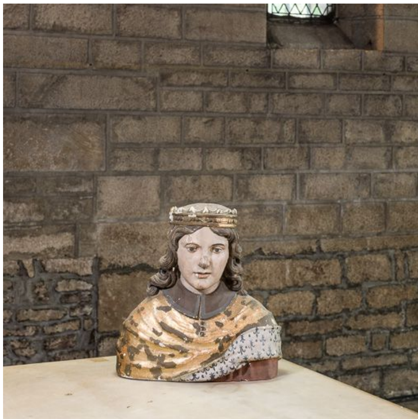
Buste-reliquaire à l'effigie d'un roi : vue d'ensemble.