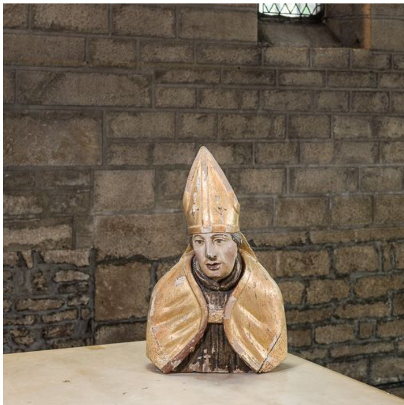
Buste-reliquaire à l'effigie d'un évêque : vue d'ensemble.