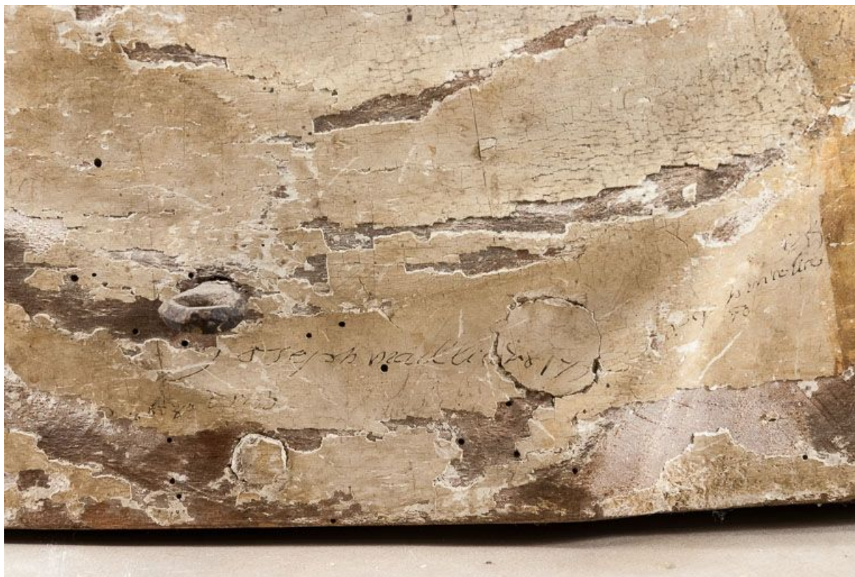
Buste-reliquaire à l'effigie d'un roi : détail de la signature au dos.