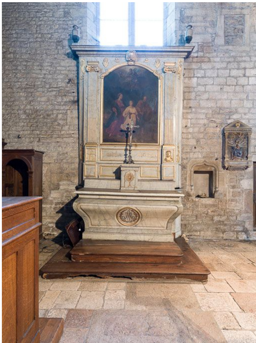
Vue d'ensemble, avec l'autel.