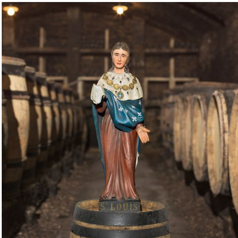
Vue de face sans bouquet. 21, Monthelie