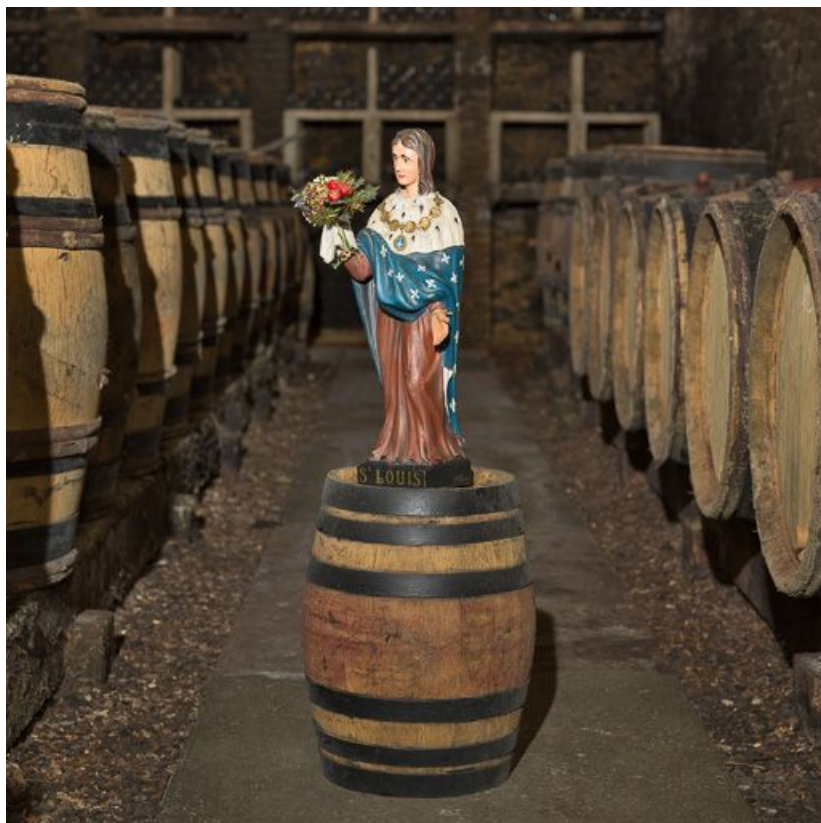
Vue de trois-quarts.