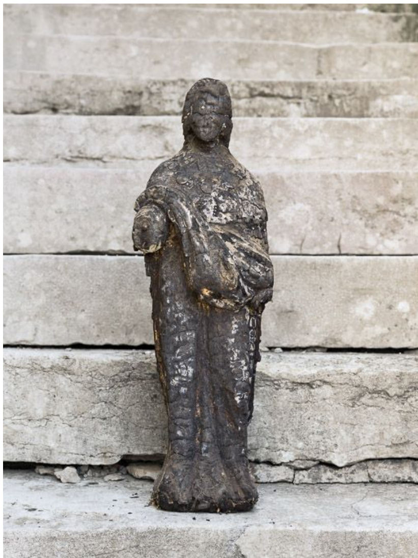
Vue de face. 21, Montheilie