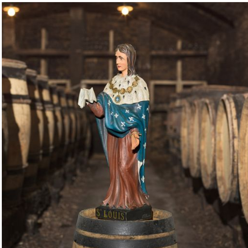
Vue de trois-quarts sans bouquet.