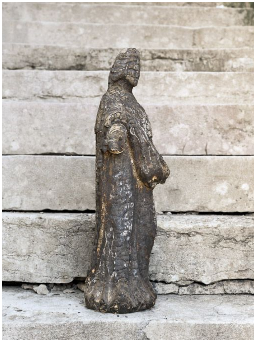
Profil droit. 21, Montheleie