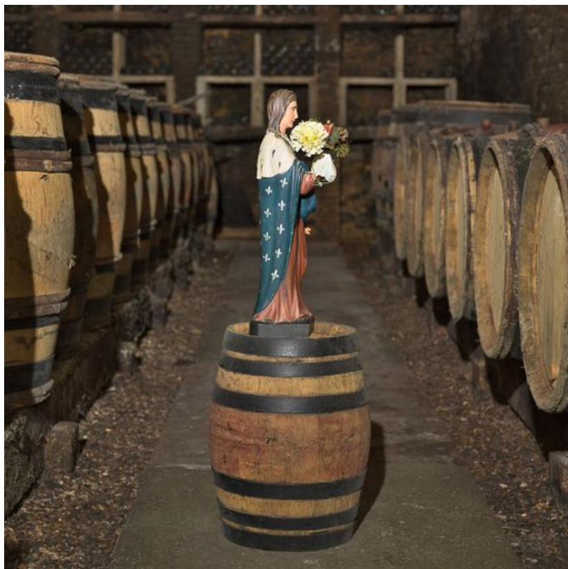
Profil droit. 21, Monthelie