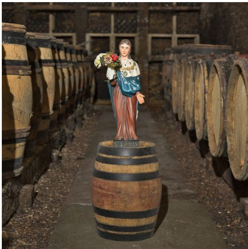
Vue de face. 21, Monthelie