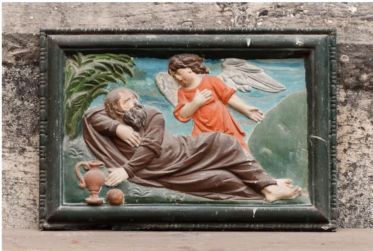
Bas-relief : Elie nourri par un ange.

21, Volnay R.D. 973, lieudit : près de En Verseuil