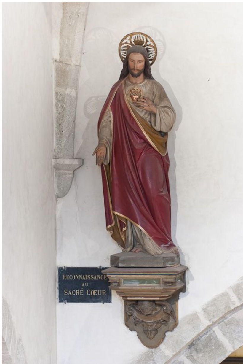
Statue du Sacré-Cœur : vue d'ensemble.