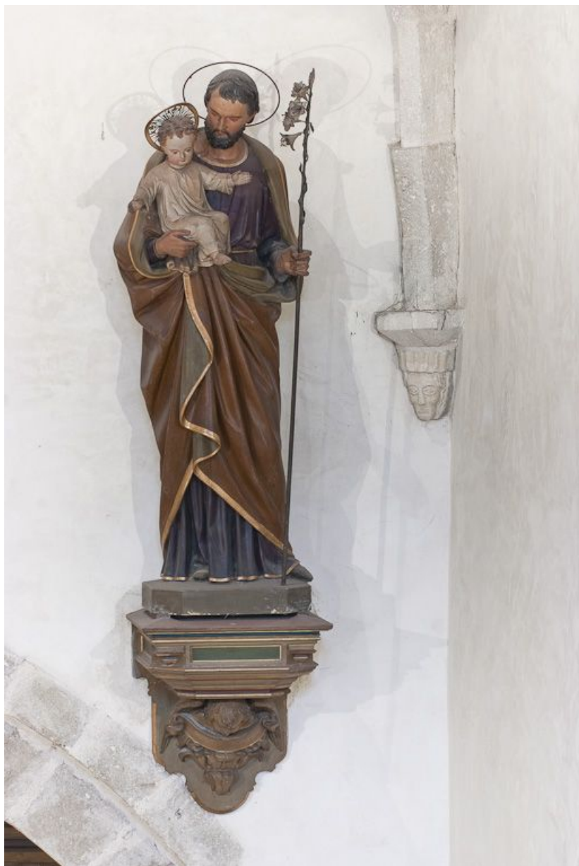
Statue de saint Joseph et l'Enfant Jésus : vue d'ensemble. 21, Volnay