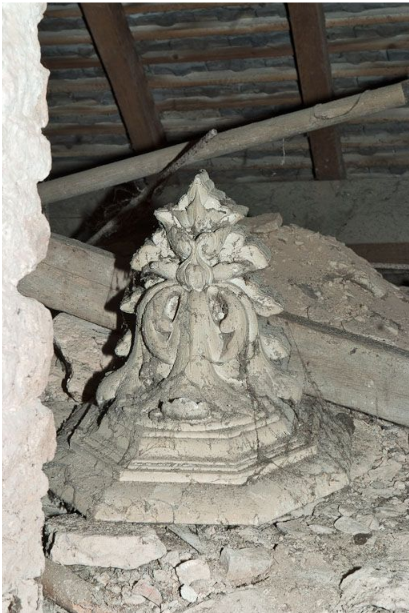
Vue d'ensemble d'une console.