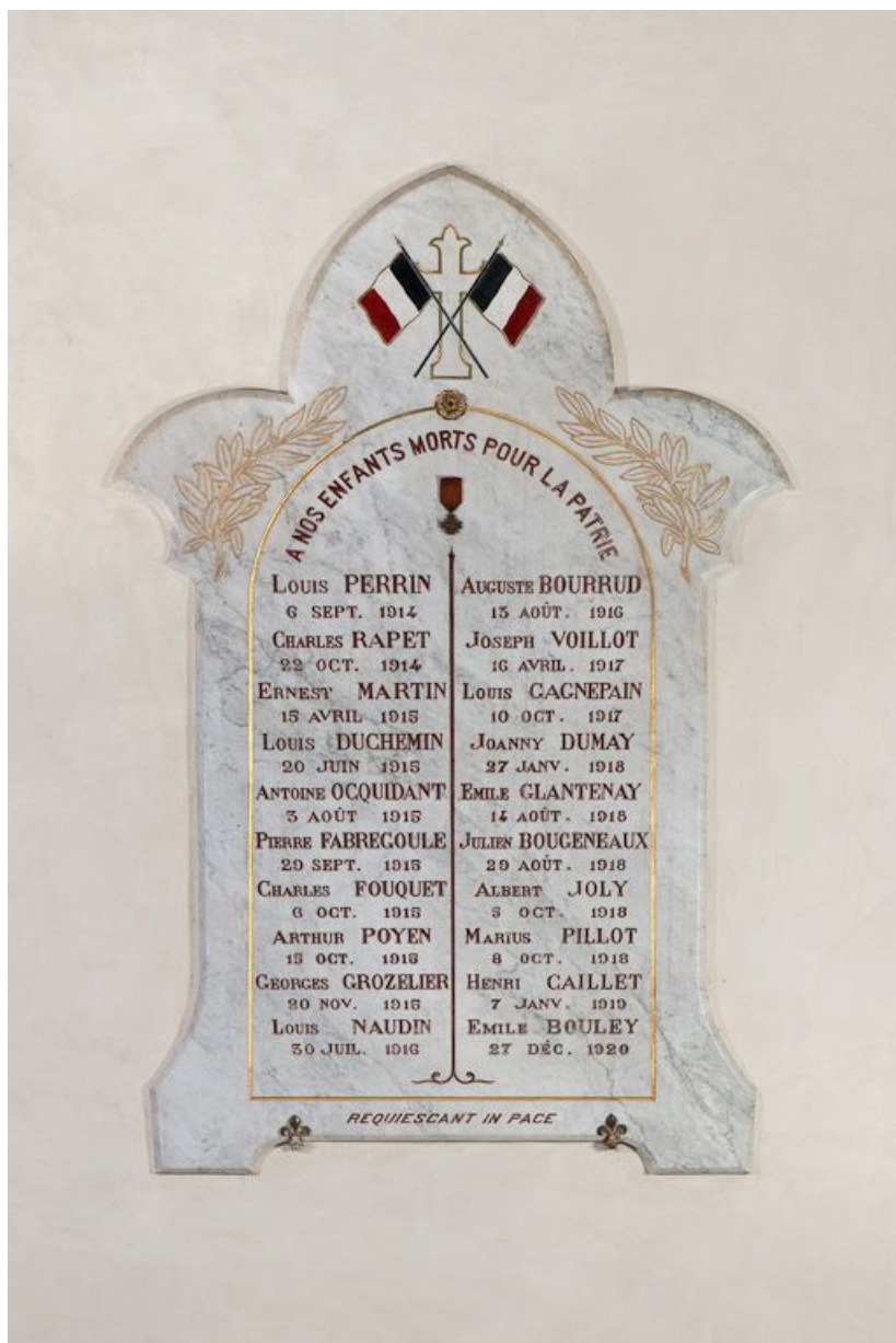
Vue d'ensemble d'une plaque commémorative. 21, Volnay