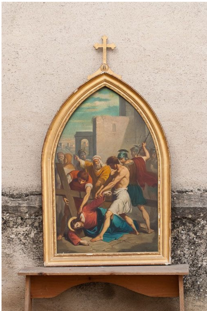
Chemin de croix : vue de la IXe station.