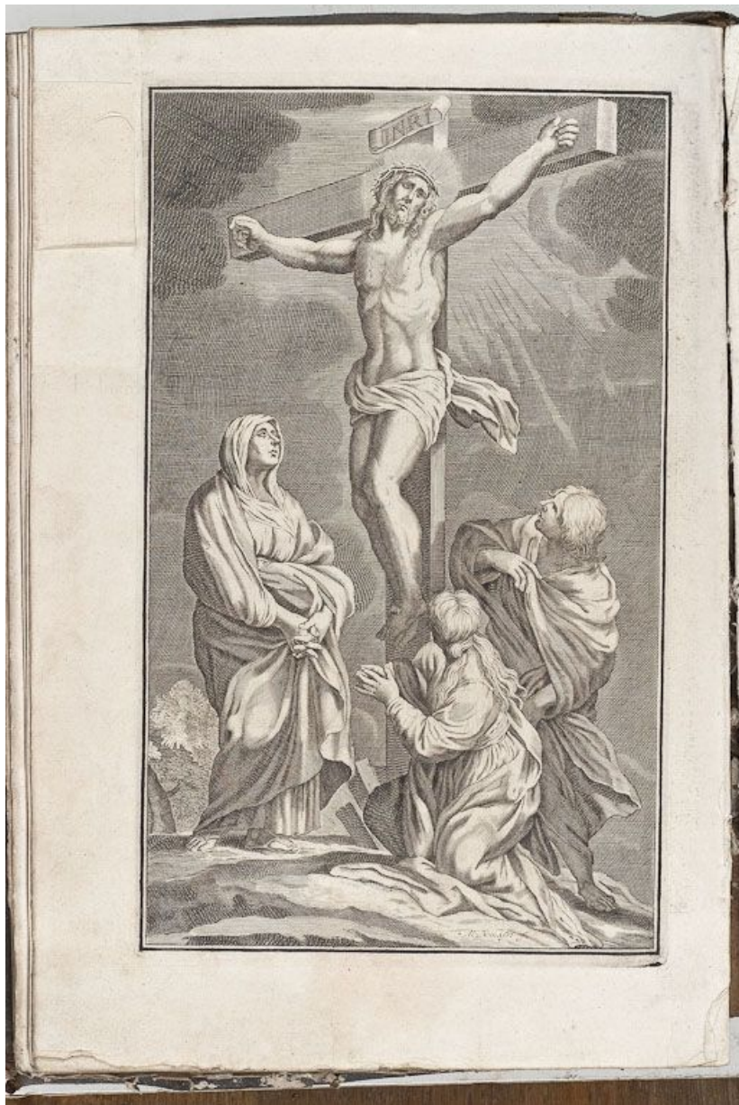
Estampe : Calvaire.