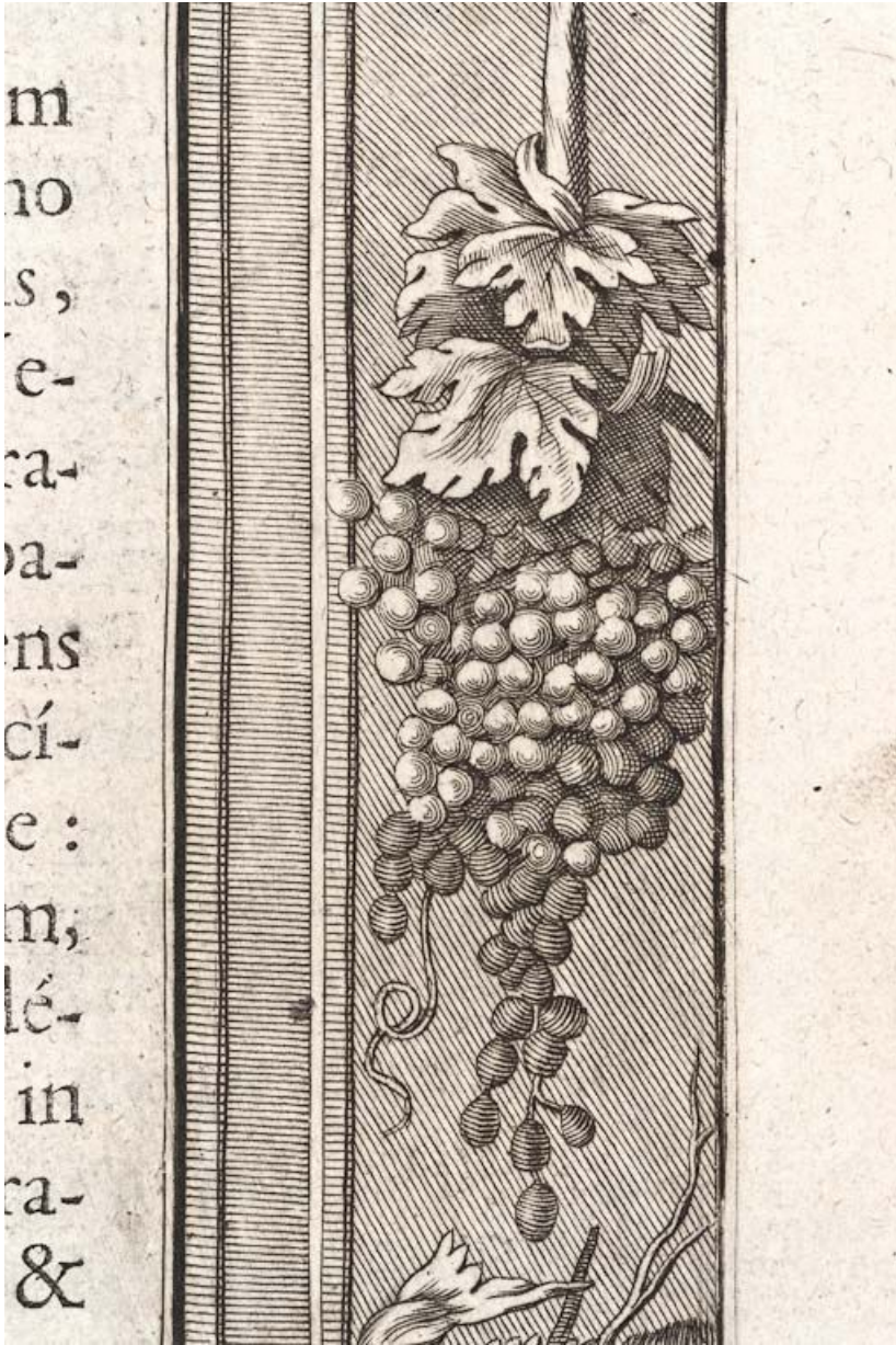
Page 319, détail : grappe de raisin.