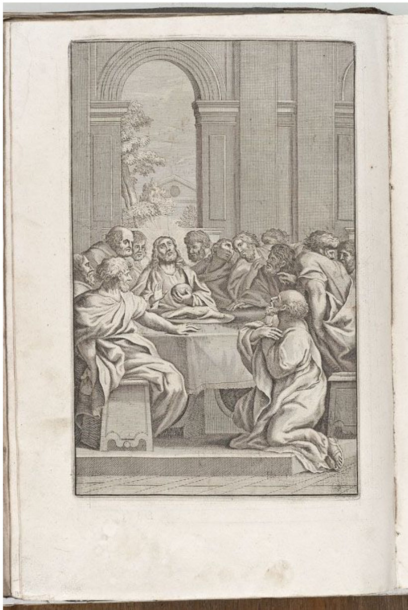
Estampe : la Cène.