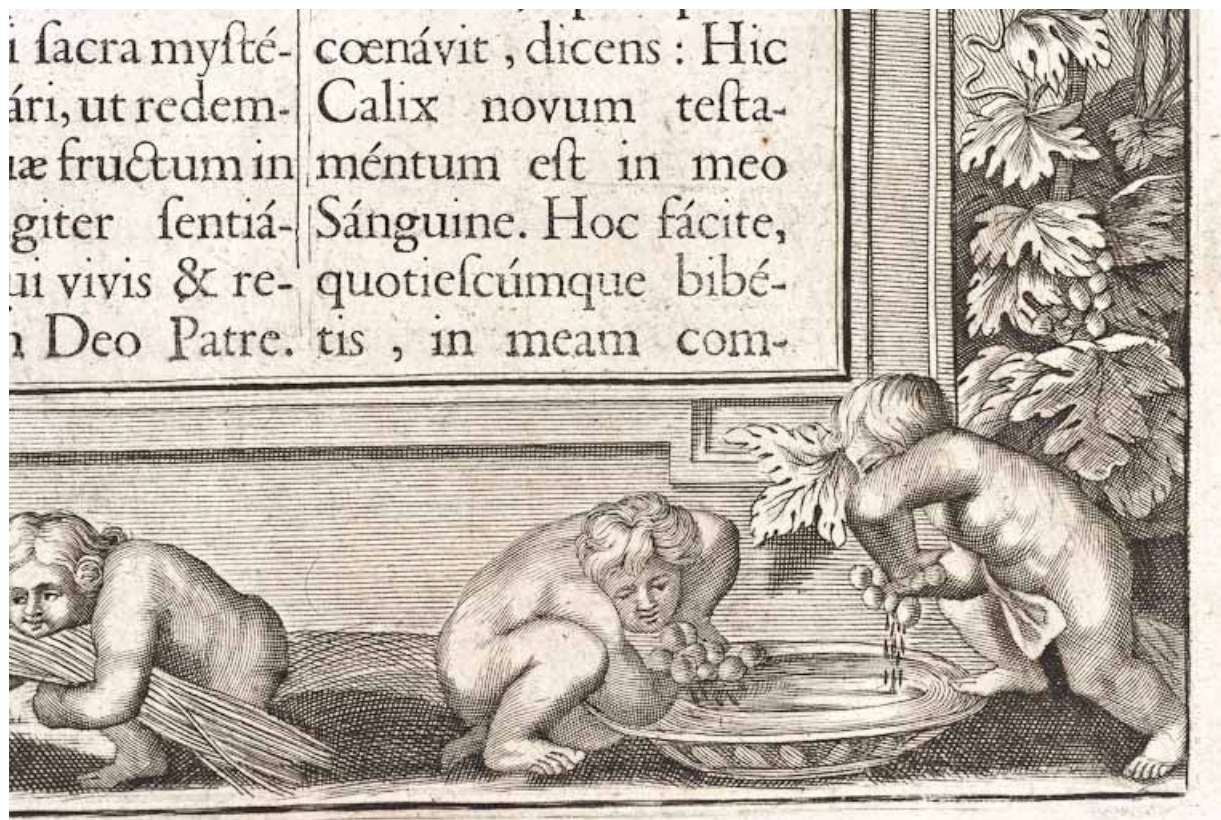
Page 319, détail : enfants pressant le raisin. 21, Volnay