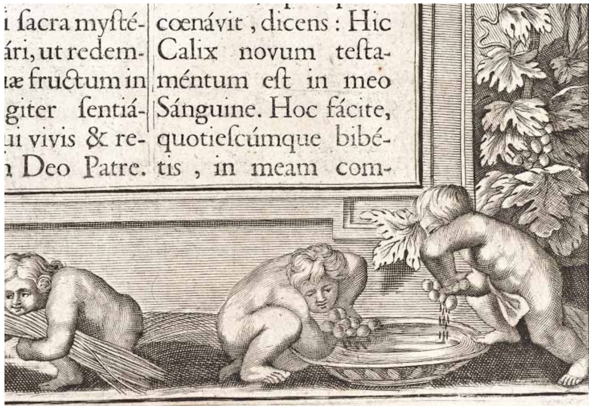
Page 319, détail : enfants pressant le raisin. 21, Volnay