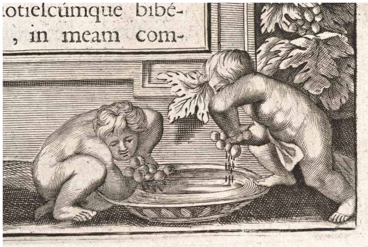
Page 319, détail : enfants pressant le raisin. 21, Volnay