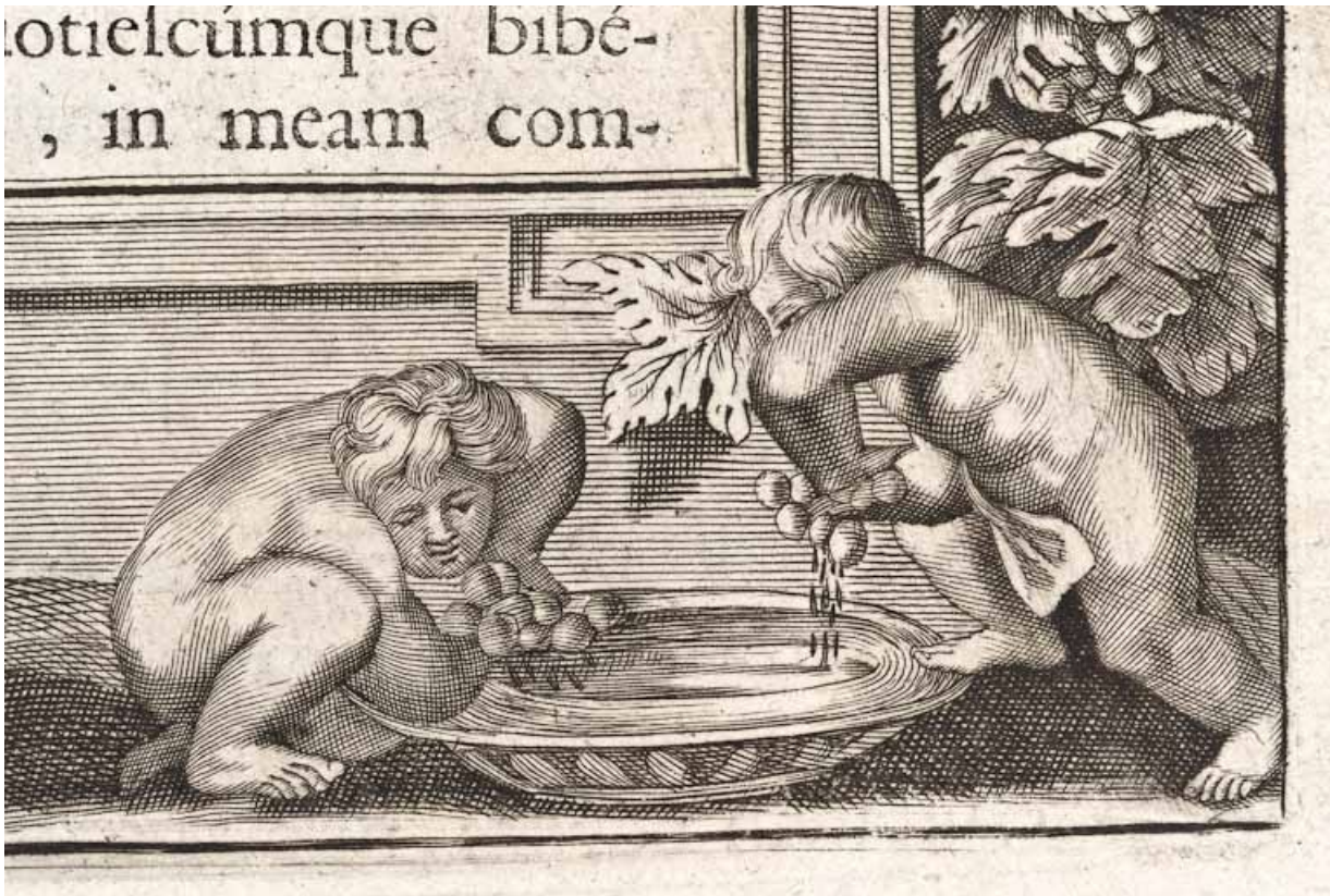
Page 319, détail : enfants pressant le raisin. 21, Volnay