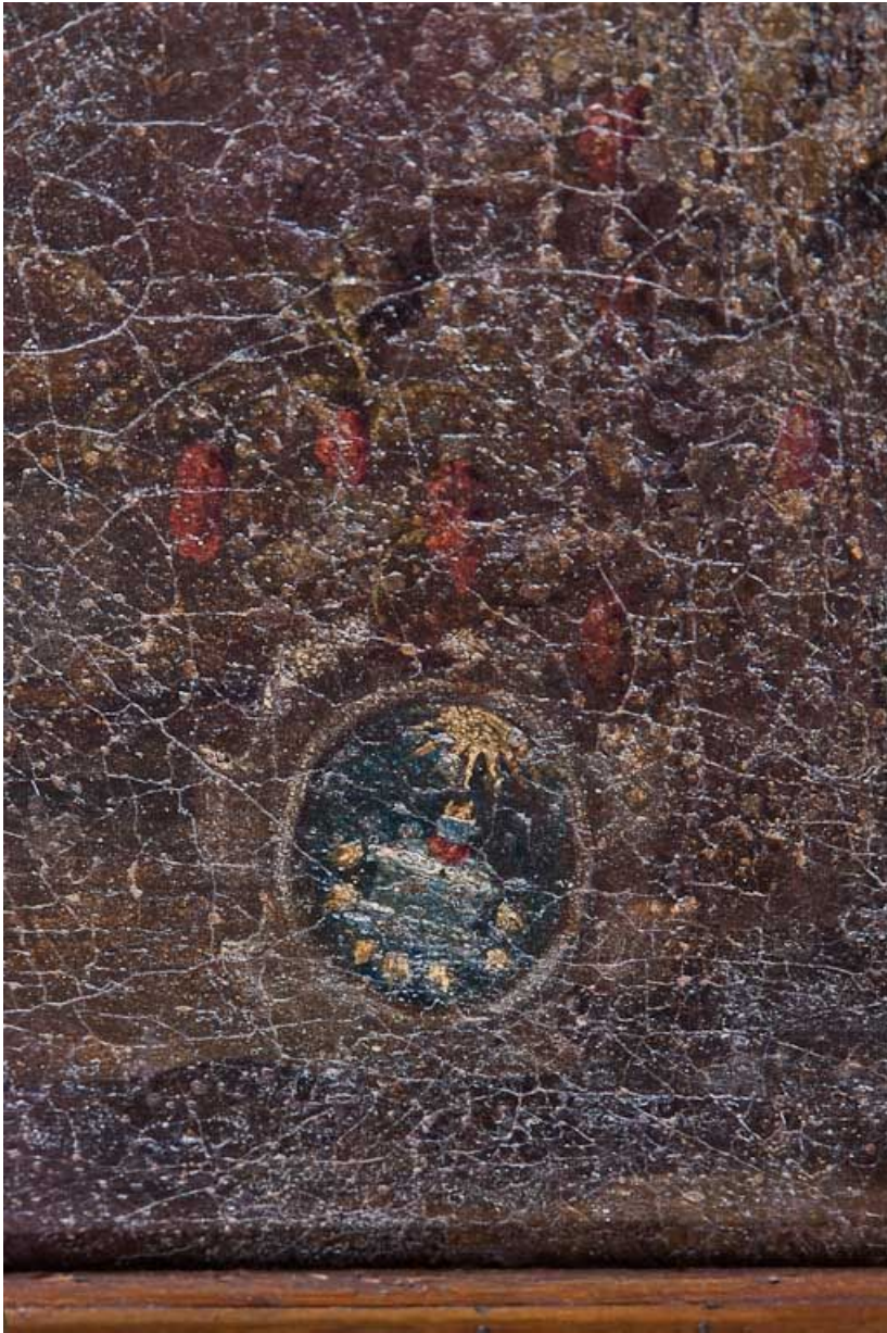
Détail des armoiries.