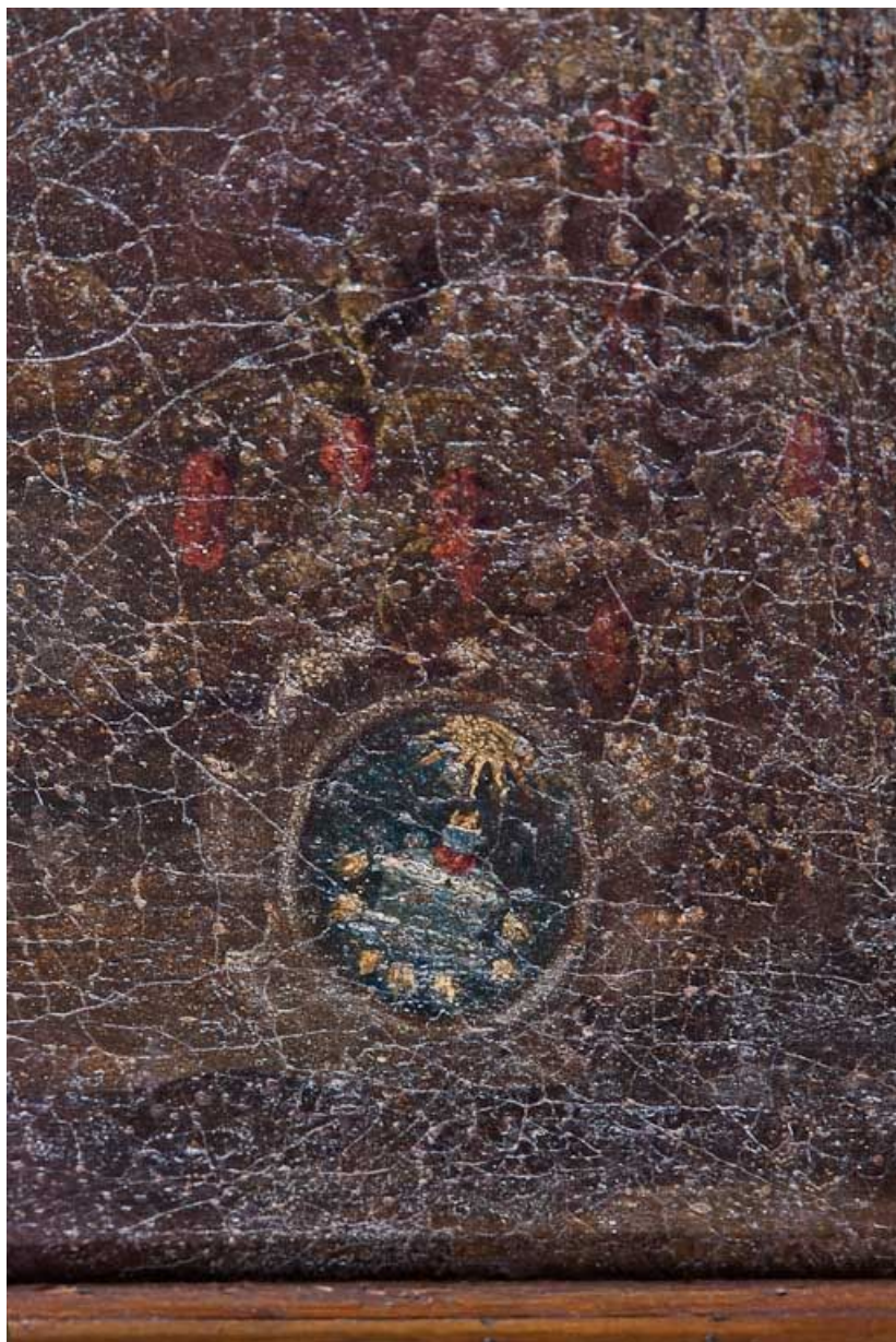
Détail des armoiries.