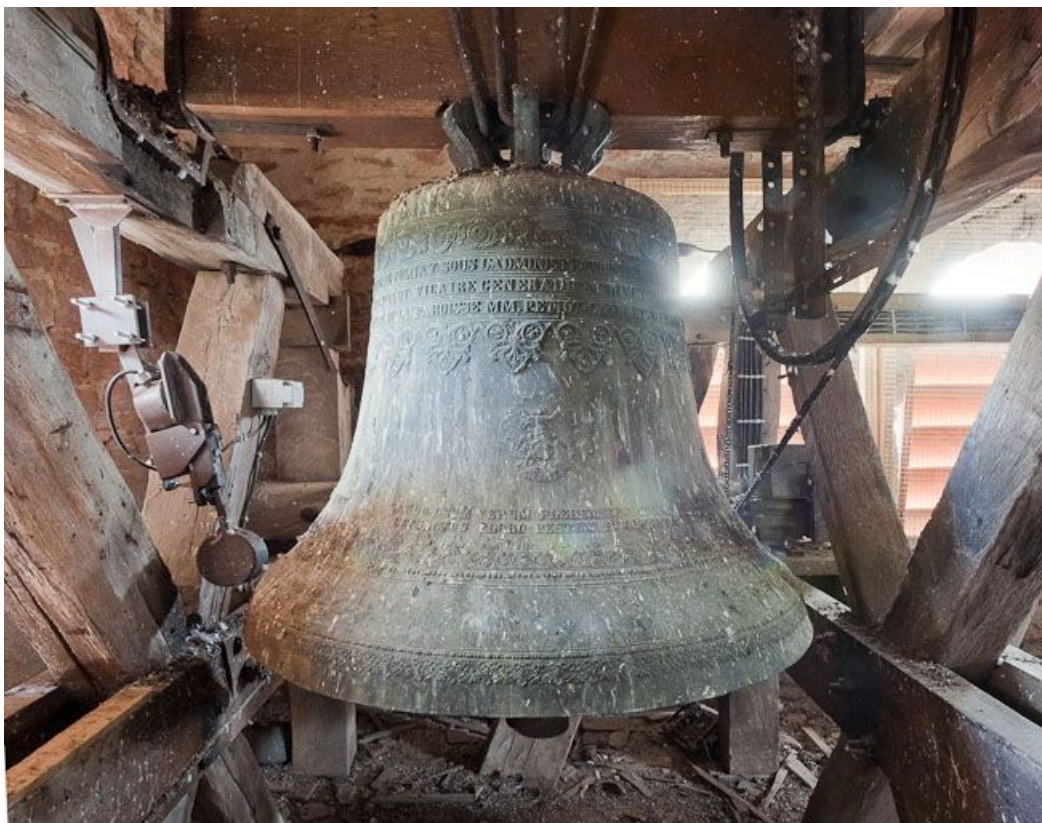
Vue d'ensemble. 21, Volnay

N° de l'illustration : 20112100313NUC2AQ