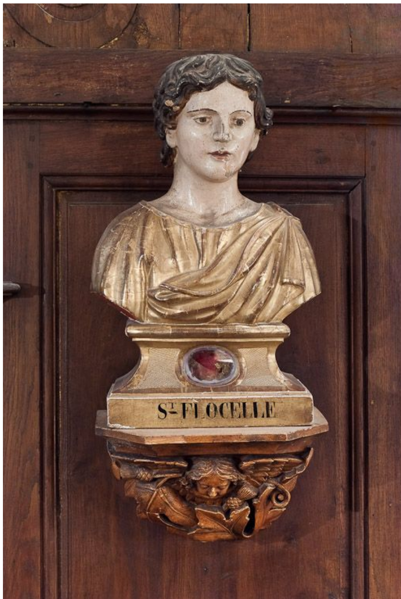
Saint Flocel. 21, Volnay