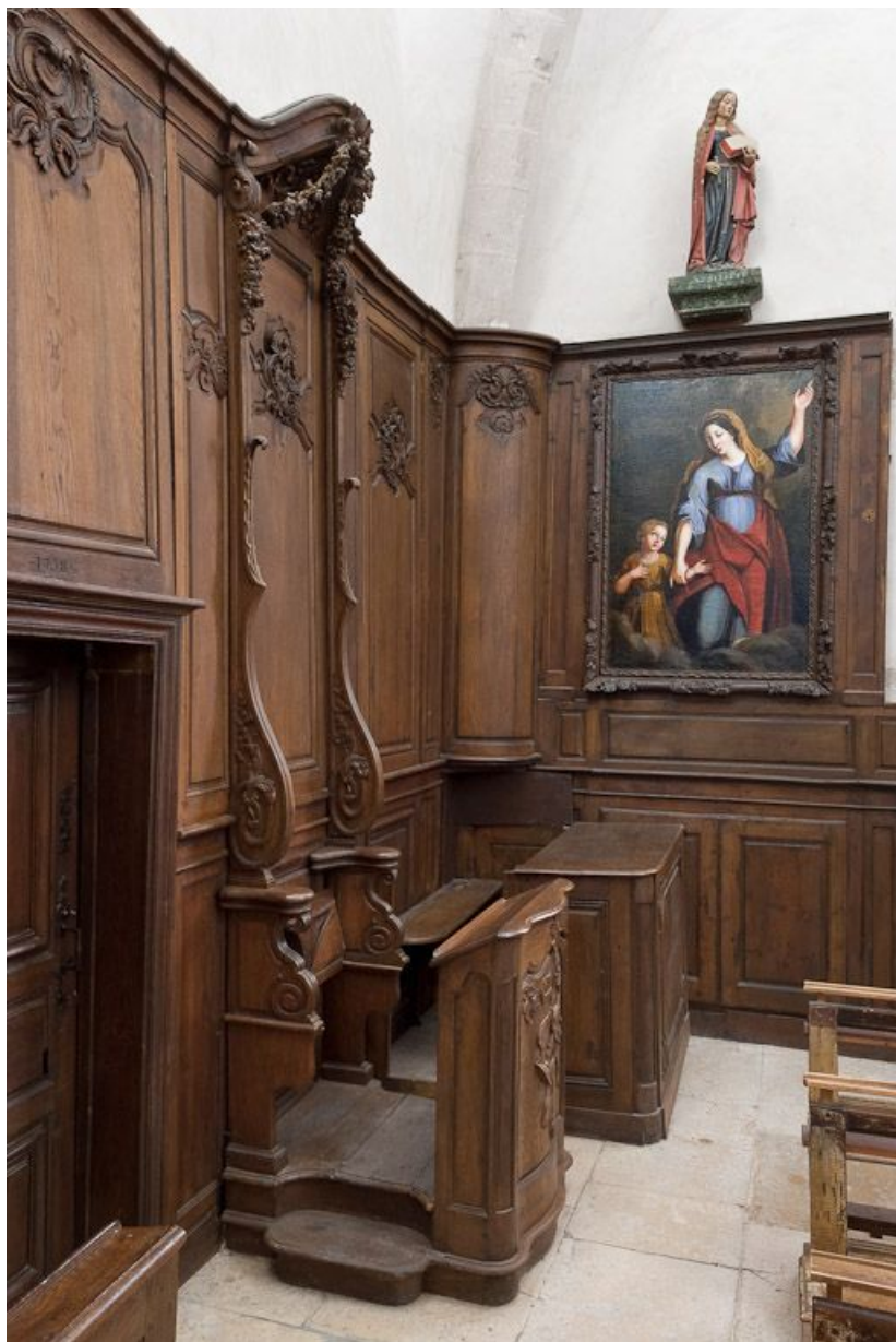
Stalle et banc de chœur à gauche.