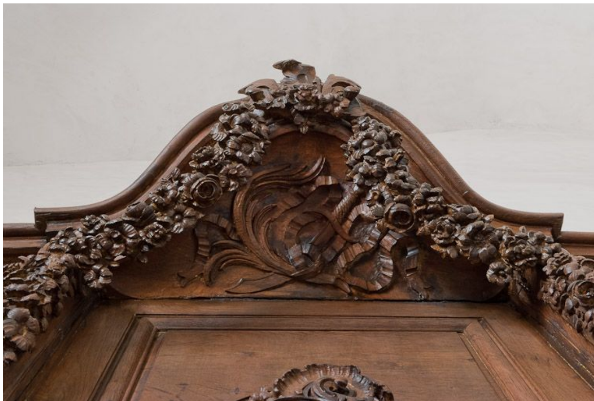
Détail de la stalle droite.