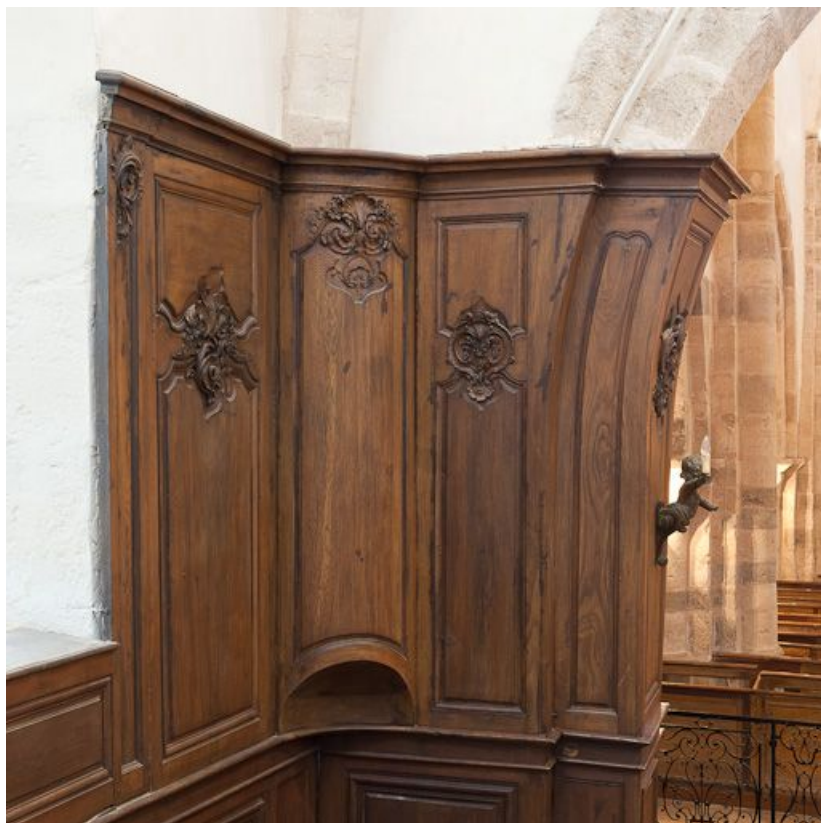
Lambris de l'angle antérieur droit du chœur. 21, Volnay

N° de l'illustration : 20112100207NUC2AQ