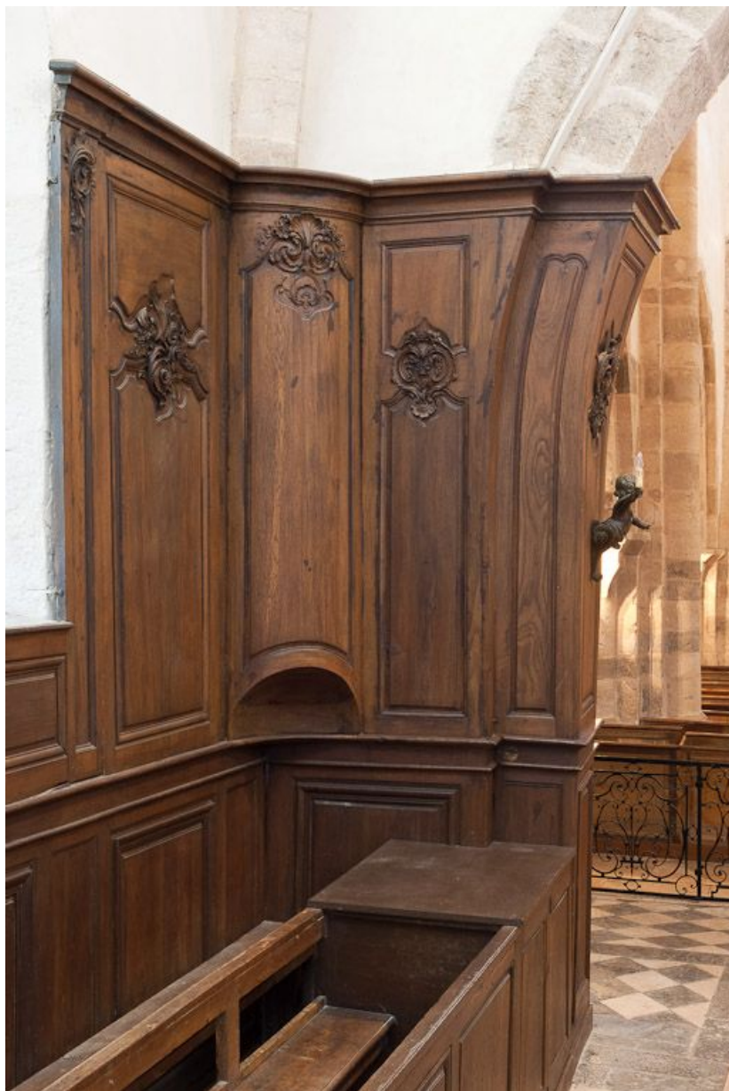
Lambris de l'angle antérieur droit du chœur. 21, Volnay