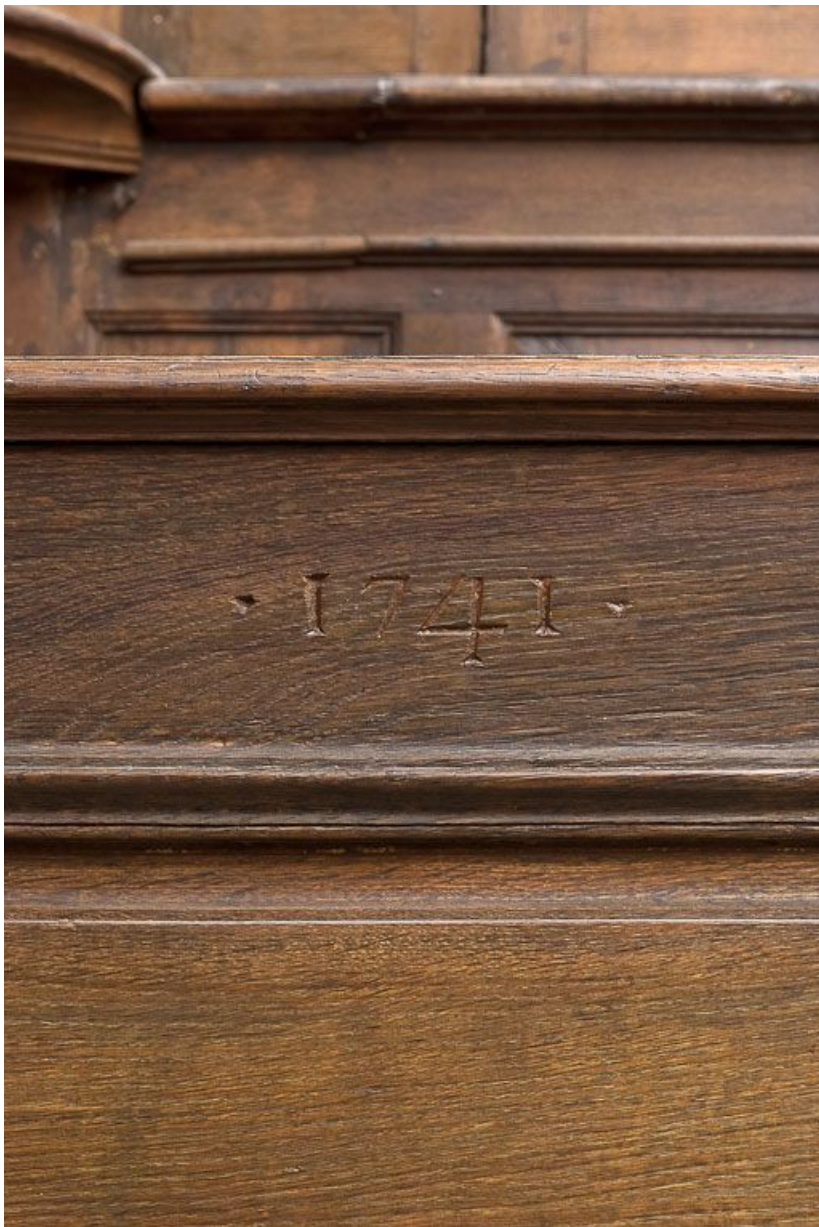
Détail de la date du pupitre du banc de chœur droit. 21, Volnay