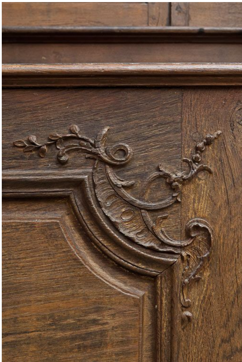
Détail du pupitre du banc de chœur droit. 21, Volnay