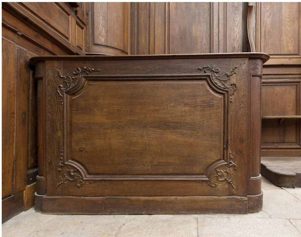
Pupitre du banc de chœur droit.