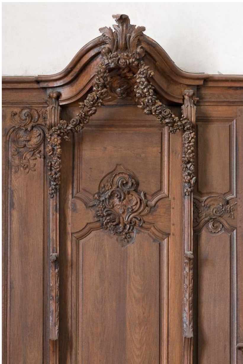
Détail de la stalle droite.