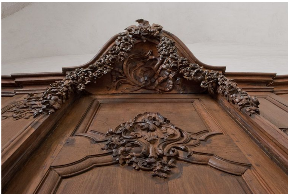
Détail de la stalle droite.