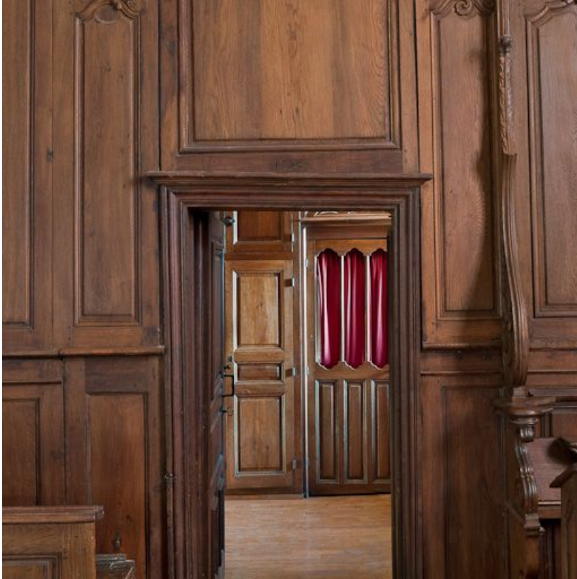
Porte de la sacristie.