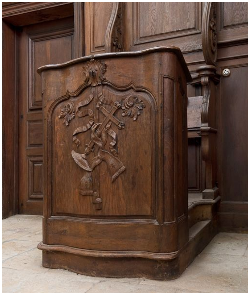
Pupitre de la stalle gauche.