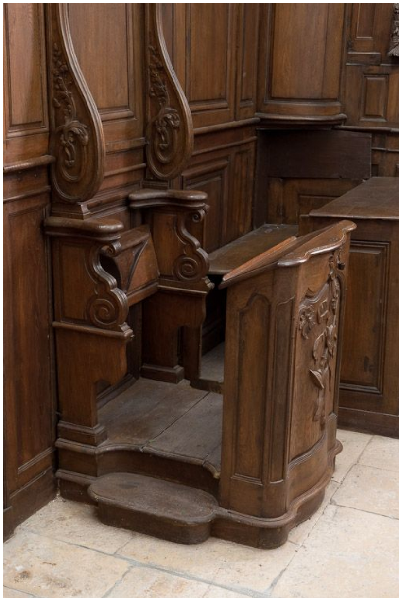
Stalle gauche. 21, Volnay