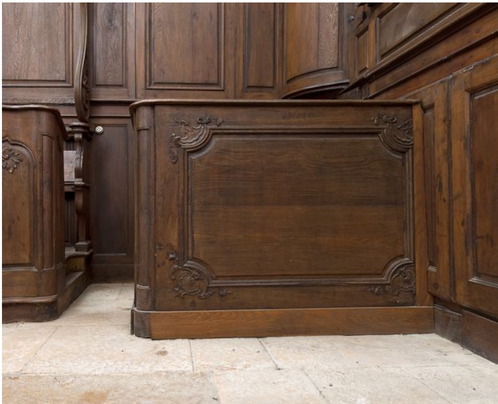
Pupitre du banc de chœur gauche.