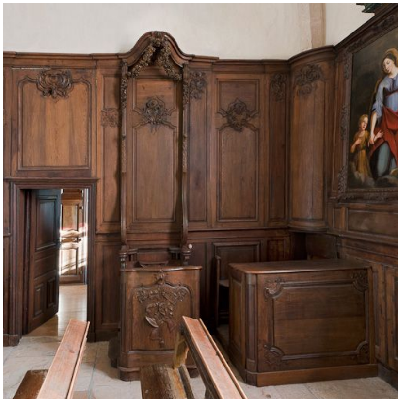
Stalle et banc de chœur à gauche.