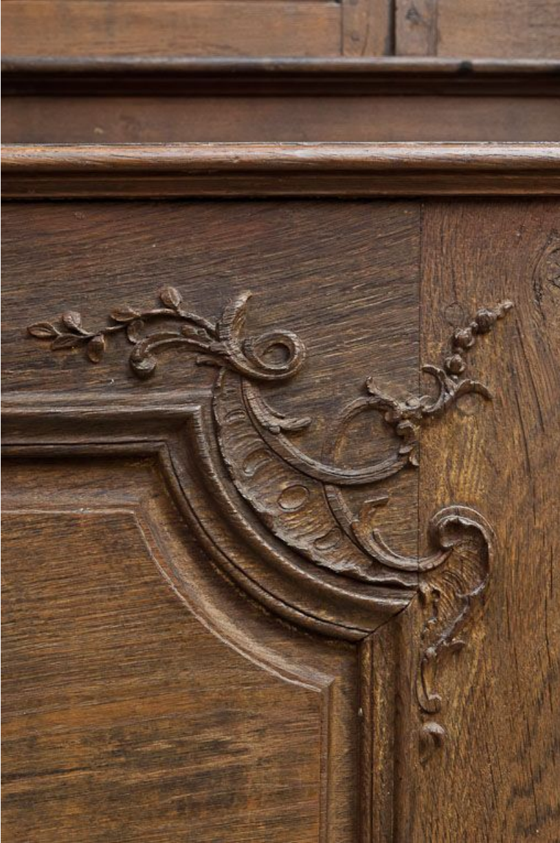
Détail du pupitre du banc de chœur droit. 21, Volnay