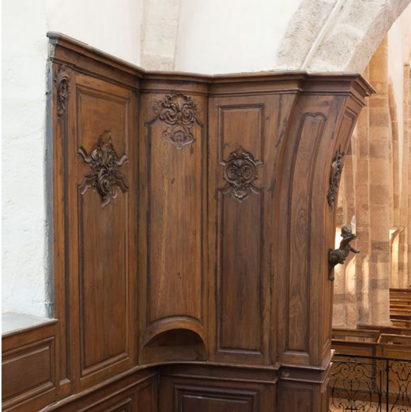
Lambris de l'angle antérieur droit du chœur. 21, Volnay

N° de l'illustration : 20112100207NUC2AQ