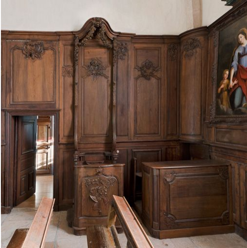
Stalle et banc de chœur à gauche. 21, Volnay

N° de l'illustration : 20112100191NUC2AQ