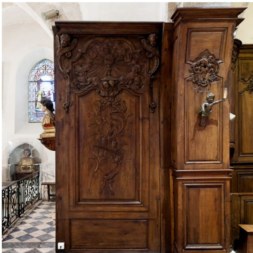
Lambris gauche avant l'arcade du chœur. 21, Volnay

N° de l'illustration : 20112100188NUC2AQ