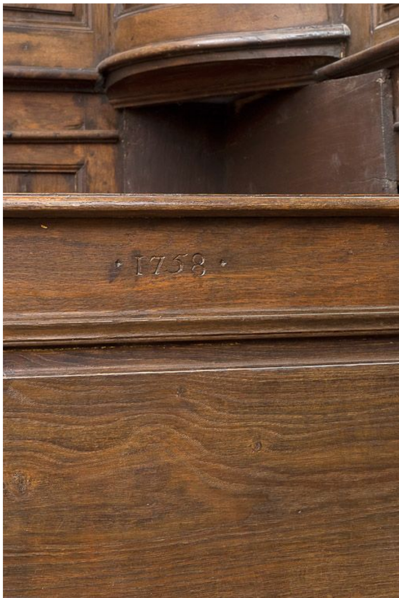
Détail de la date du banc de chœur gauche.