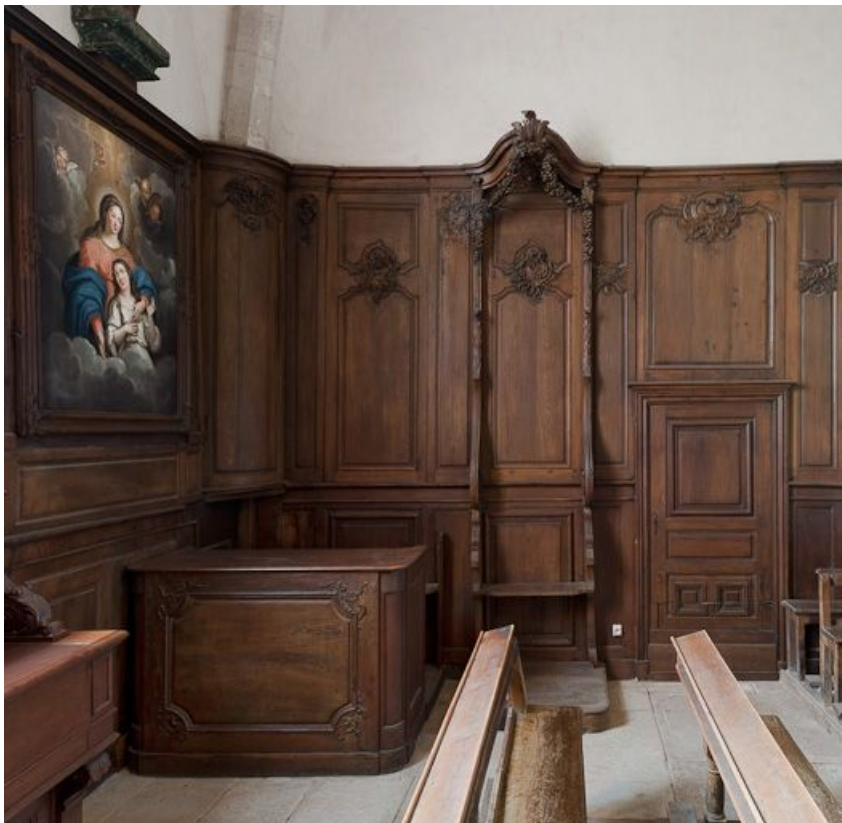
Stalle et banc de chœur à droite.