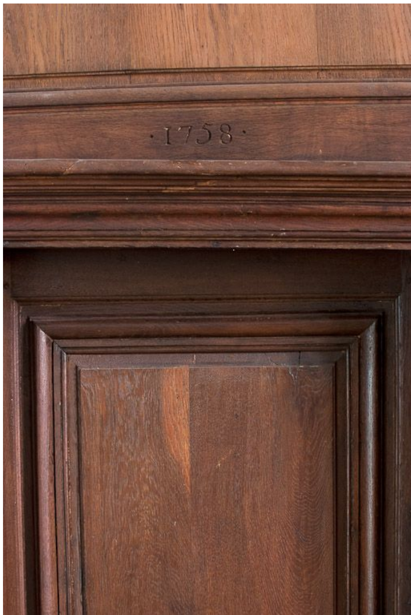
Date au-dessus de la porte de la sacristie.