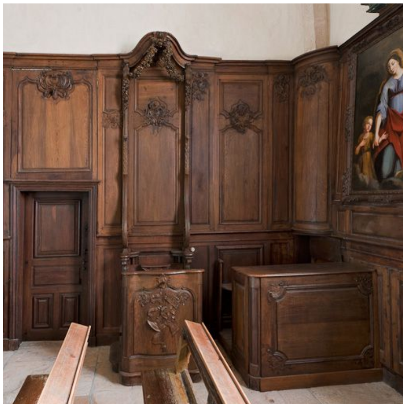
Stalle, banc de chœur et porte de la sacristie. 21, Volnay

N° de l'illustration : 20112100195NUC2AQ