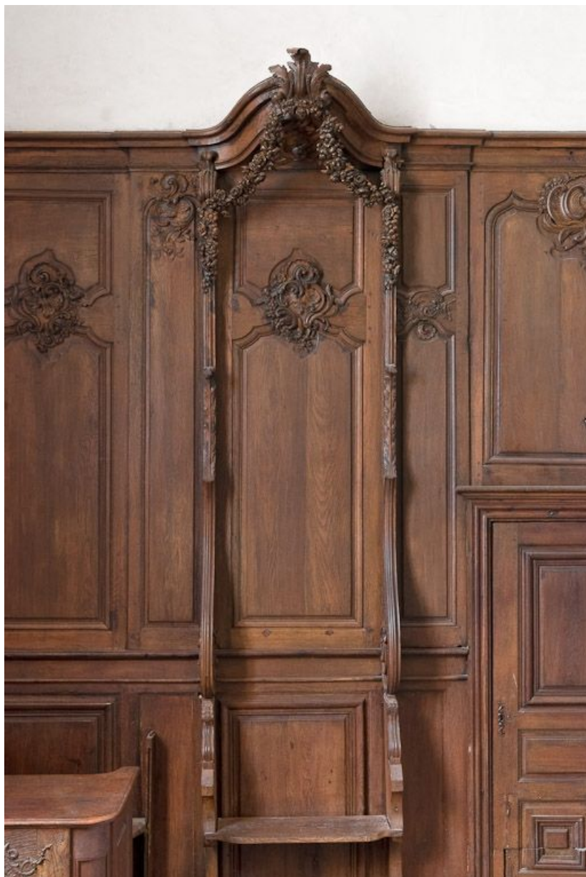
Stalle droite. 21, Volnay