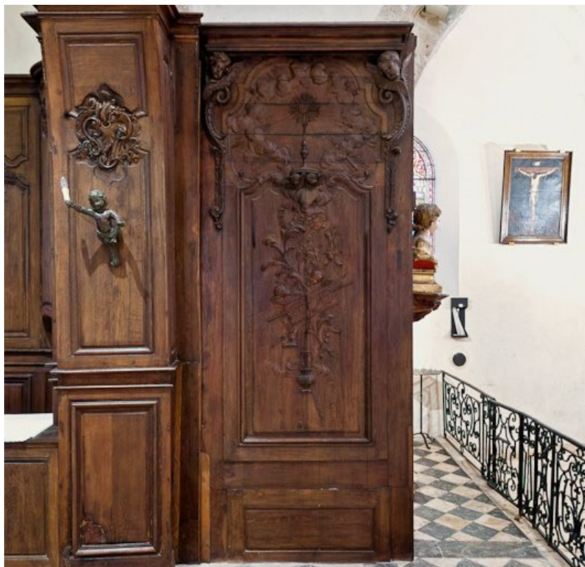
Lambris droit avant l'arcade du chœur.