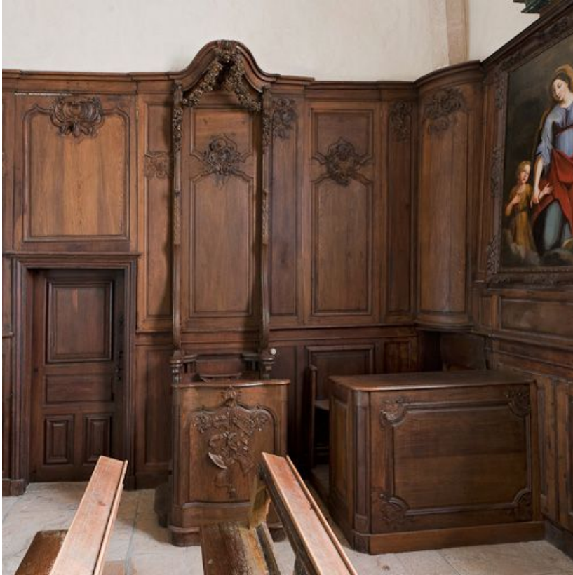
Stalle, banc de chœur et porte de la sacristie. 21, Volnay

N° de l'illustration : 20112100195NUC2AQ