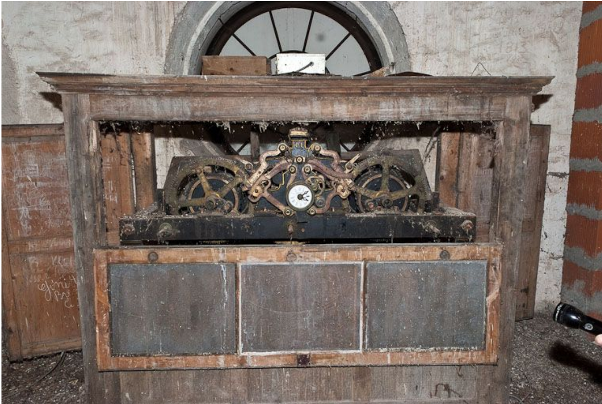
Mécanisme d'horloge : vue d'ensemble.