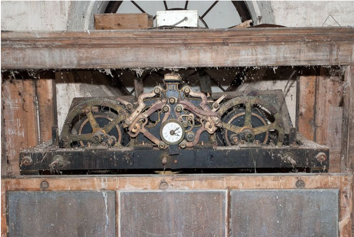
Mécanisme d'horloge : vue d'ensemble.