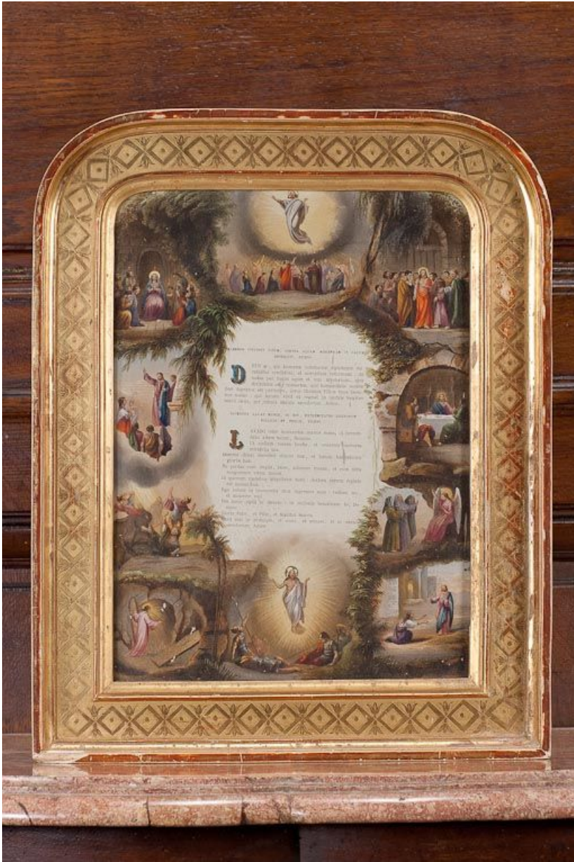
Canon latéral. 21, Pommard