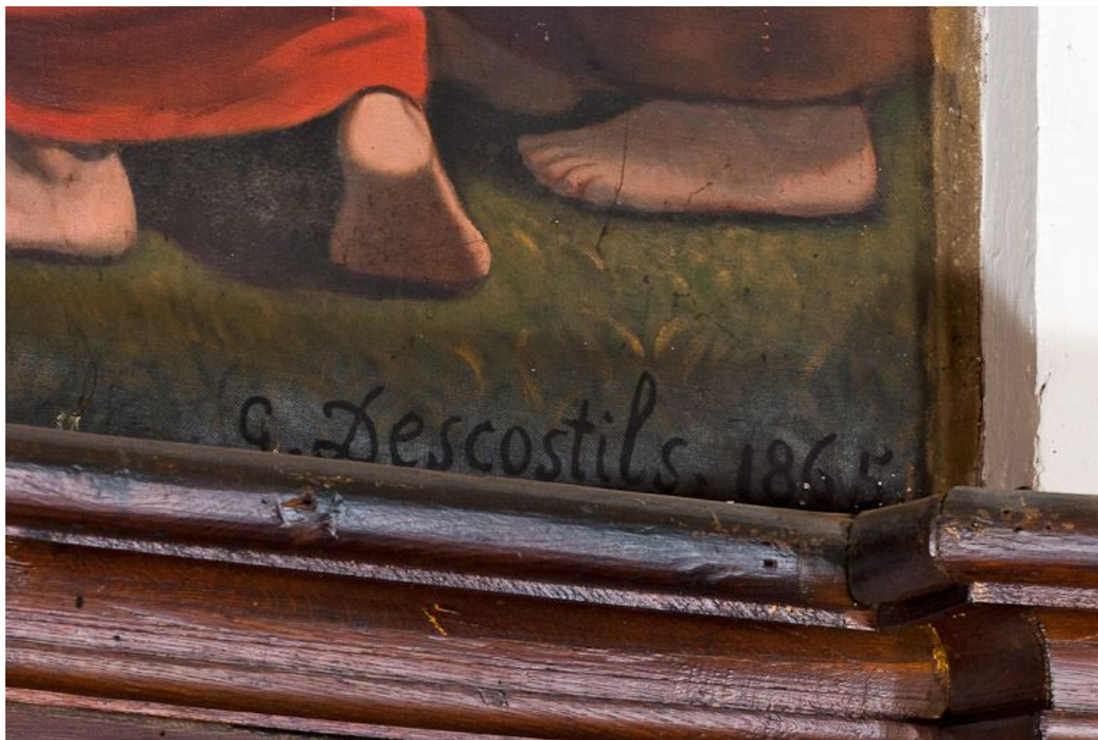
Remise des clefs à saint Pierre : signature. 21, Pommard