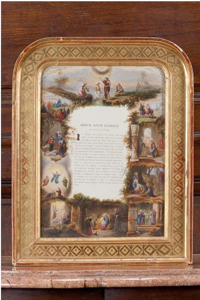
Canon latéral. 21, Pommard