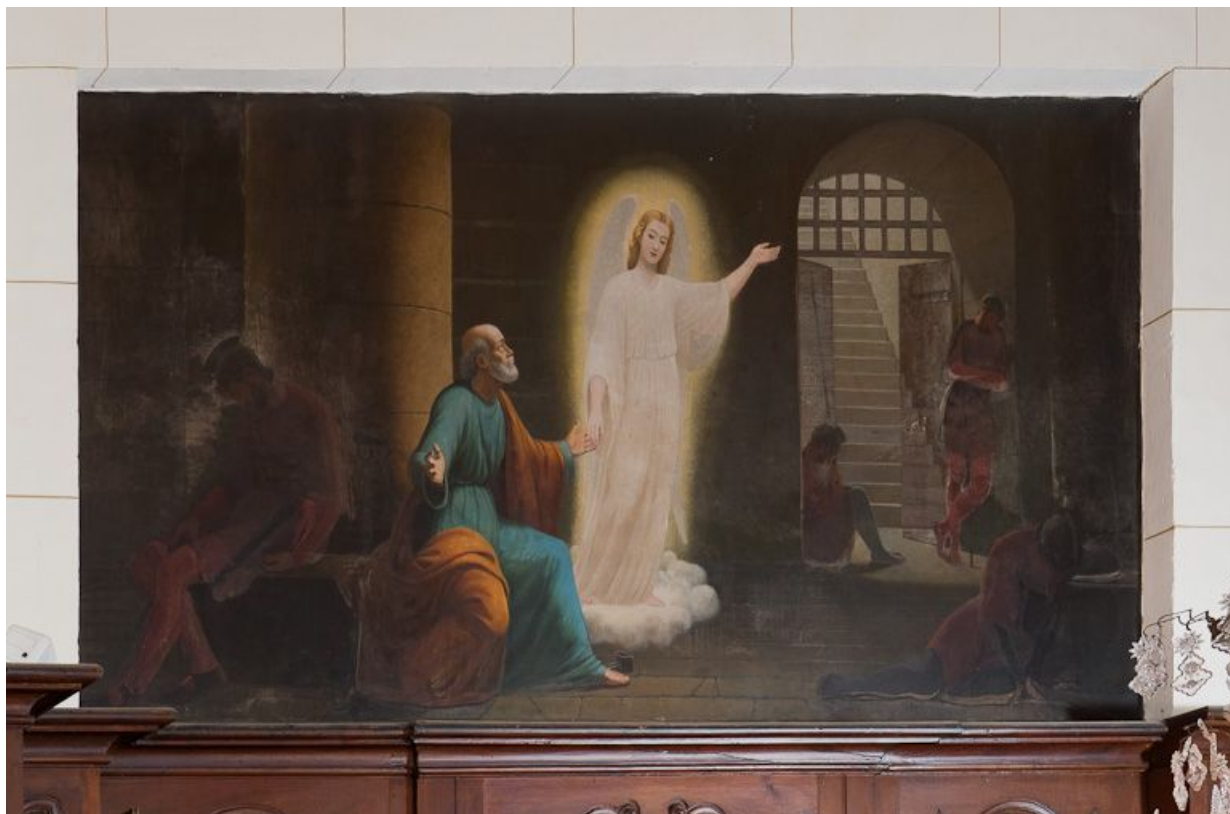
Délivrance de saint Pierre par un ange.