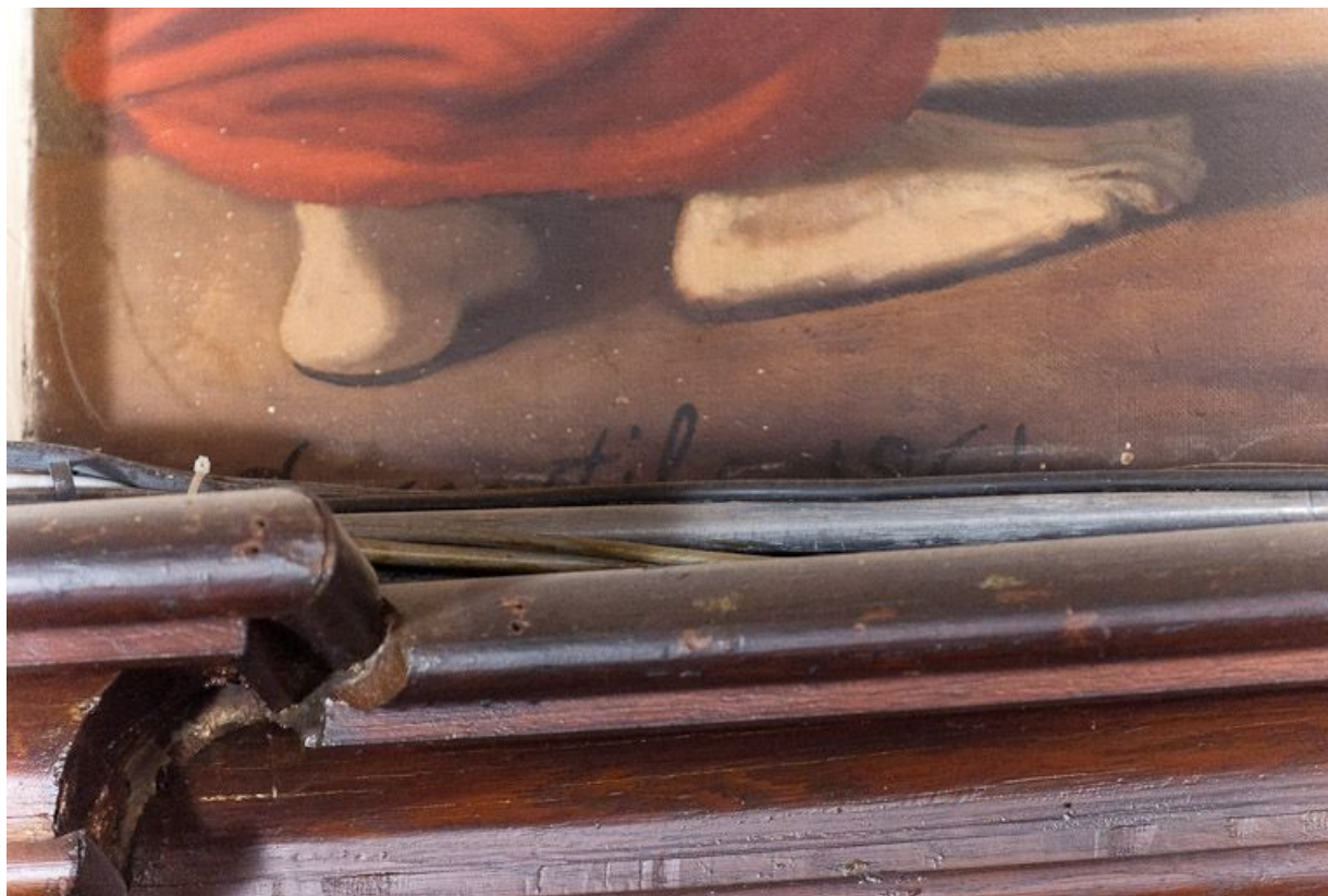
Vocation de saint Pierre : signature.