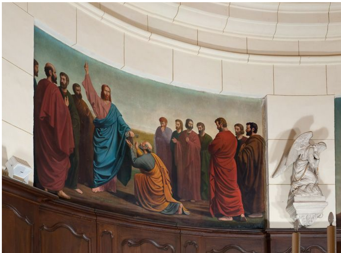
Remise des clefs à saint Pierre.