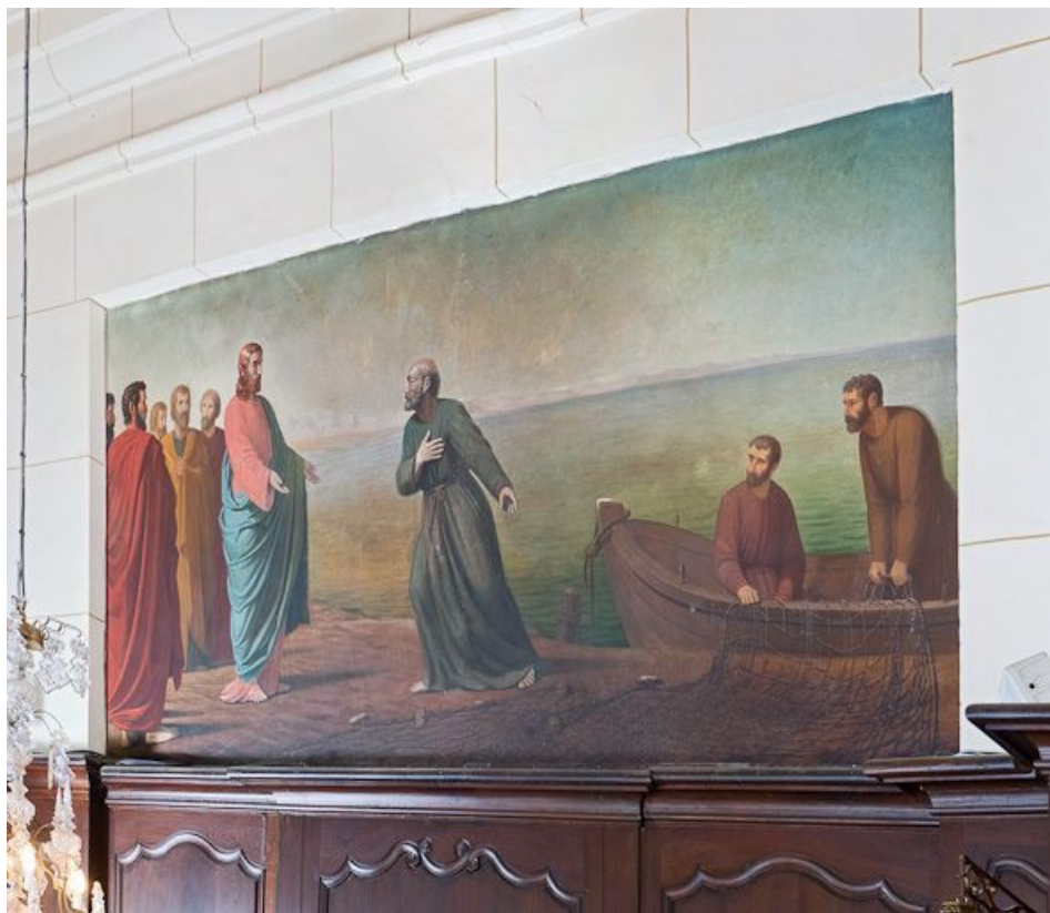
Vocation de saint Pierre.