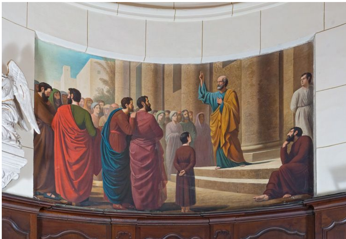
Prédication de Saint Pierre.