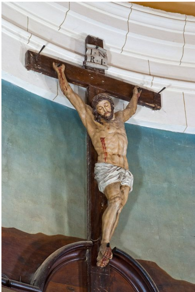
Vue d'ensemble. 21, Pommard