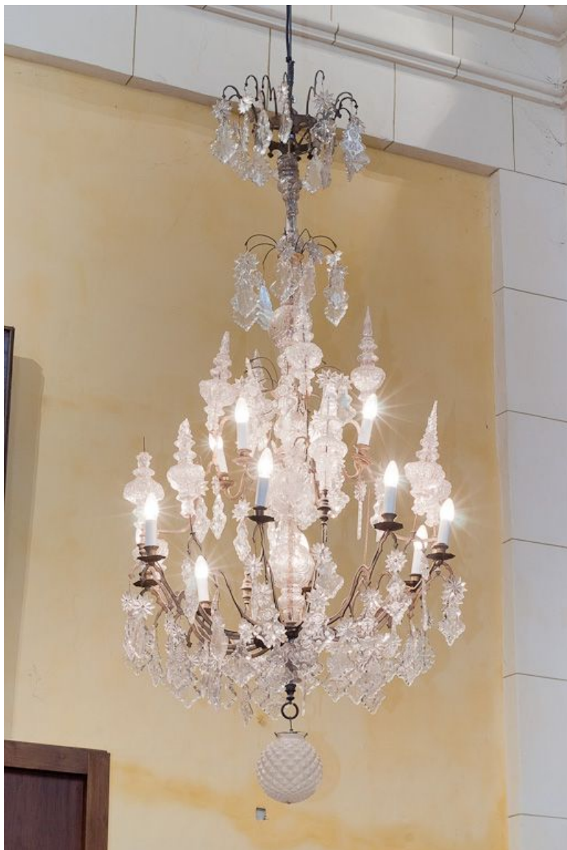
Vue du lustre du bras gauche du transept. 21, Pommard