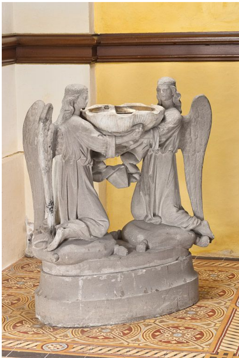
Vue d'ensemble sans couvercle.