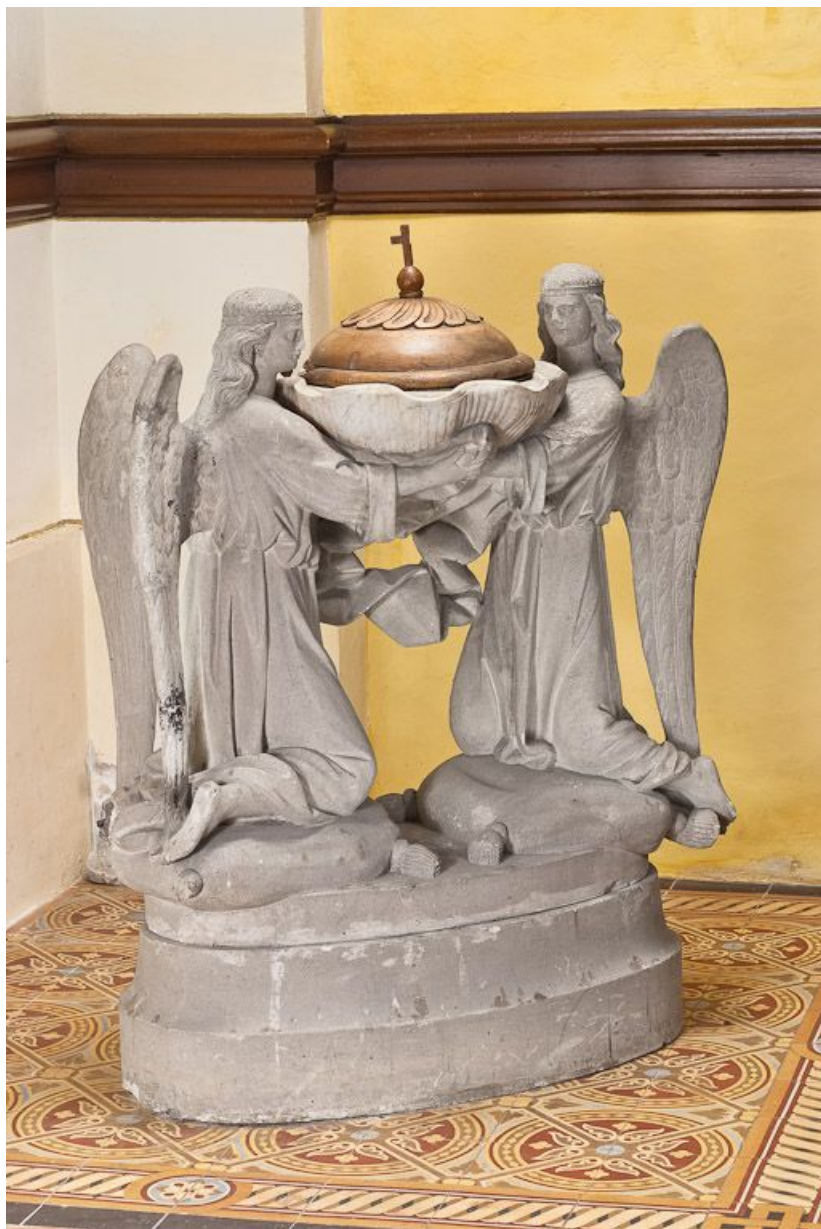
Vue d'ensemble avec couvercle.