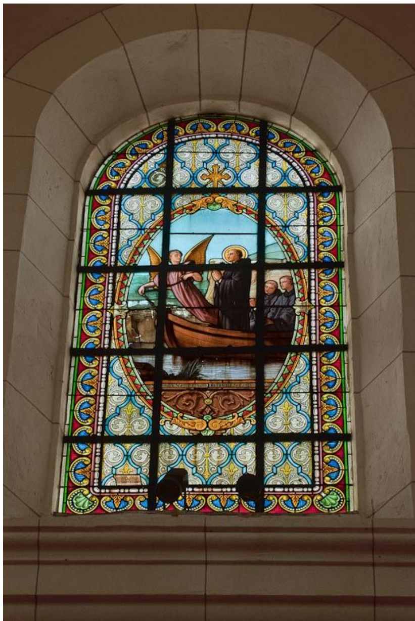
Vitrail : Saint Bertin dans une barque.