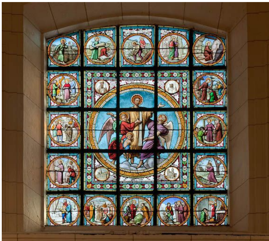
Vitrail : épisodes de la vie de saint Thibault.