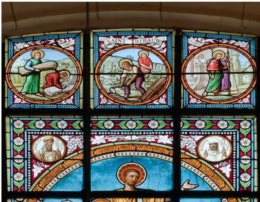
Vitrail : épisodes de la vie de saint Thibault, détail.