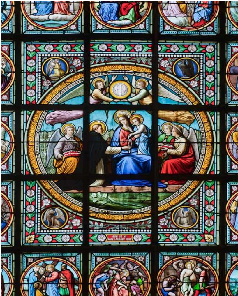
Vitrail, détail : Donation du rosaire à saint Dominique. 21, Pommard

N° de l'illustration : 20112100515NUC2AQ