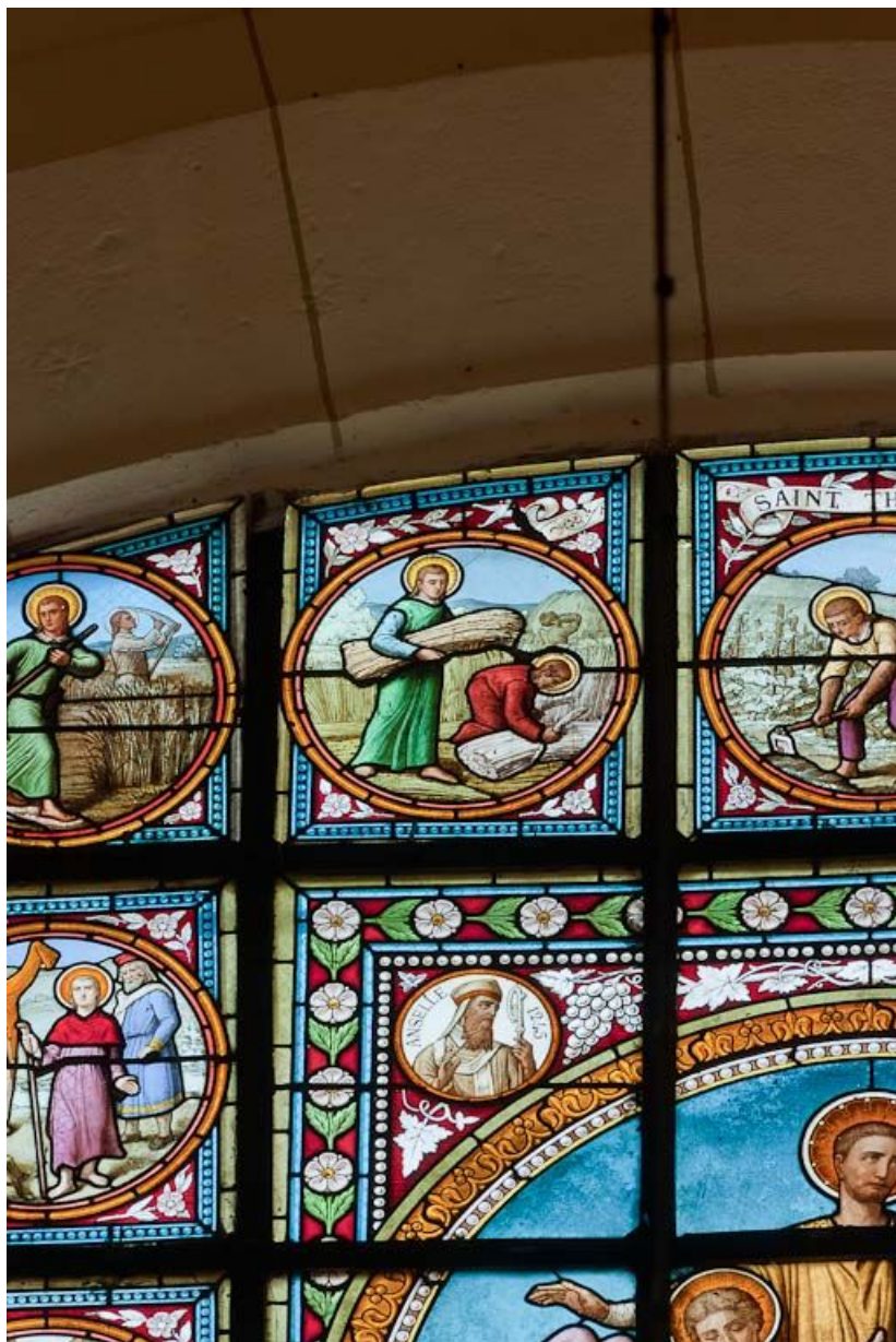
Vitrail : épisodes de la vie de saint Thibault, détail. 21, Pommard