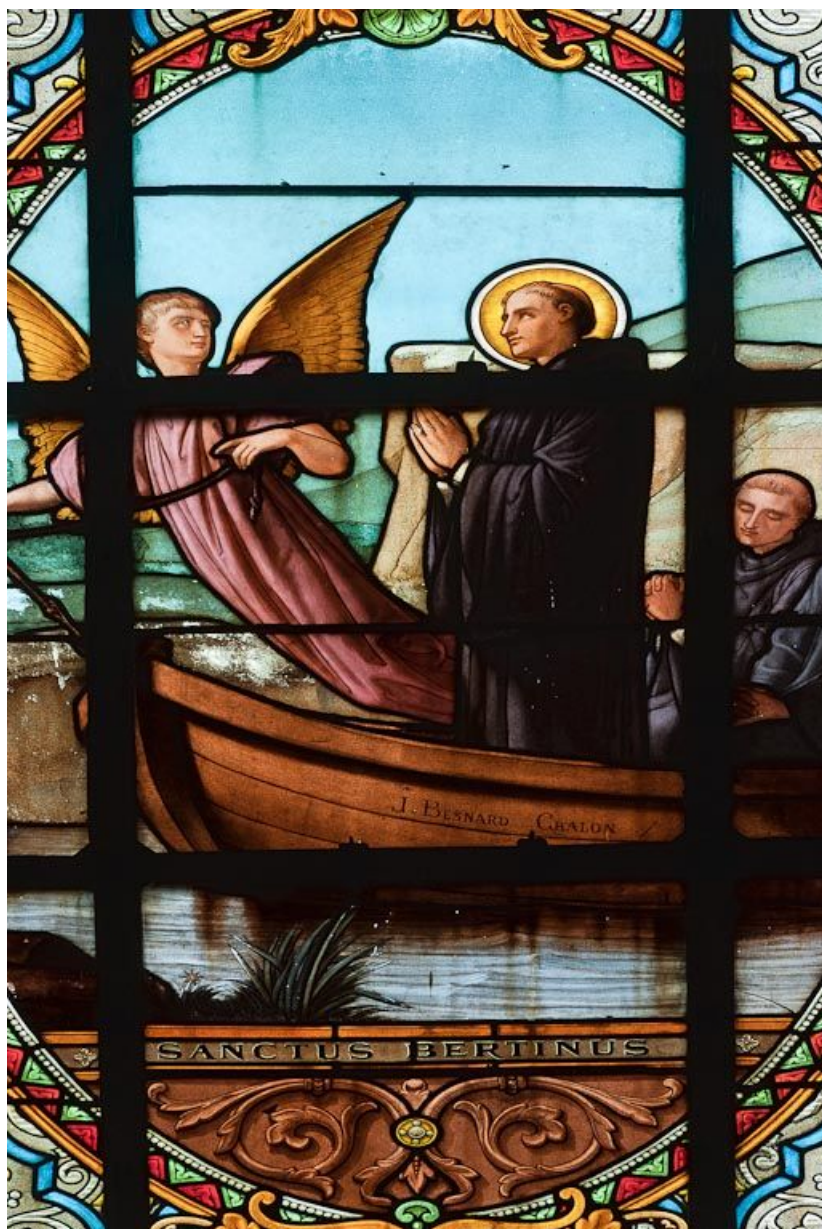
Vitrail : Saint Bertin dans une barque, détail. 21, Pommard