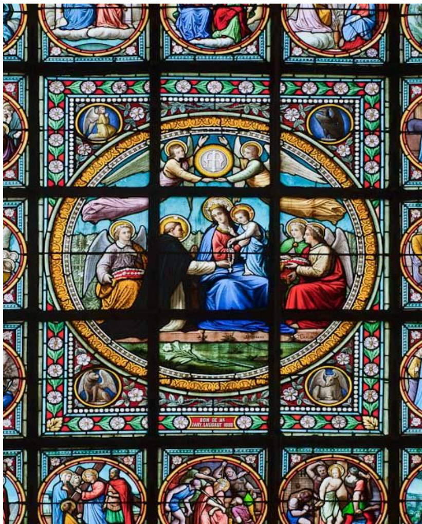
Vitrail, détail : Donation du rosaire à saint Dominique.